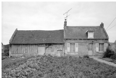
Vue générale. IVR22_19846001136X

Plan de situation. Extrait du plan cadastral de 1982, section CI 274. IVR22_20096000176NUCA