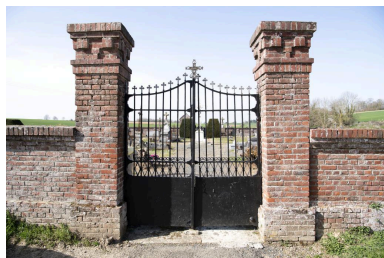
Entrée du cimetière côté sud. IVR32_20216000156NUCA