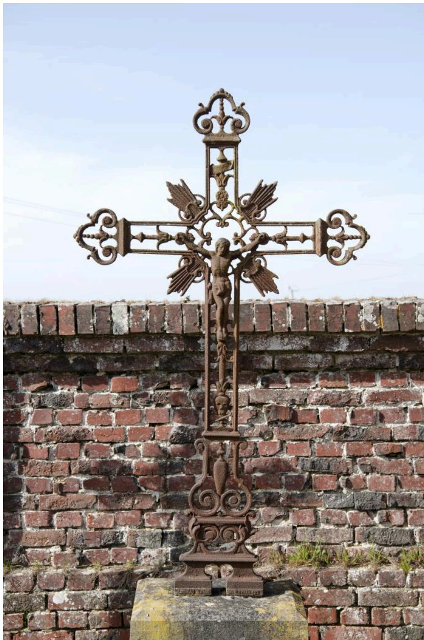
Croix de sépulture en fonte signée Alfred Corneau à Charleville.