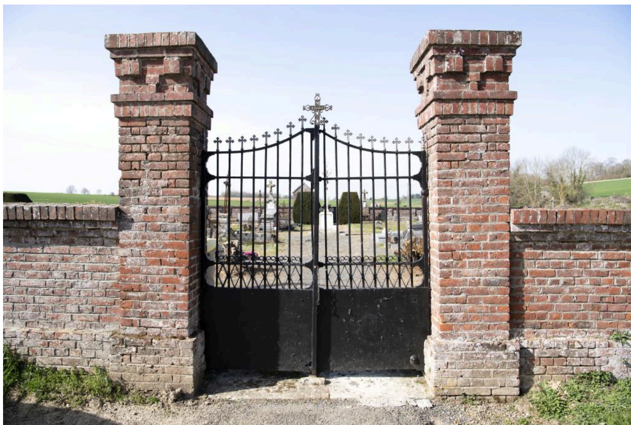
Entrée du cimetière côté sud.