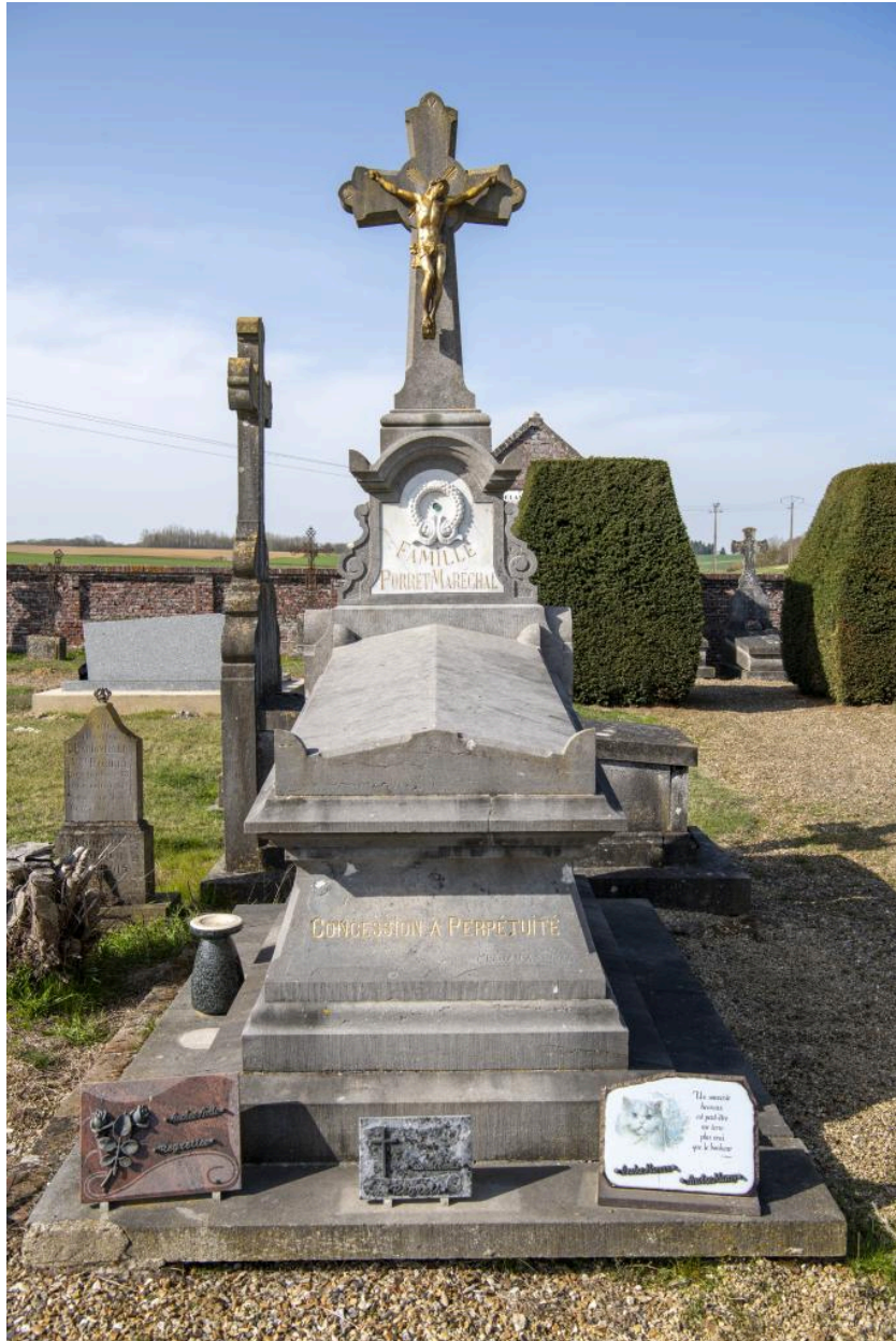
Tombeau de la famille Porret-Maréchal, signé Préjan à Saint-Just.