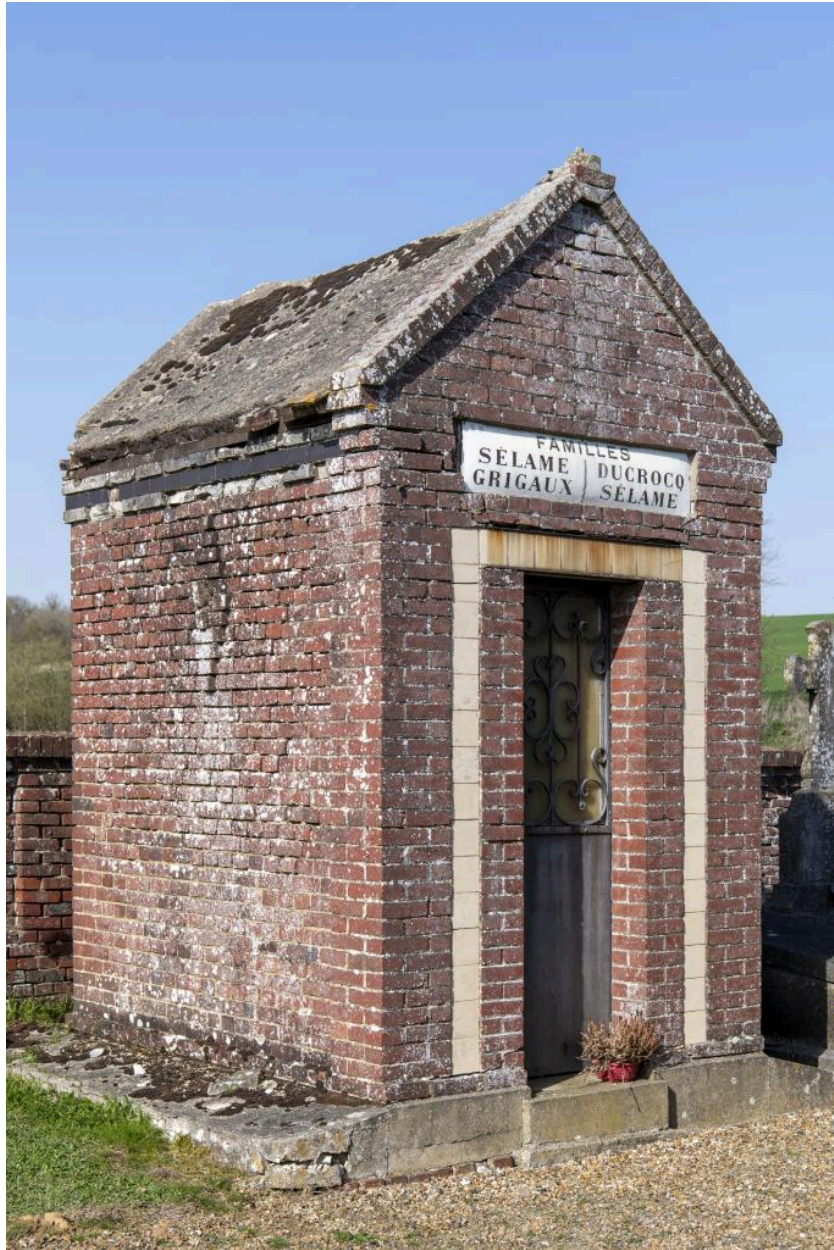
Tombeau en forme de chapelle des familles Sélame, Ducrocq et Grigaux.