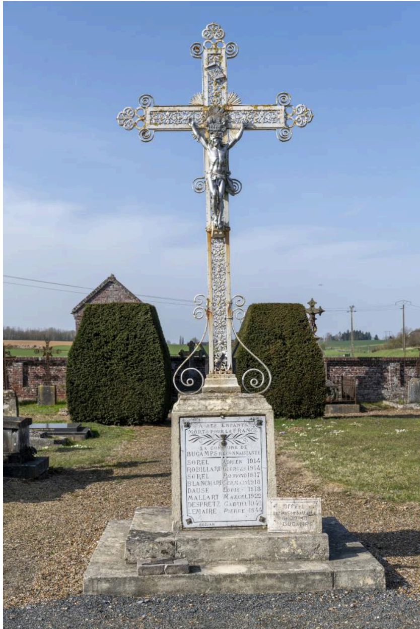
Croix du cimetière.