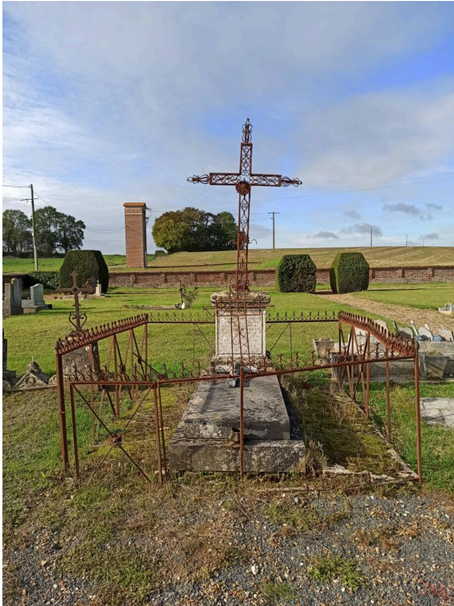
Tombeau de la famille Quette-Foy signé Ledoux à Saint-Just.