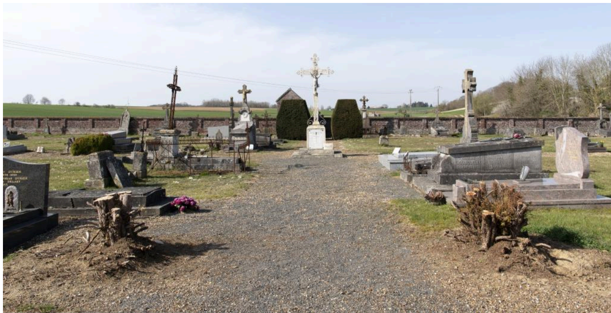
Vue générale depuis l'entrée.