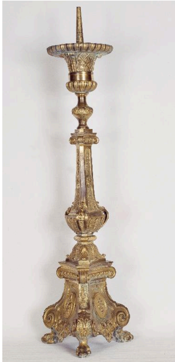
Vue d'un des chandeliers.