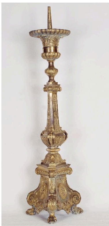
Vue d'un des chandeliers.