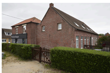
Pignon ouest et façade sud.