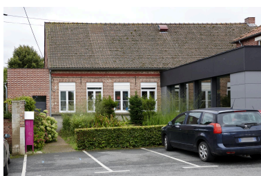
Vue partielle de la façade nord. IVR32_20245902947NUCA