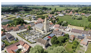
Vue aérienne du centre du village, l'école est à droite derrière le bâtiment rouge.