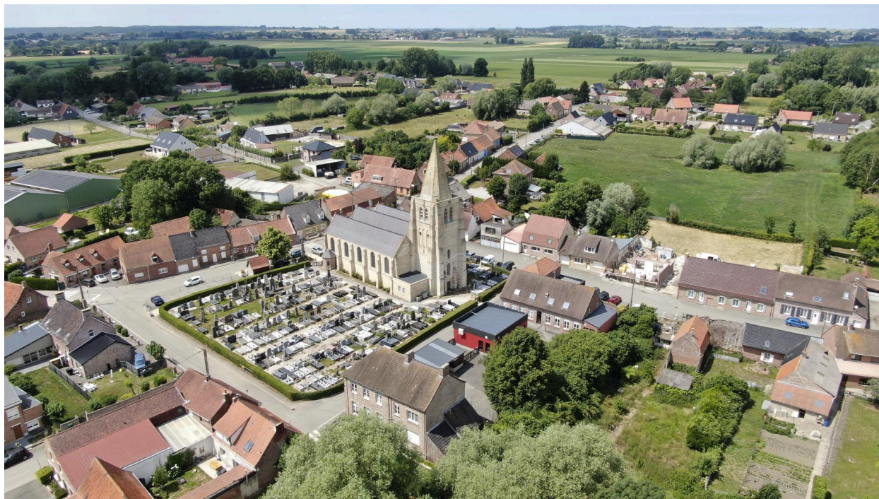
Vue aérienne du centre du village, l'école est à droite derrière le bâtiment rouge.