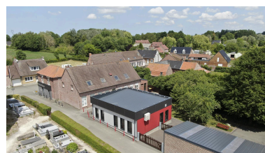
Vue aérienne, l'école se situe à l'arrière du bâtiment rouge.