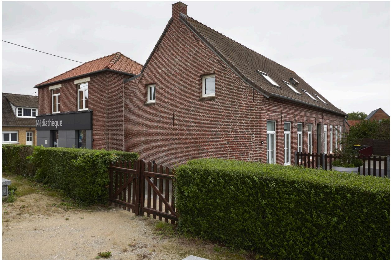
Pignon ouest et façade sud.