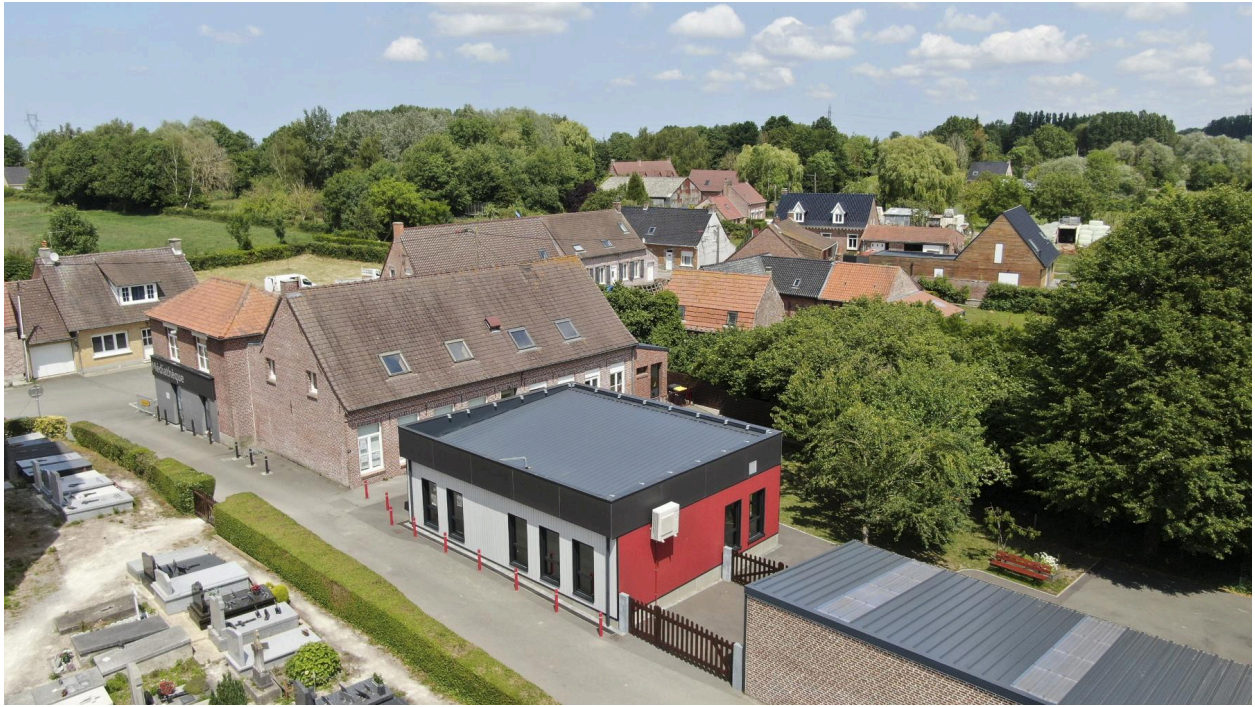
Vue aérienne, l'école se situe à l'arrière du bâtiment rouge.