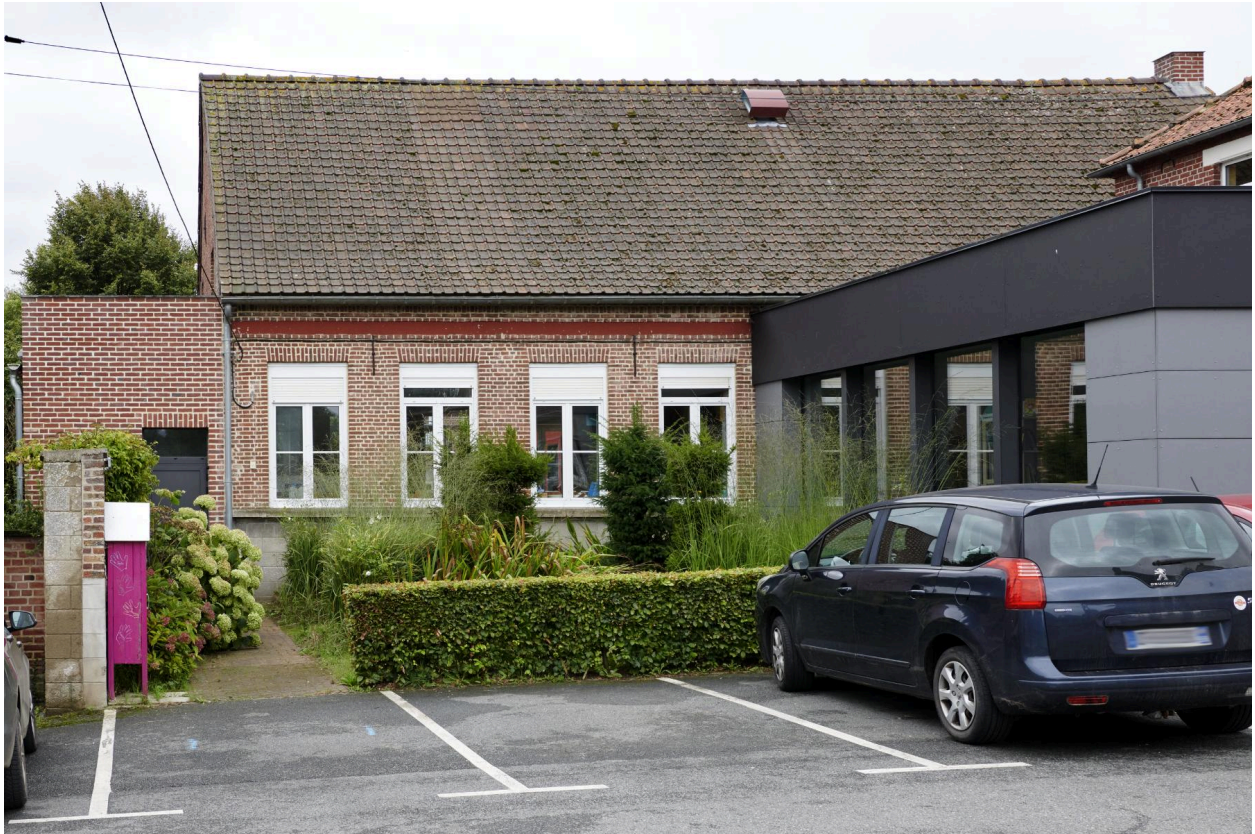
Vue partielle de la façade nord.