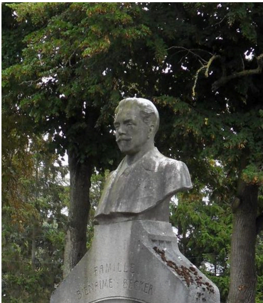
Buste de l'architecte A. Bienaimé, 1912, Albert Roze (sculpteur).