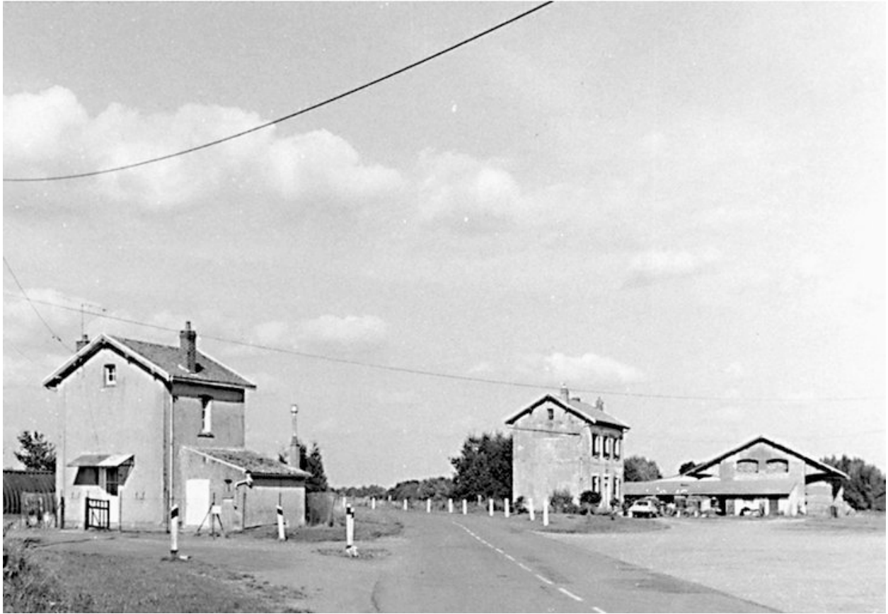
Ancienne gare : vue générale des bâtiments.