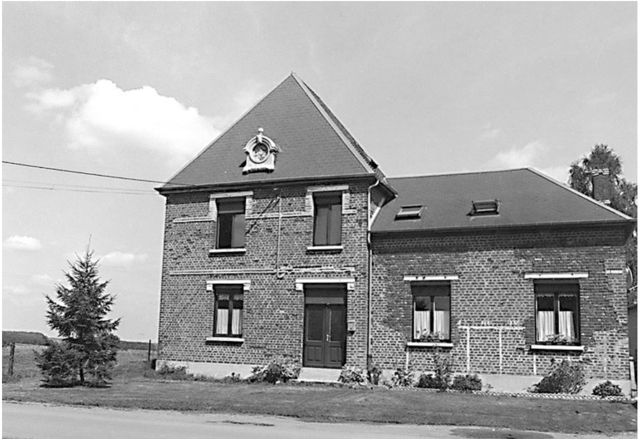
Ecole communale, rue du Moulin-Housseau : vue générale.