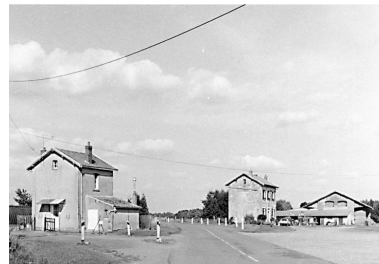
Ancienne gare : vue générale des bâtiments. IVR22_19980202687Z