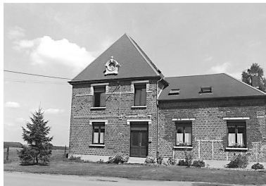
Ecole communale, rue du Moulin-Housseau : vue générale.