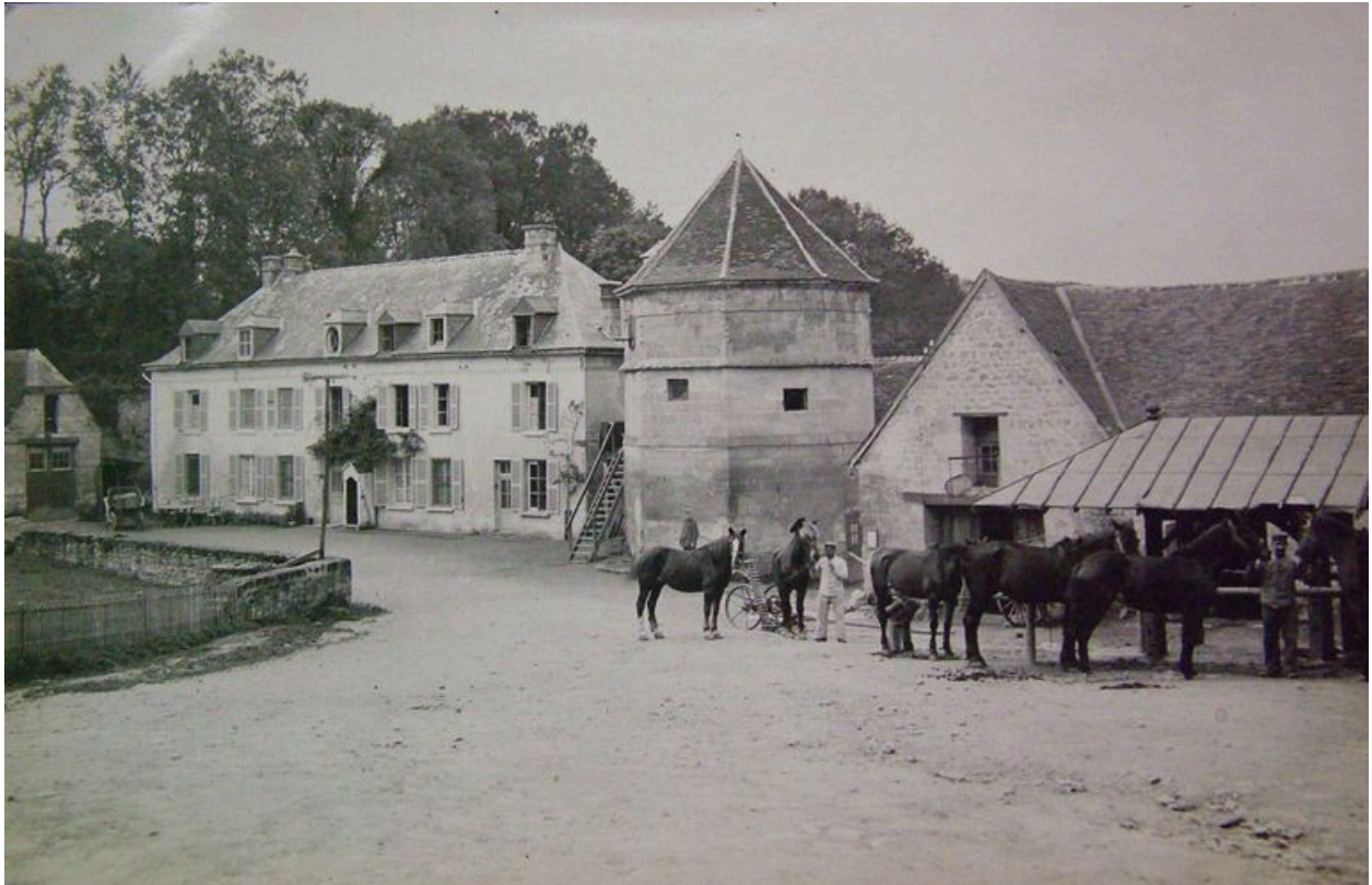
Vue ancienne pendant l'occupation ennemie.