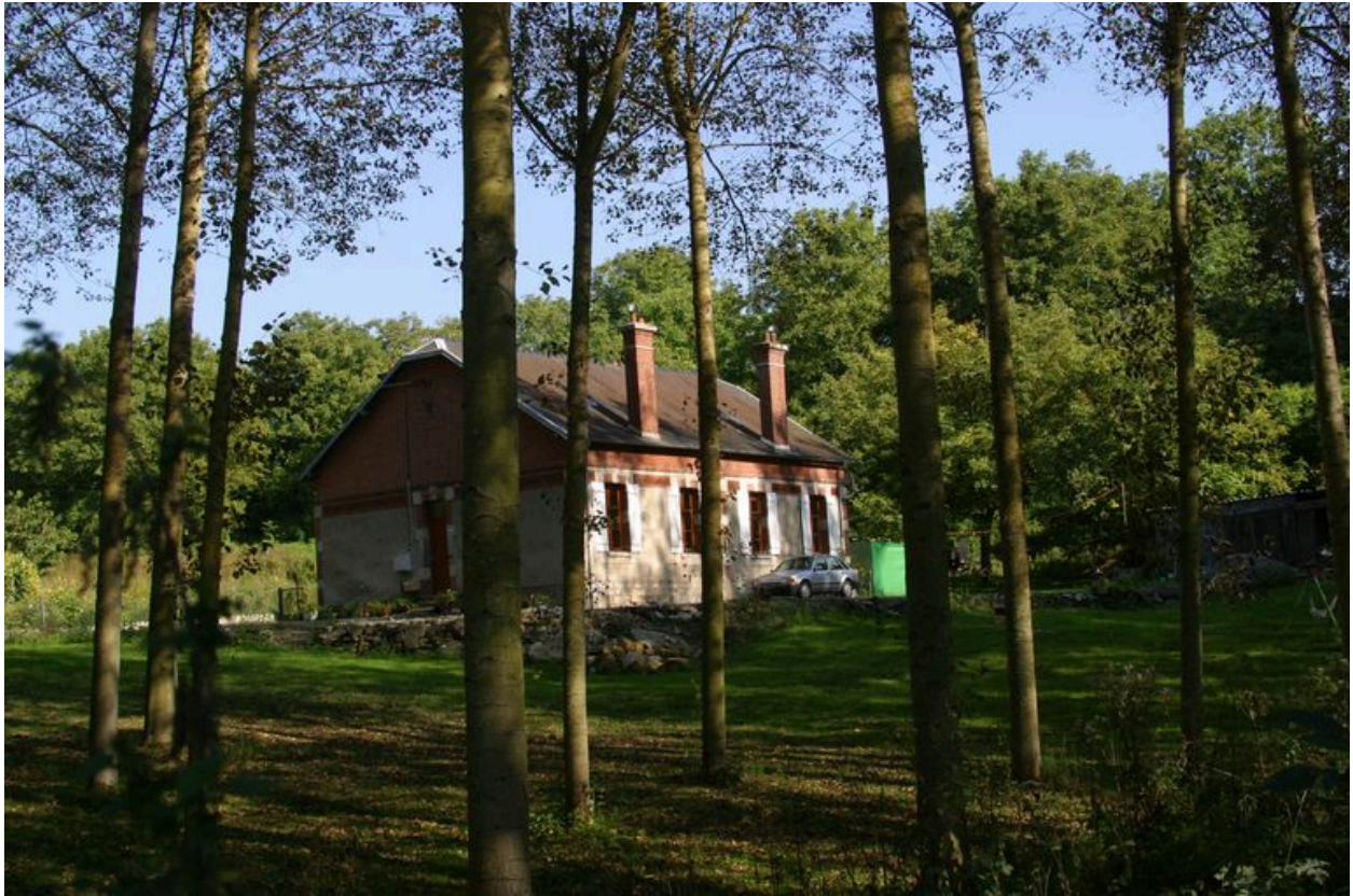
Vue d'une des trois maisons identiques dépendant de la ferme.