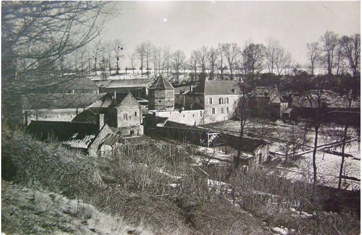
Autre vue ancienne.