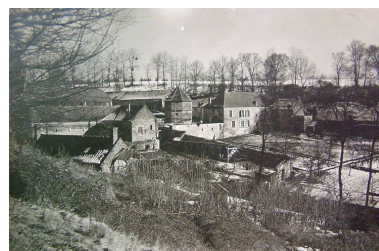
Autre vue ancienne (coll. part).