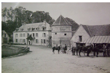
Vue ancienne pendant l'occupation ennemie (coll. part).