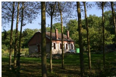
Vue d'une des trois maisons identiques dépendant de la ferme. IVR22_20050200881NUCA