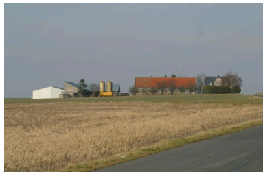
Vue générale. IVR22_20050200720NUCA