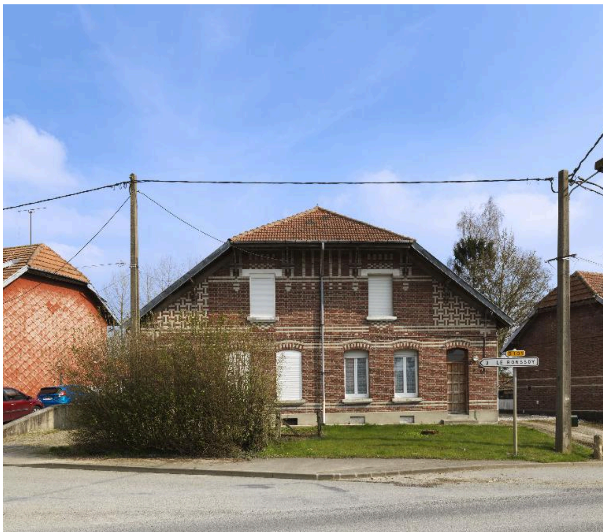
Maison à deux logements.