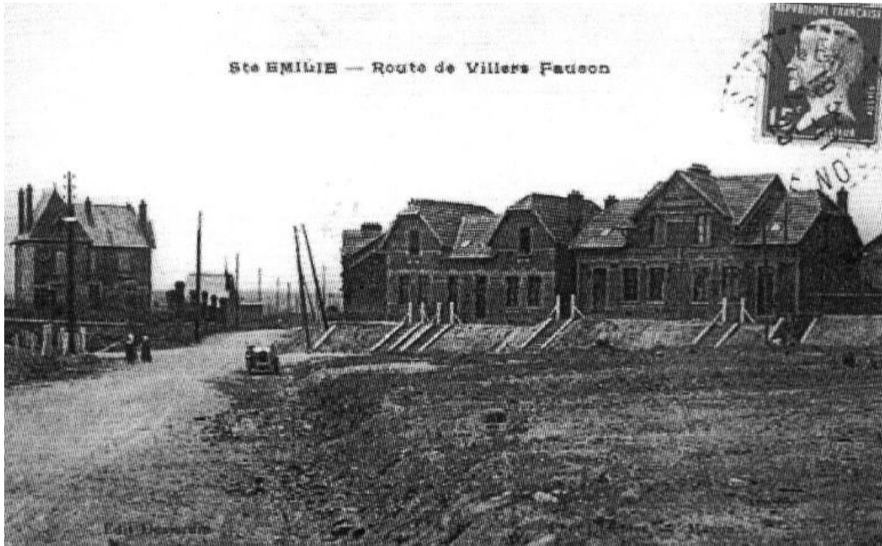
Route de Villers-Faucon, vers 1925 (AD Somme ; 8 Fi 4735).