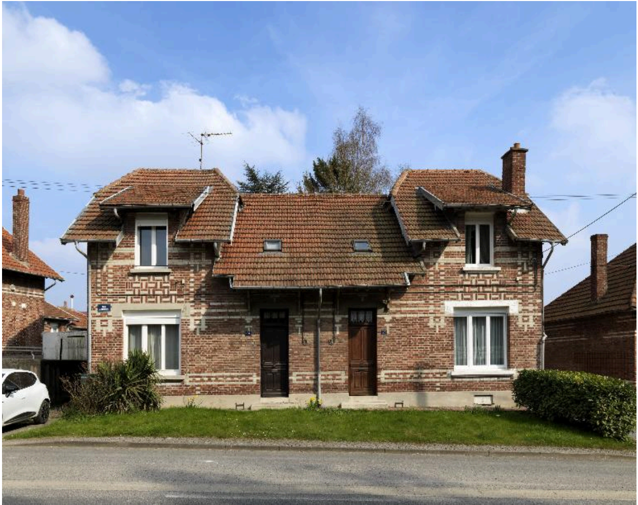
Maison à deux logements (25-26 rue de Roisel).