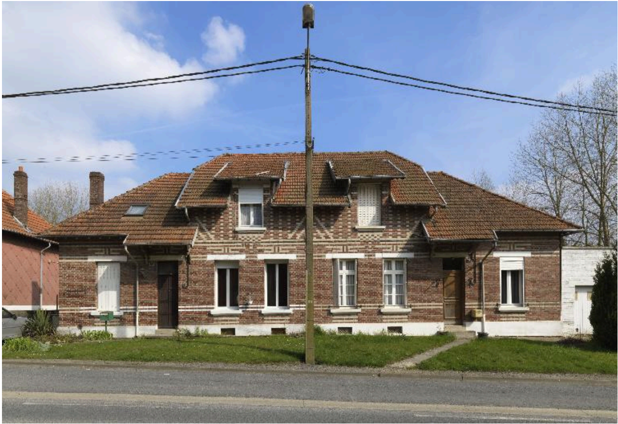
Maison à deux logements (21-22, rue de Roisel).