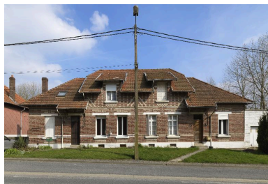
Maison à deux logements (21-22, rue de Roisel). IVR22_20158000236NUC2A