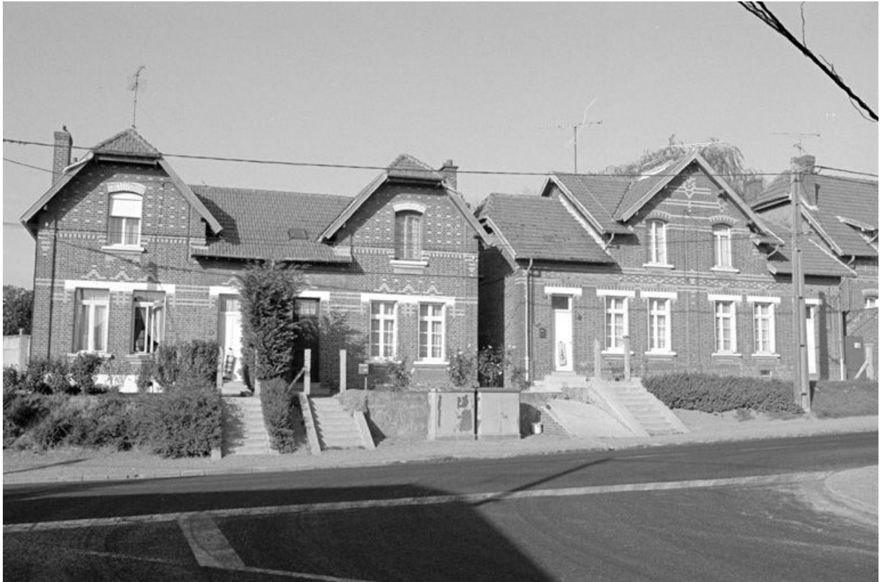
Logement d'ouvriers, vue partielle.