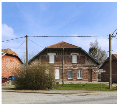
Maison à deux logements.