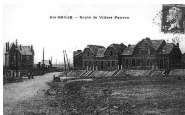
Route de Villers-Faucon, vers 1925 (AD Somme ; 8 Fi 4735).

Phot. Gilles-Henri Bailly (reproduction) IVR22_20158005806NUCA