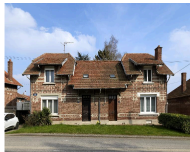
Maison à deux logements (25-26 rue de Roisel). IVR22_20158000238NUC2A