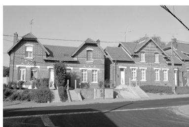
Logement d'ouvriers, vue partielle.