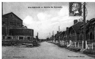
Route de Ronssoy, vers 1925 (AD Somme ; 8 Fi 4736).

Phot. Gilles-Henri Bailly (reproduction) IVR22_20158005806NUCA