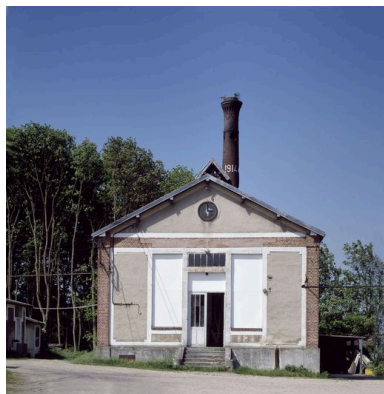
Chaufferie : élévation antérieure. IVR22_19936001826XA