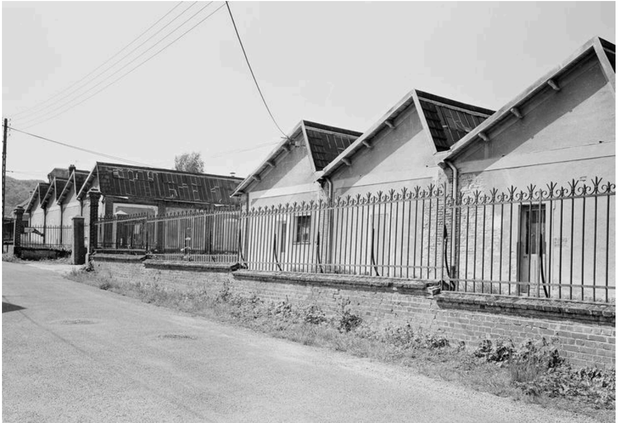
Atelier de fabrication.