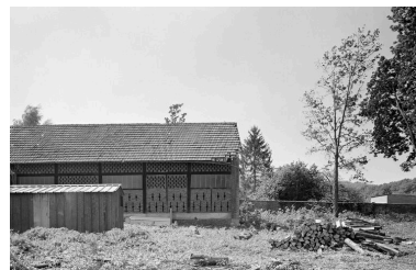
Entrepôt industriel. IVR22_19936000524X