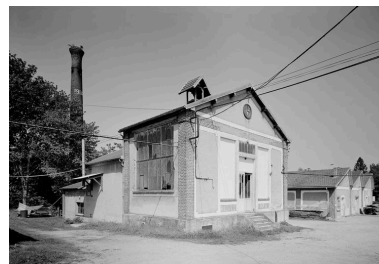
La chaufferie avec sa cheminée et les ateliers en shed à l'arrière plan.