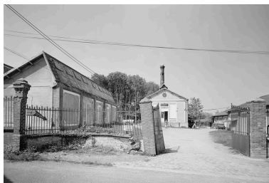
Entrée principale, chaufferie et atelier de fabrication.