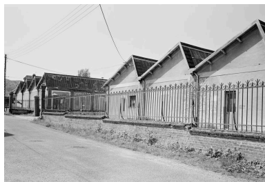
Atelier de fabrication. IVR22_19936000528X