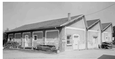
Atelier de fabrication. IVR22_19936000523X