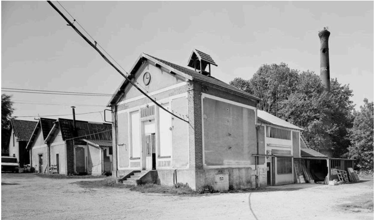
Chaufferie : élévation antérieure.