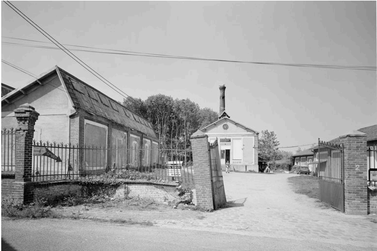
Entrée principale, chaufferie et atelier de fabrication.