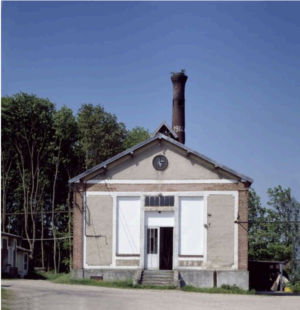
Chaufferie : élévation antérieure.