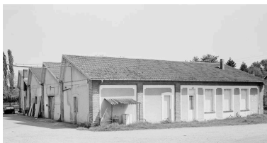
Atelier de fabrication. IVR22_19936000525X