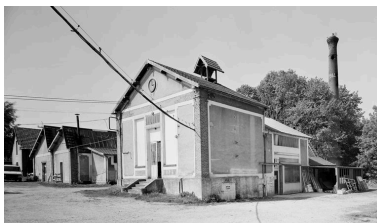
Chaufferie : élévation antérieure. IVR22_19936000710V