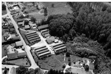
Vue aérienne. Phot. Phot'R