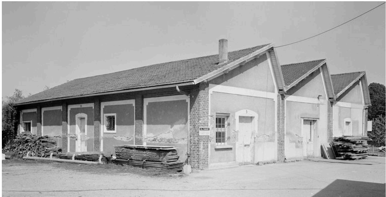
Atelier de fabrication.