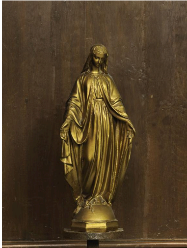
Statue : l'Immaculée Conception