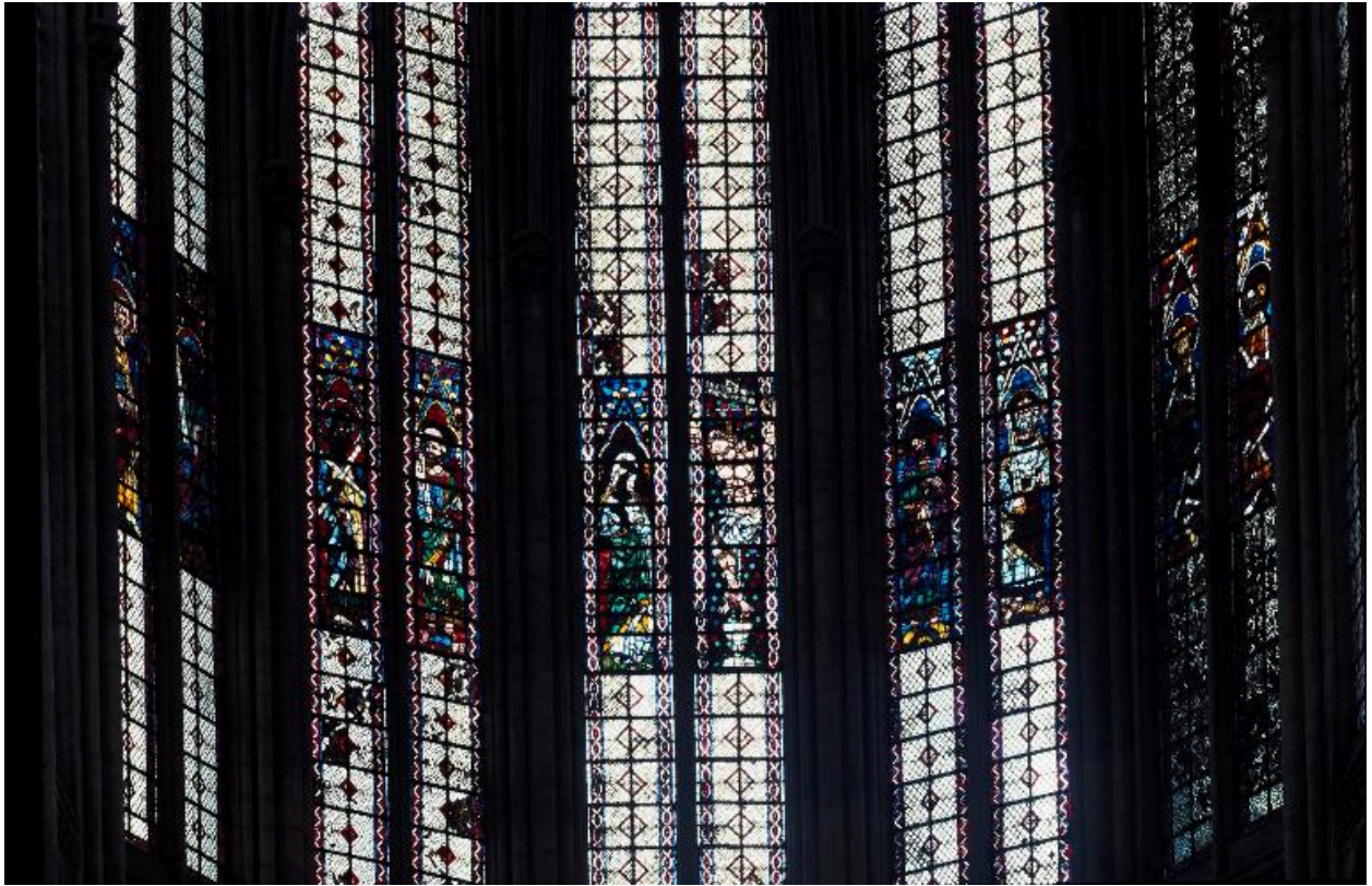
Vue des baies 300 à 306.