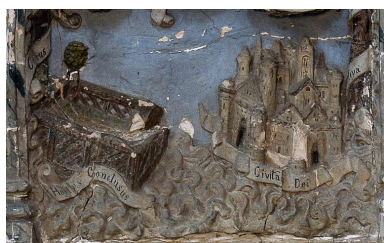
Vue de détail : le jardin clos et la Civitas Dei (registre inférieur du relief).

IVR22_20148000735NUC2A