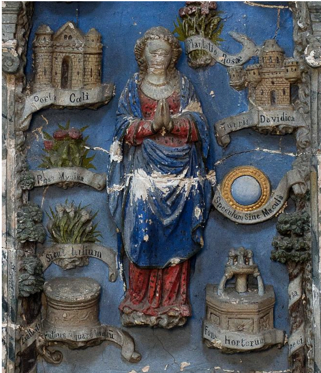
Vue de détail : la Vierge et quelques-uns de ses emblèmes (partie centrale du relief).