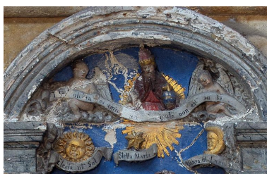
Vue de détail : Dieu le Père béni entouré d'anges (partie supérieure du relief).

Phot. Marie-Laure Monnehay-Vulliet IVR22_20148000736NUC2A