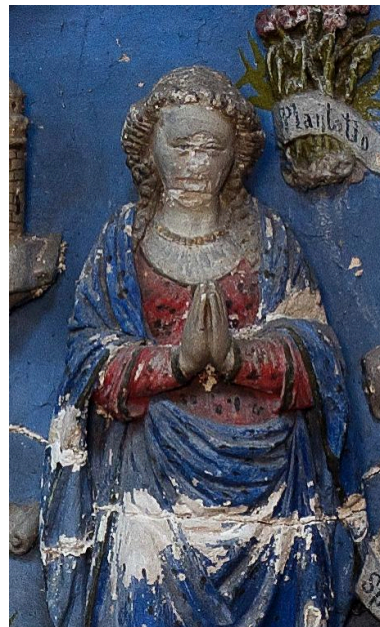
Vue de détail : la Vierge en prière.

IVR22_20148000738NUC2A