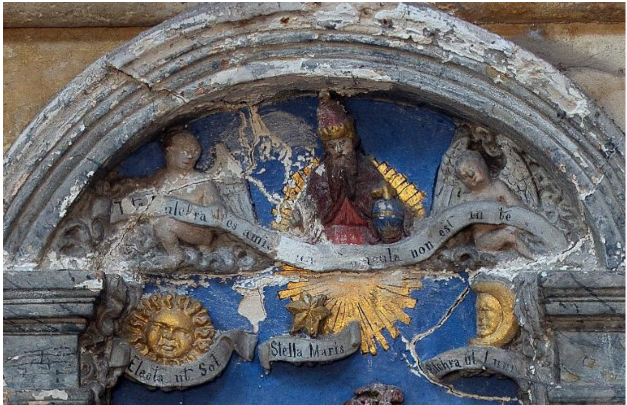
Vue de détail : Dieu le Père bénissant entouré d'anges (partie supérieure du relief).