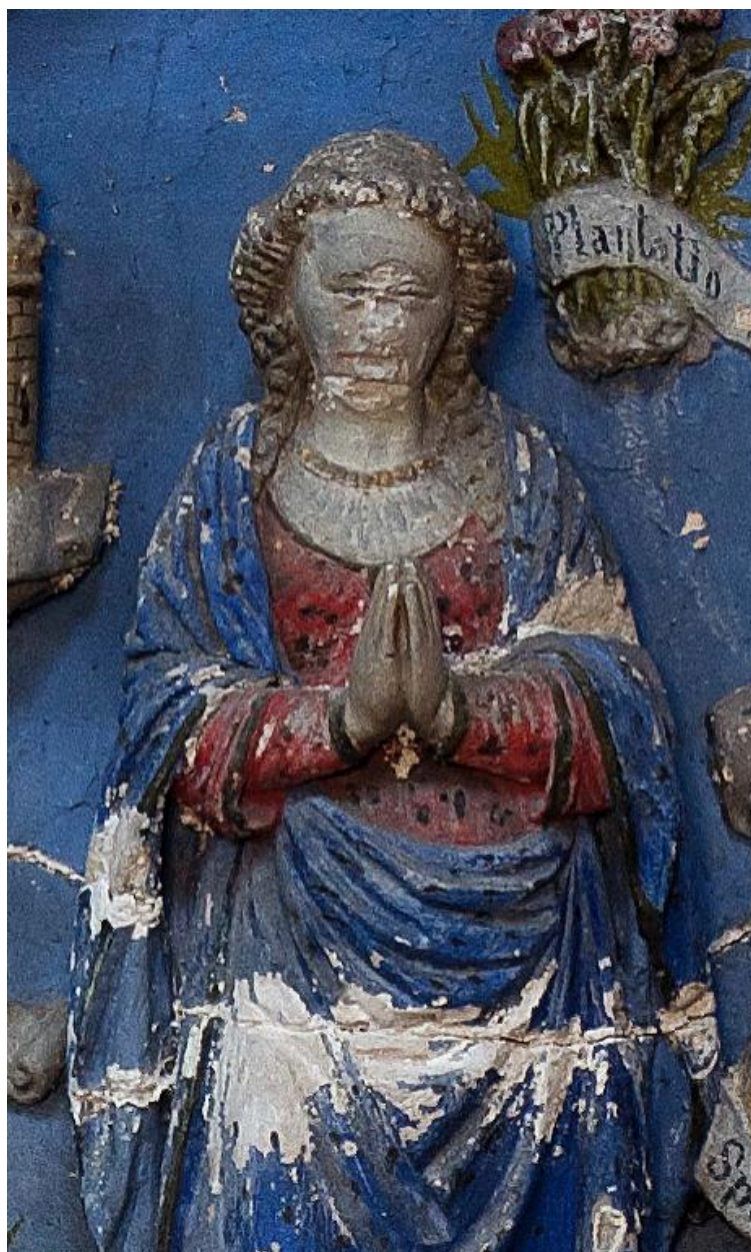
Vue de détail : la Vierge en prière.