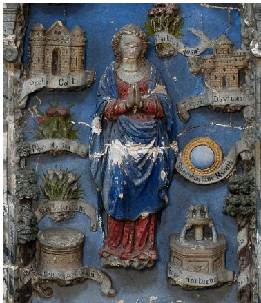
Vue de détail : la Vierge et quelques-uns de ses emblèmes (partie centrale du relief).

Phot. Marie-Laure Monnehay-Vulliet IVR22_20148000294NUC2A