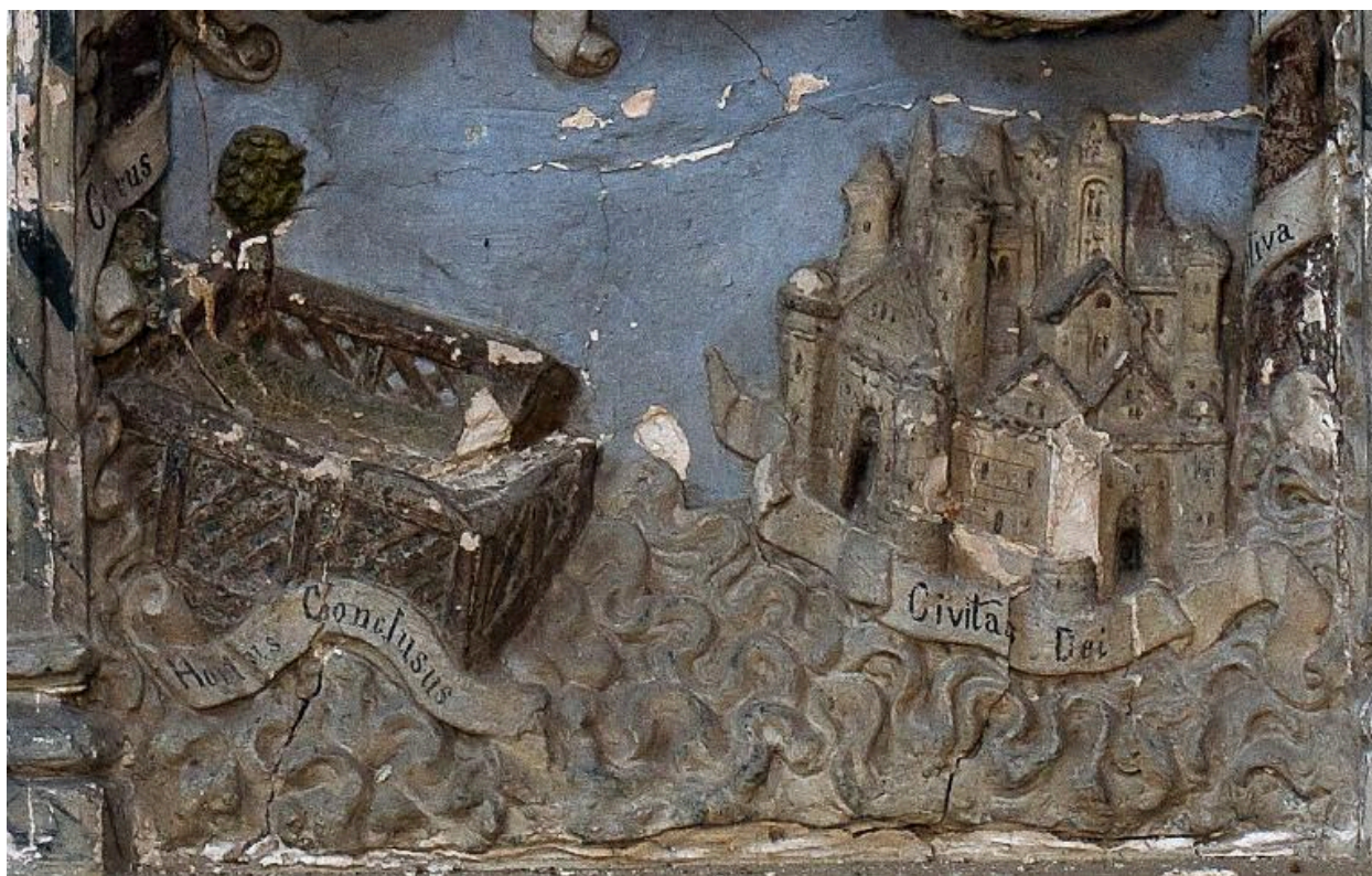
Vue de détail : le jardin clos et la Civitas Dei (registre inférieur du relief).