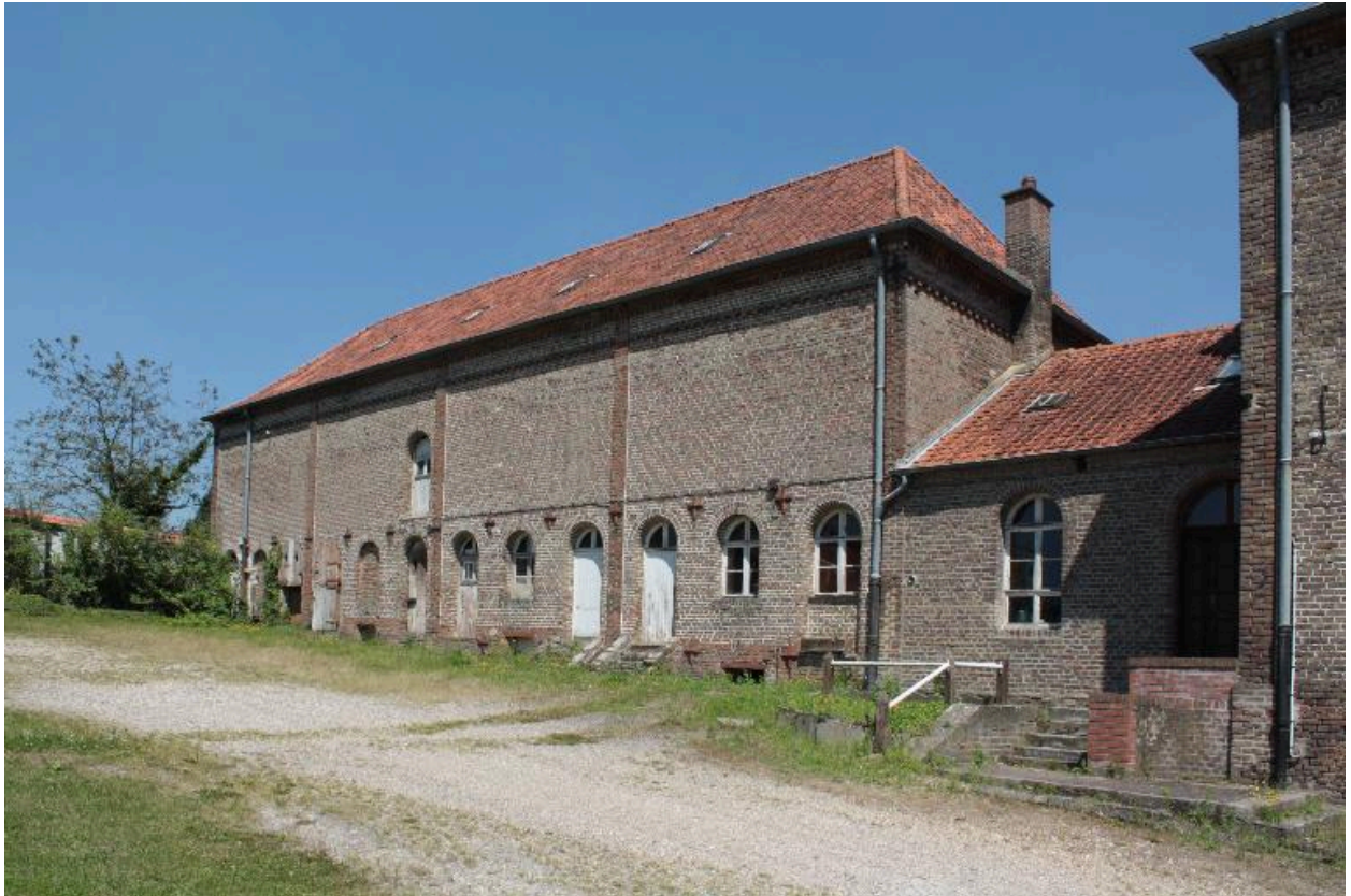
Façade sur cour de la laiterie, vue de trois-quarts.