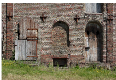
Détail des ouvertures sur cour de la laiterie. IVR22_20138016132NUC2A