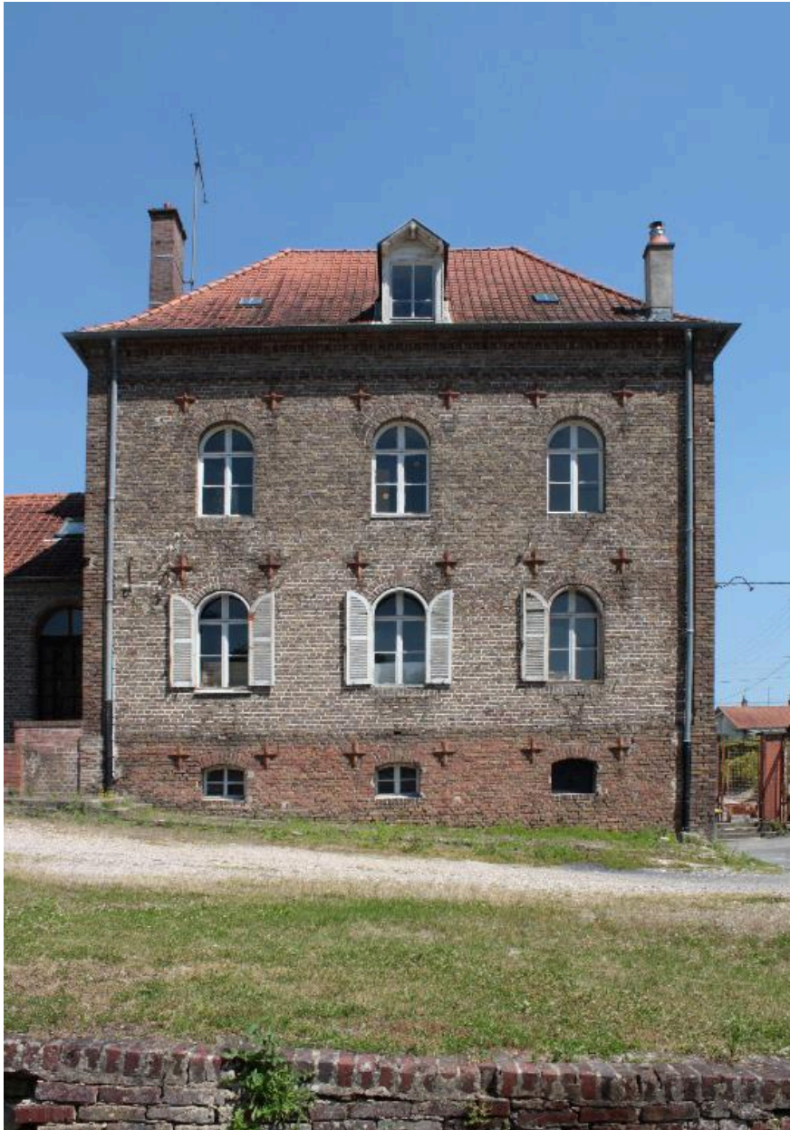
Logis de la ferme, façade sur cour.