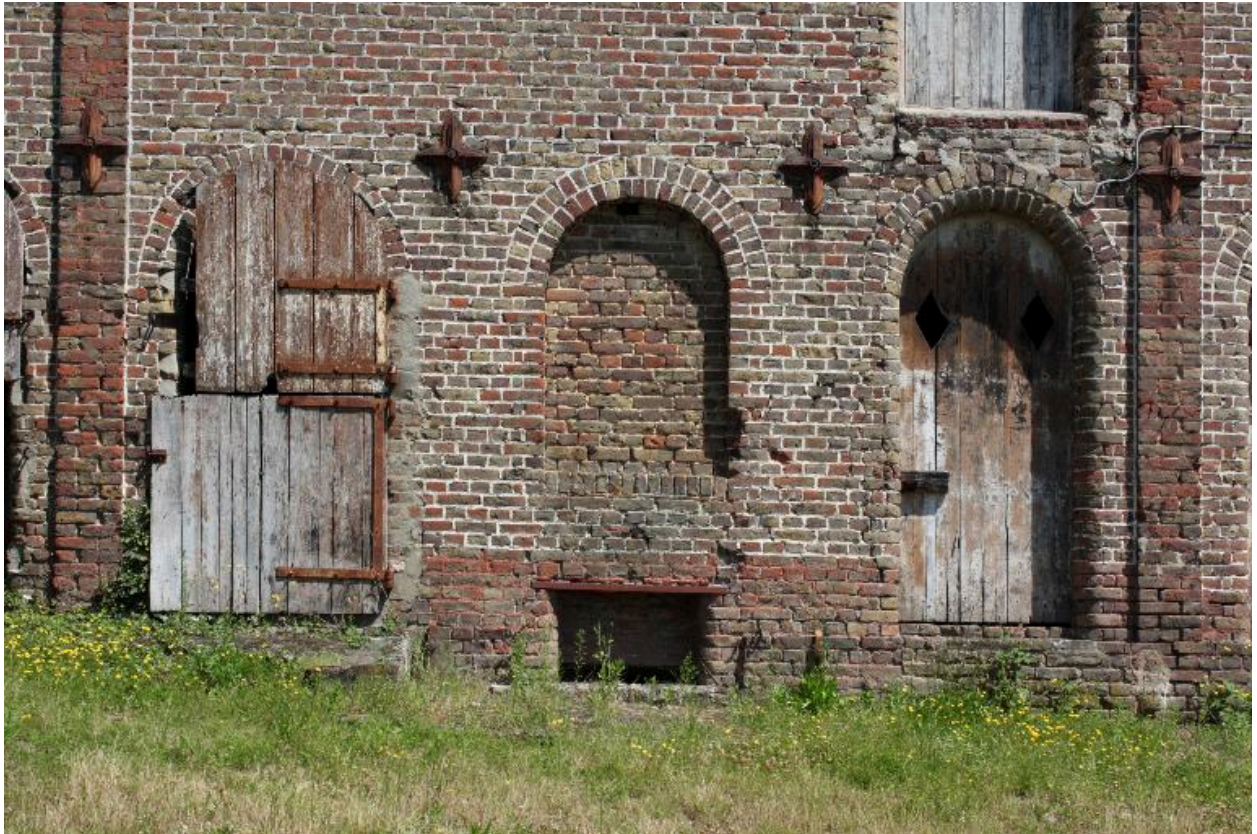
Détail des ouvertures sur cour de la laiterie.