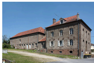
Façade sur cour de l'habitation de ferme et de la laiterie attenante. IVR22_20138016128NUC2A