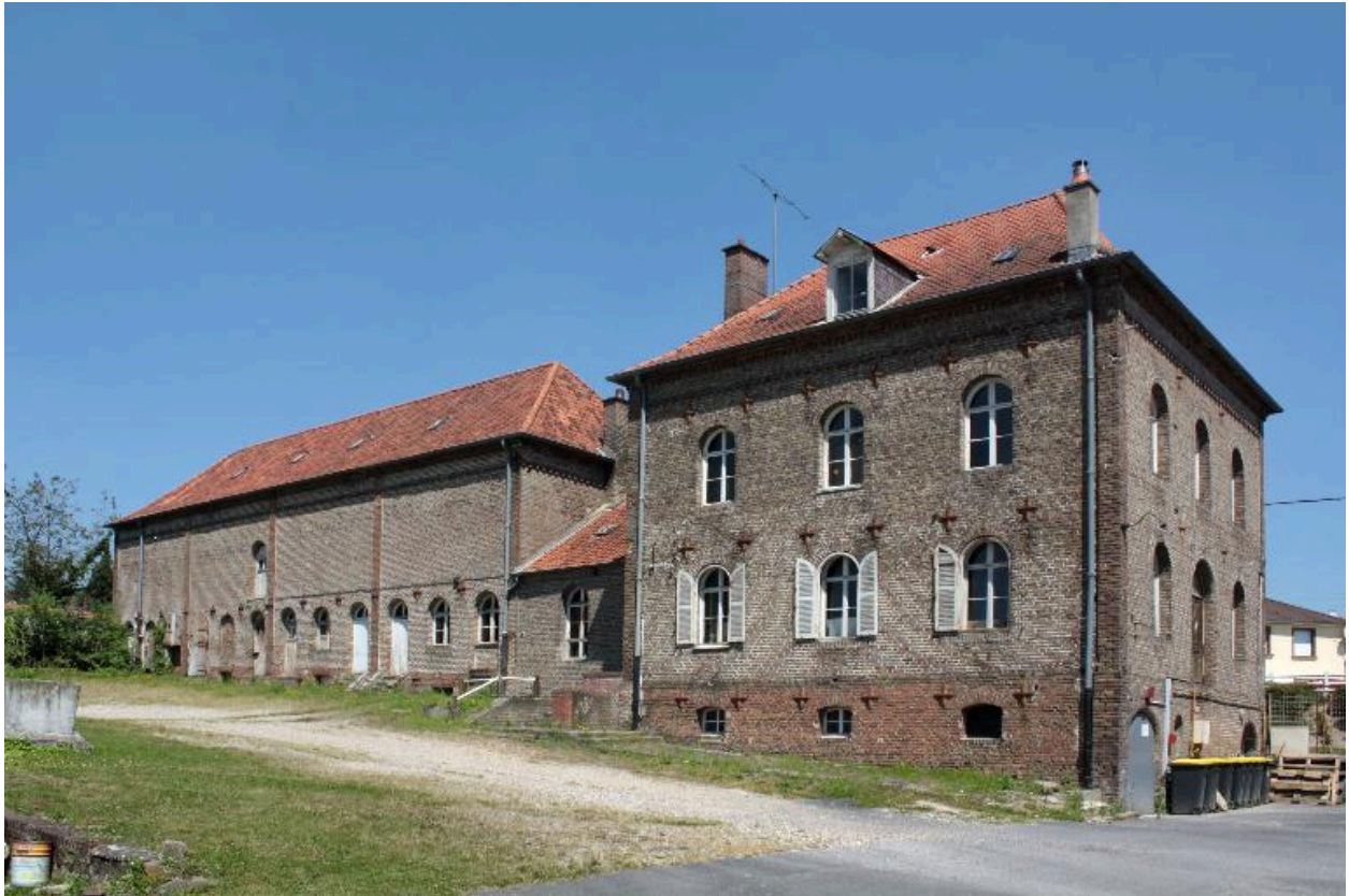
Façade sur cour de l'habitation de ferme et de la laiterie attenante.