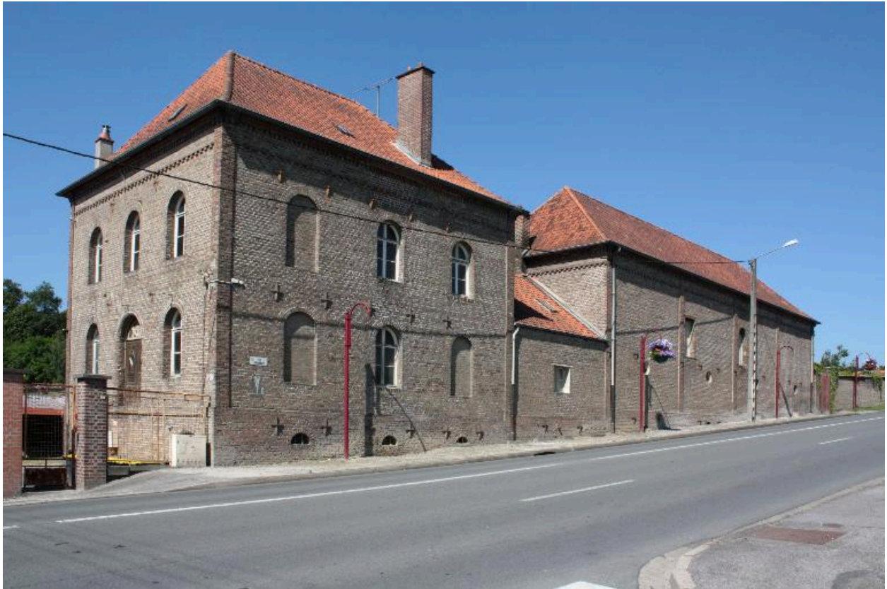
Vue d'ensemble sur rue de la ferme.