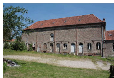
Façade sur cour de la laiterie, vue de face. IVR22_20138016131NUC2A