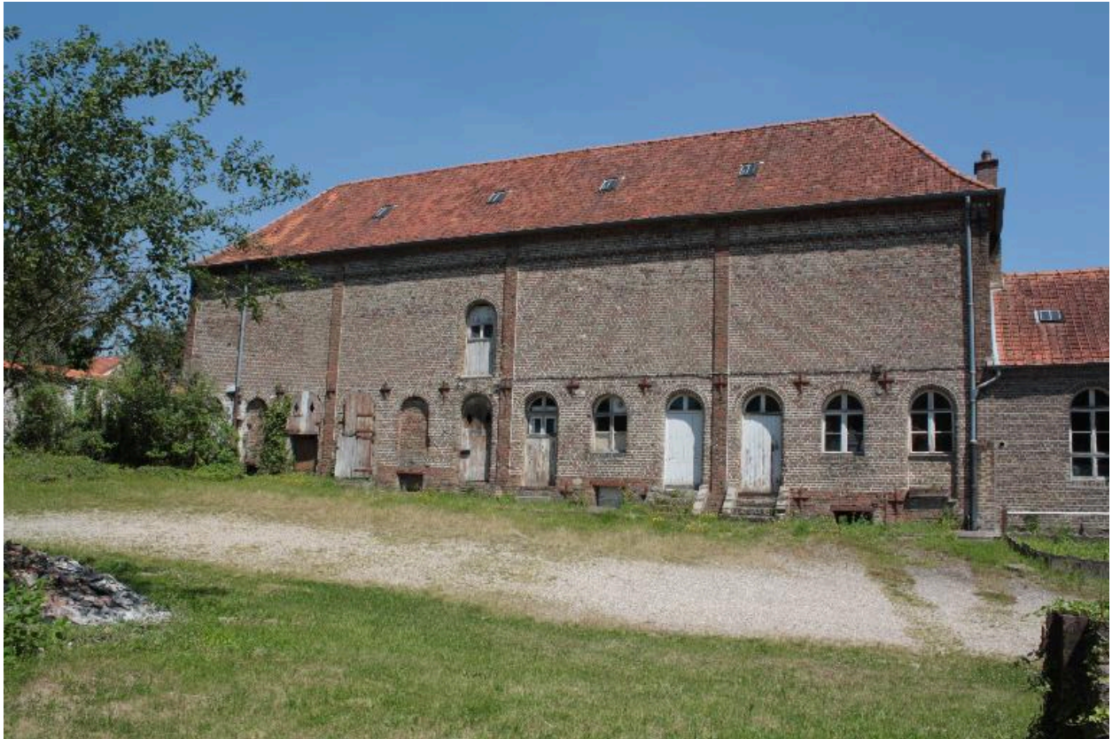
Façade sur cour de la laiterie, vue de face.