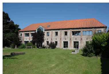
Façade extérieure des anciennes étables à vaches et écuries, converties en restaurant scolaire et salles de classe.