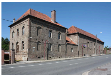
Vue d'ensemble sur rue de la ferme. IVR22_20138016127NUC2A

IVR22_20138016136NUC2A