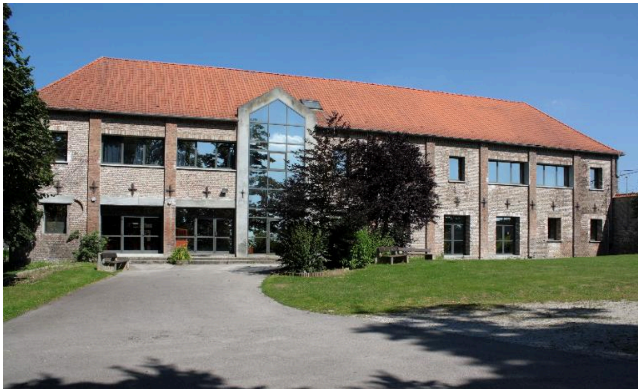
Façade extérieure des anciennes étables à vaches et écuries transformées en restaurant scolaire et salles de classe.