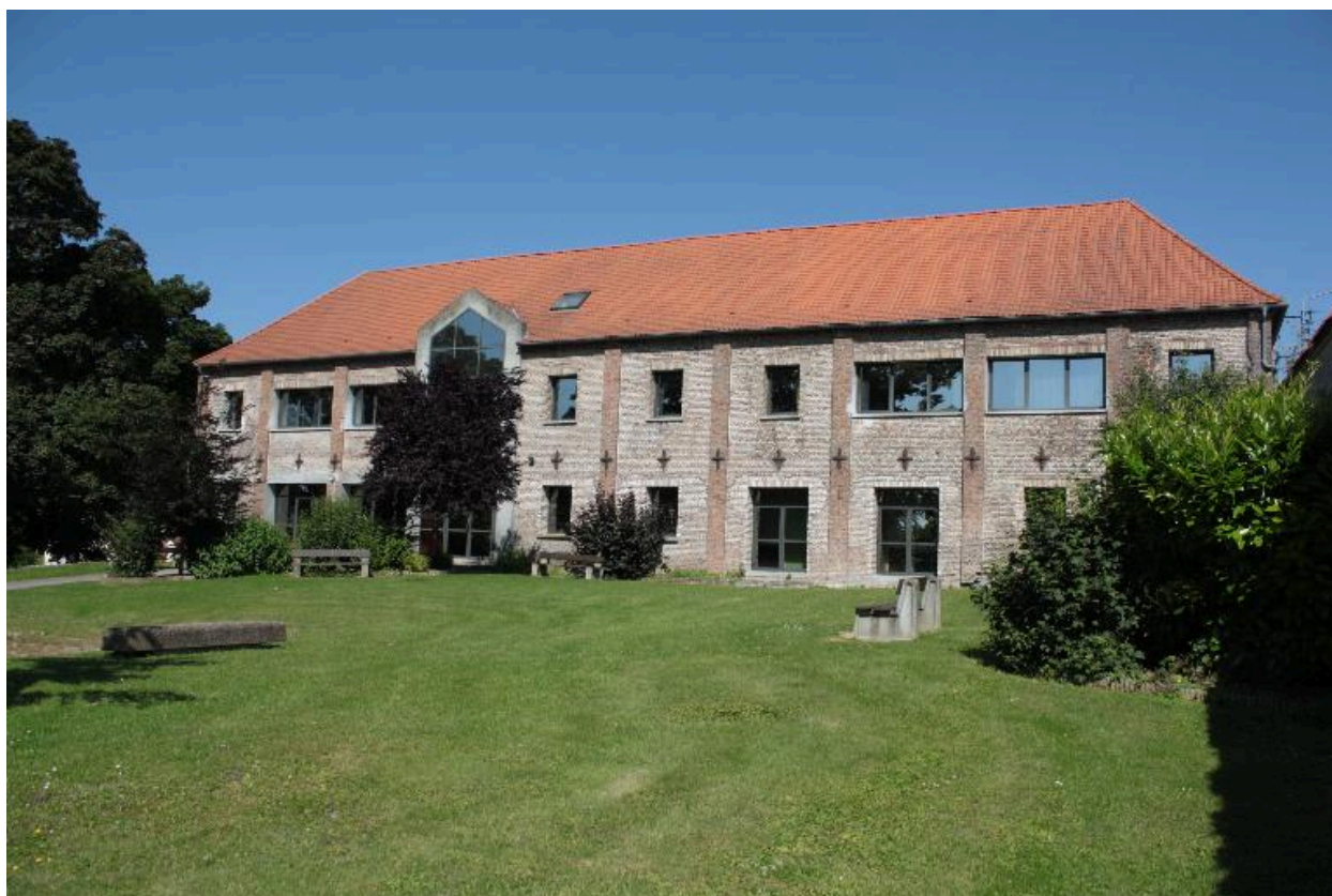
Façade extérieure des anciennes étables à vaches et écuries, converties en restaurant scolaire et salles de classe.