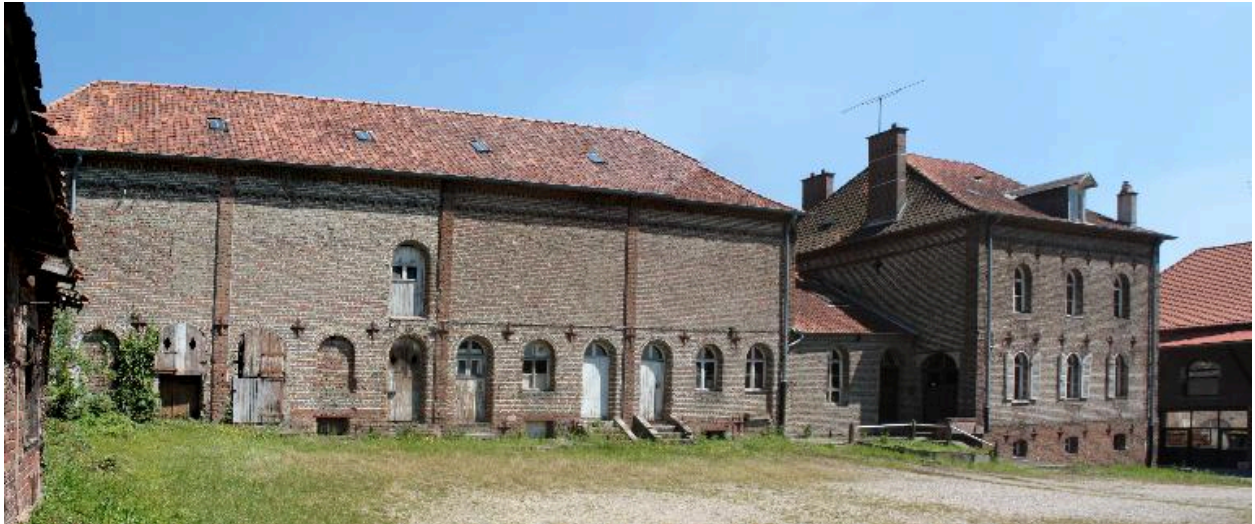
Façade sur cour de la laiterie et du logis.