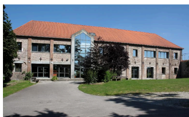
Façade extérieure des anciennes étables à vaches et écuries transformées en restaurant scolaire et salles de classe. IVR22_20138016135NUC2A