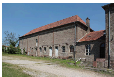
Façade sur cour de la laiterie, vue de trois-quarts. IVR22_20138016130NUC2A