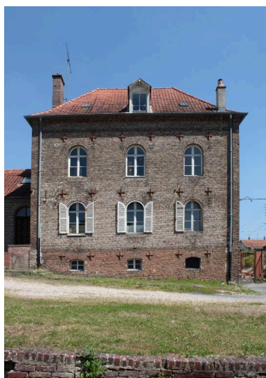
Logis de la ferme, façade sur cour. IVR22_20138016133NUC2A