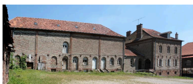
Façade sur cour de la laiterie et du logis. IVR22_20138016129NUC2AQ