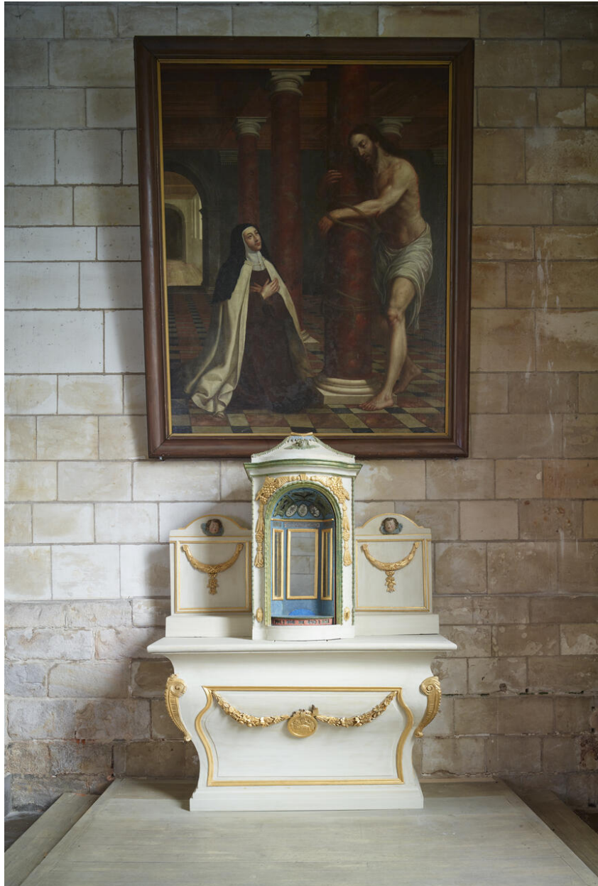
Vue générale, face bleue de l'exposition ornée de miroirs.