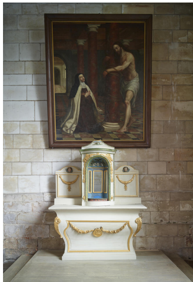
Vue générale, face bleue de l'exposition ornée de miroirs. IVR32_20246200141NUCA