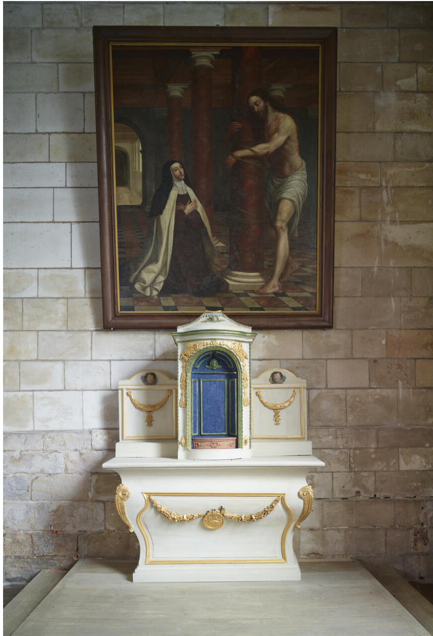
Face bleue de l'exposition, plan rapproché.