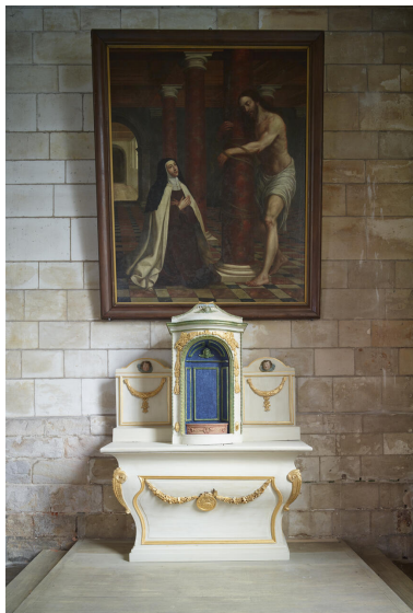
Face bleue de l'exposition, plan rapproché.