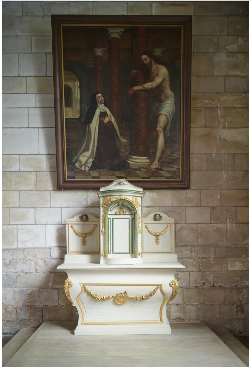
Vue générale, face blanche de l'exposition.