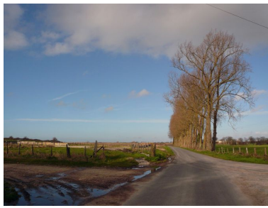
Vue depuis Mayoc sur la route menant au Bihen.