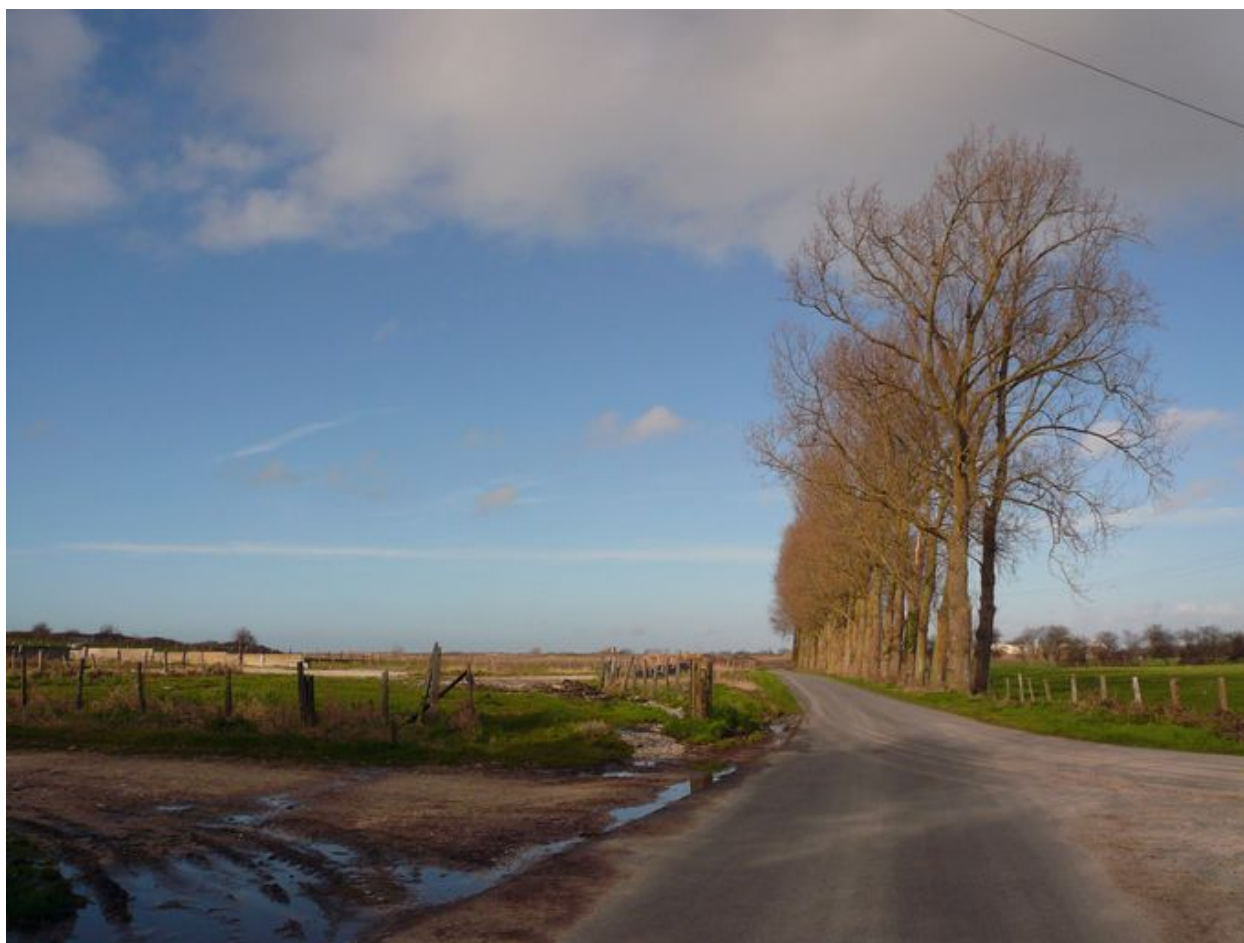
Vue depuis Mayoc sur la route menant au Bihen.