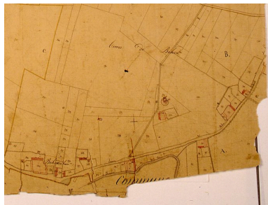
Extrait du cadastre napoléonien présentant le hameau en 1828. IVR22_20078005446XAB