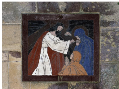
Vue de la quatrième station.