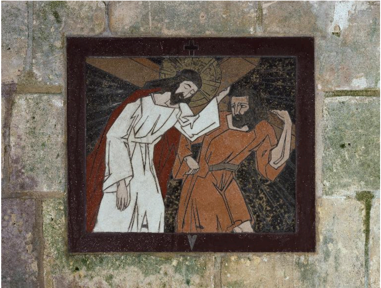
Vue de la cinquième station.