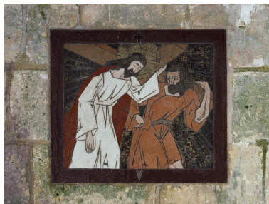
Vue de la cinquième station.