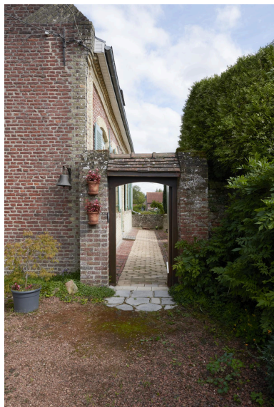
Passage vers le logis. IVR32_20245903063NUCA