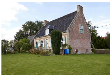
Vue de la façade sud et du pignon est.