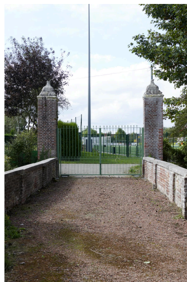
Détail des pilastres situées à l'entrée de la propriété (côté ouest). IVR32_20245903064NUCA