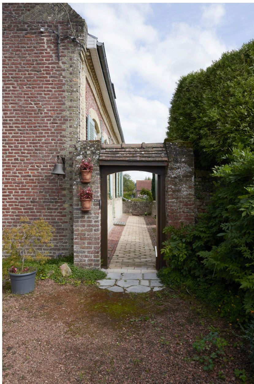
Passage vers le logis.