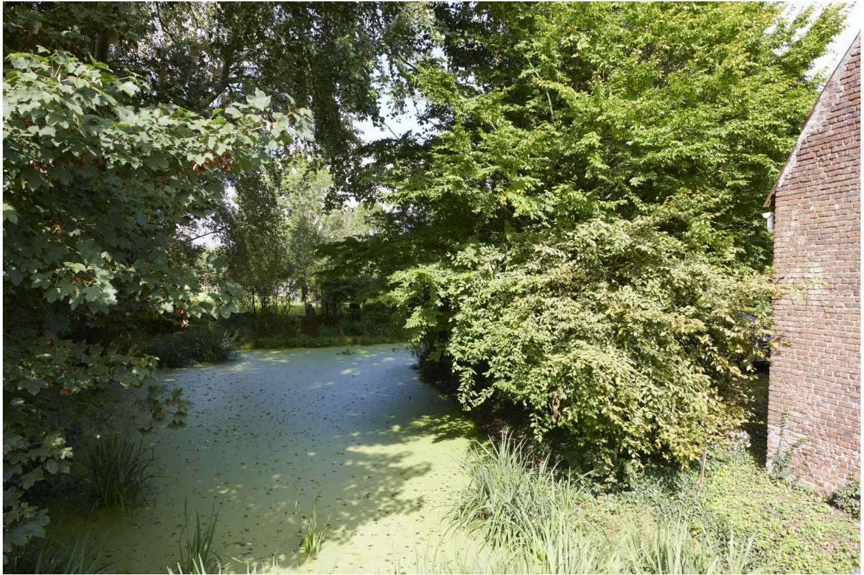
Vestige de l'ancien fossé bordier en eau.