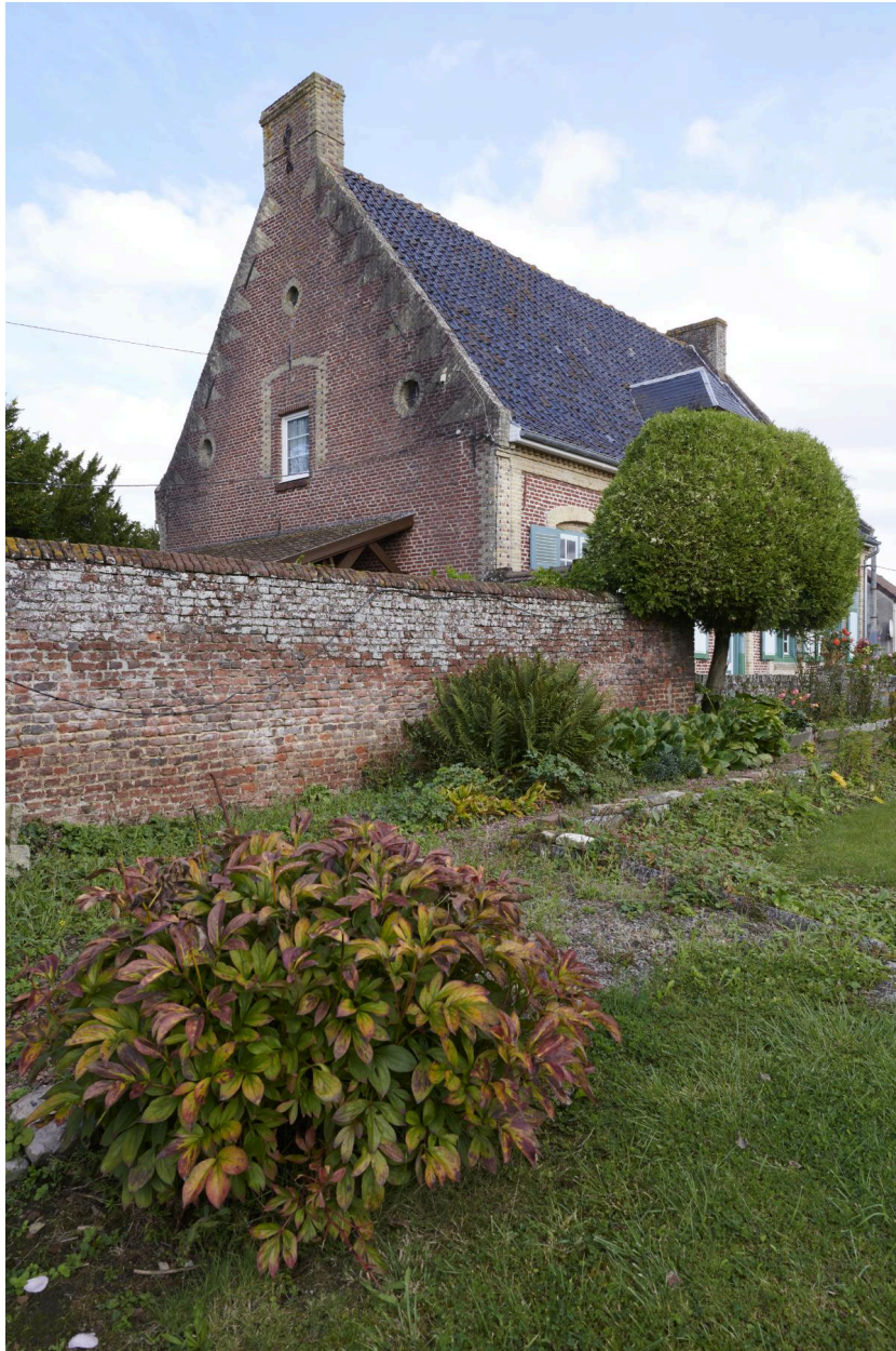
Détail du pignon ouest.