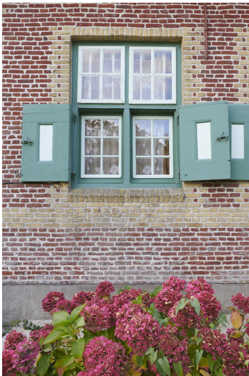
Détail d'une fenêtre.