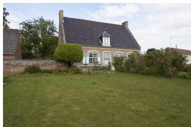
Vue de la façade sud. IVR32_20245903056NUCA