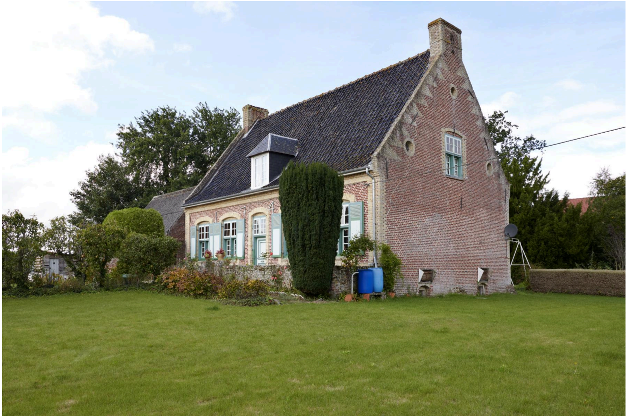
Vue de la façade sud et du pignon est.