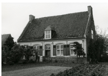
Vue générale datée de 1976.