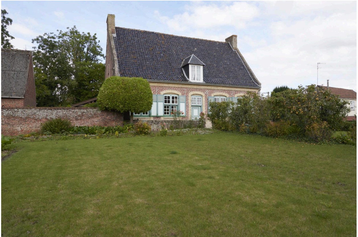
Vue de la façade sud.