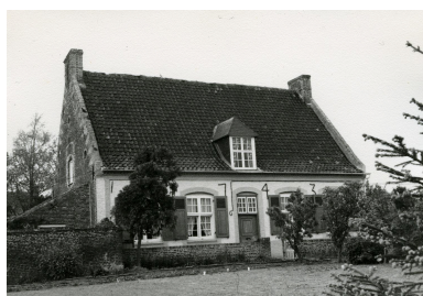
Prise de vue datée de 1976.