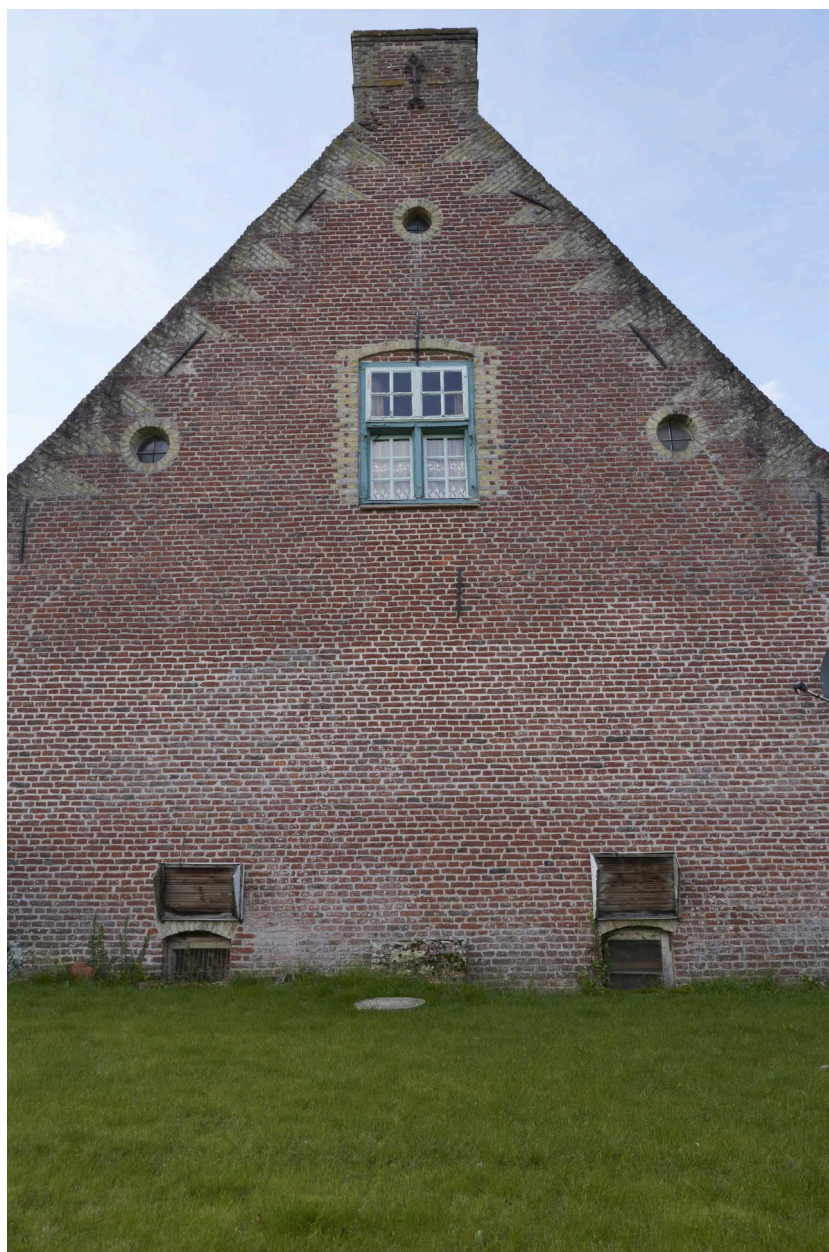
Détail du pignon est.