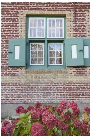
Détail d'une fenêtre.