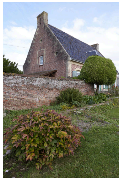
Détail du pignon ouest. IVR32_20245903057NUCA