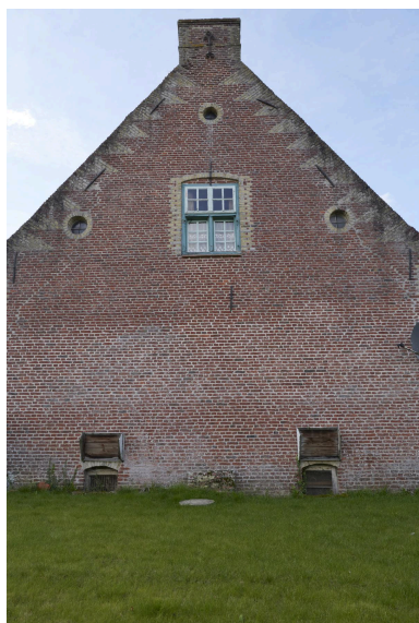
Détail du pignon est.