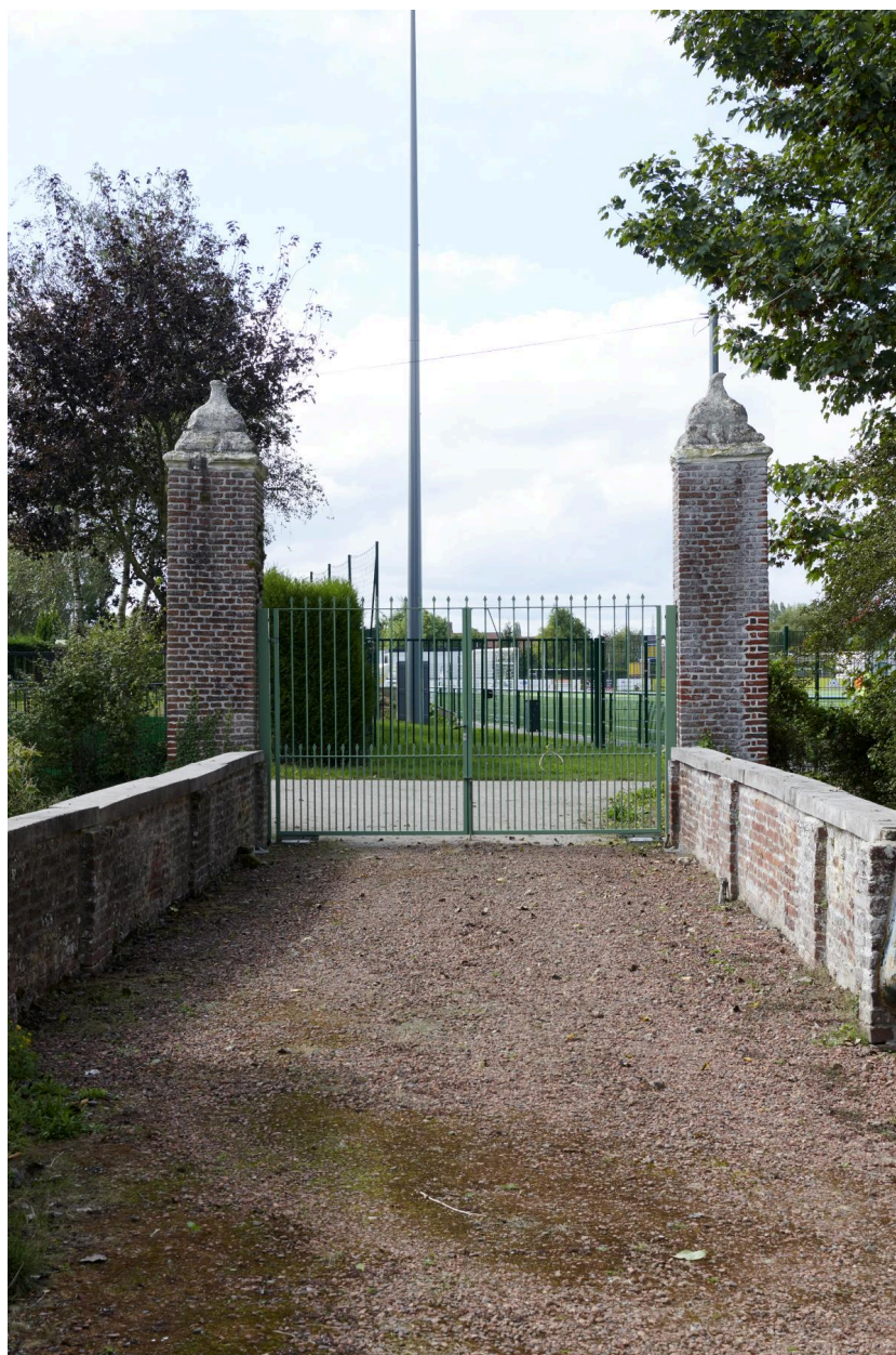
Détail des pilastres situées à l'entrée de la propriété (côté ouest).