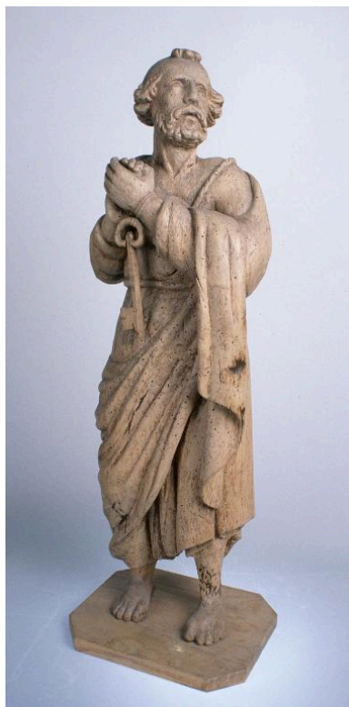
Vue d'ensemble. IVR22_19966000762ZA