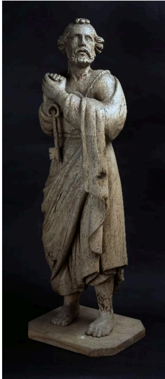
Vue de trois-quarts face.