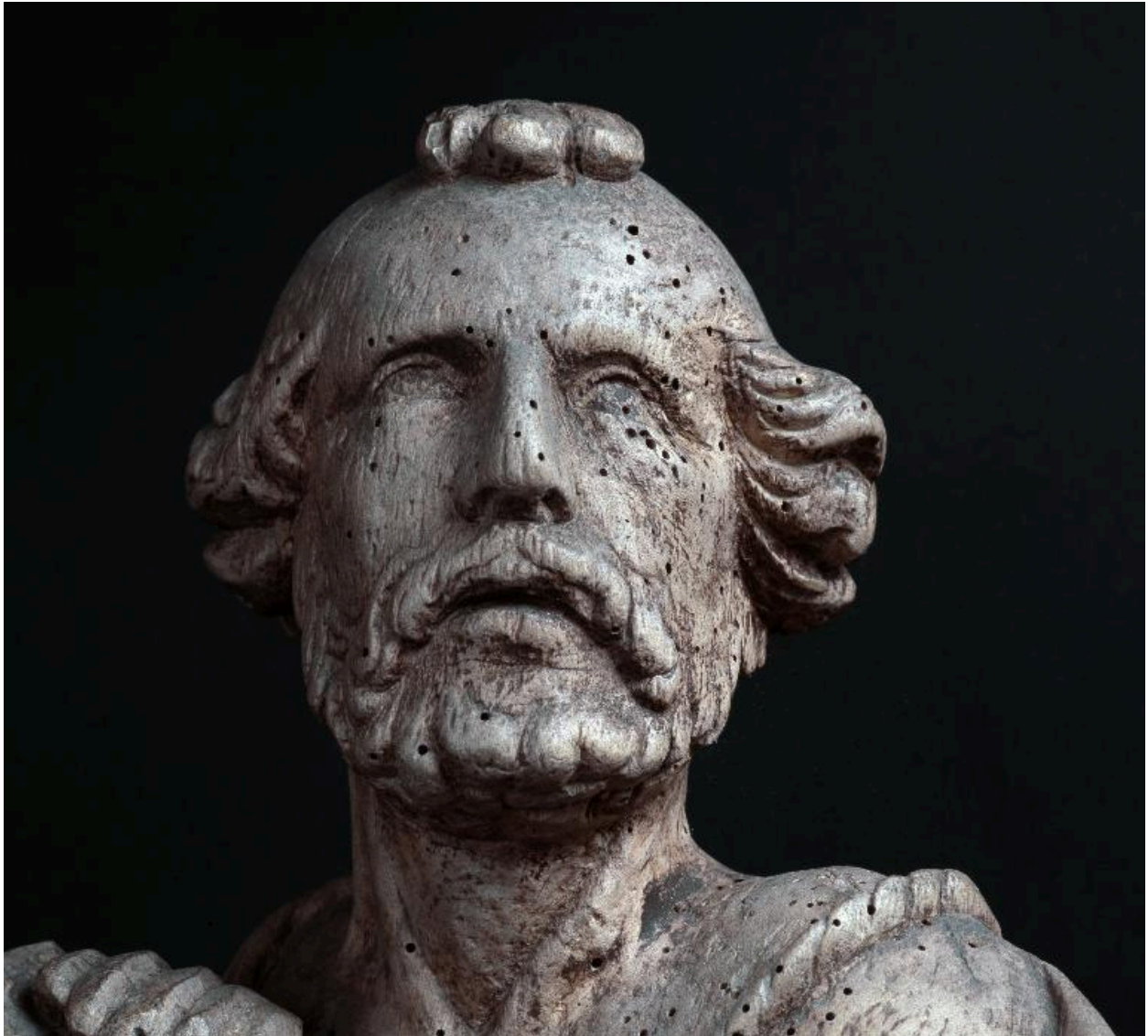
Détail du visage du saint.