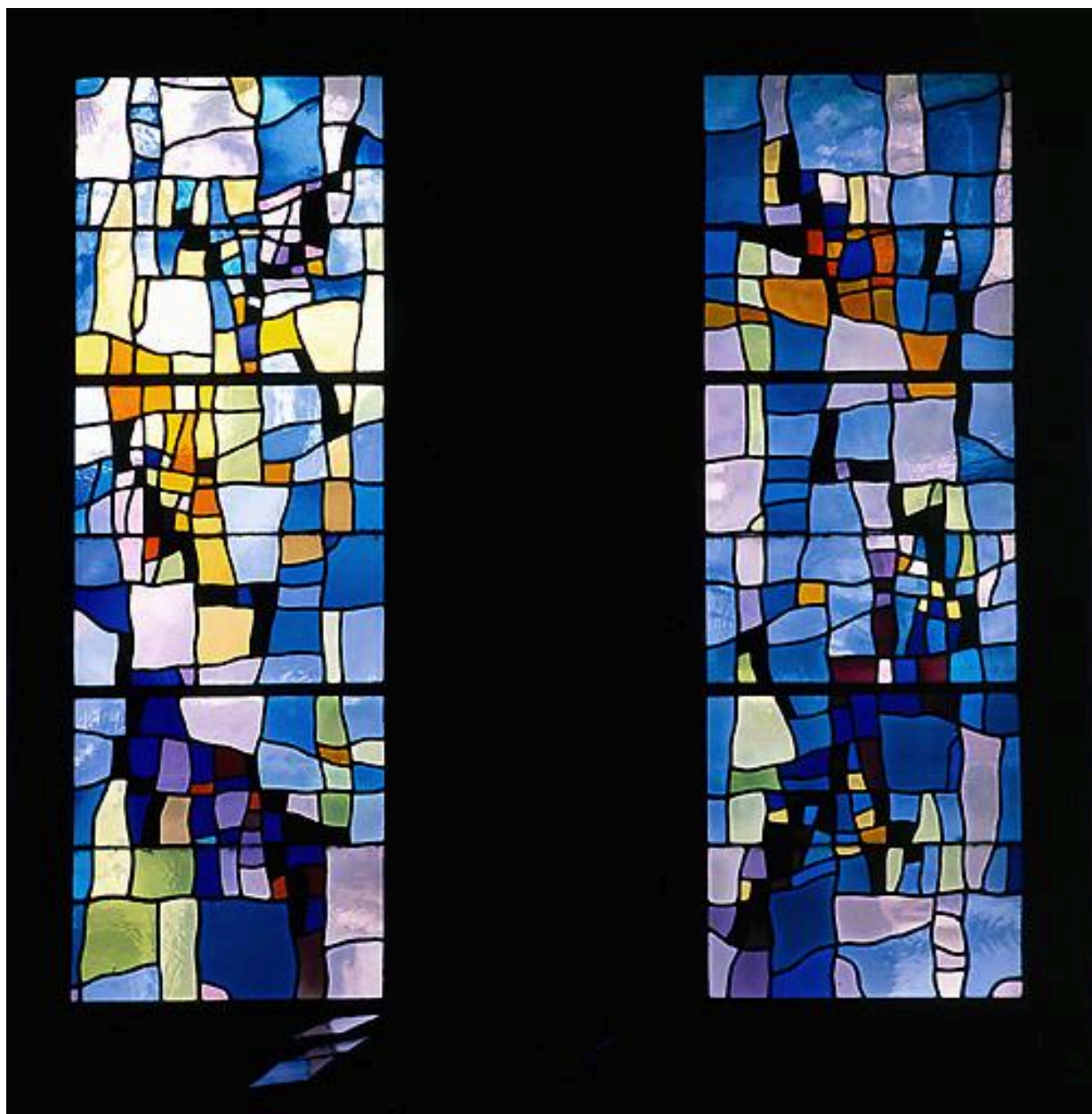
Motif 1 (b 10), motif 2 (b 12), vue d'ensemble.