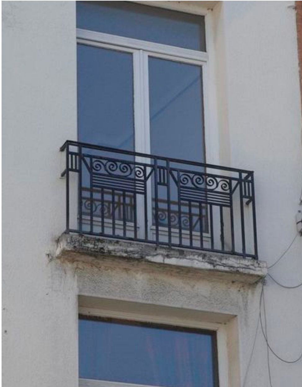
Ferronnerie Art déco.