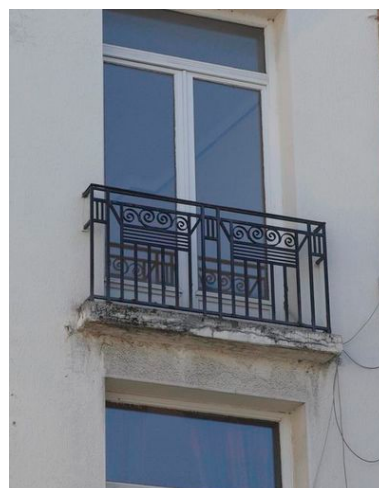
Ferronnerie Art déco. IVR31_20096200275NUCA