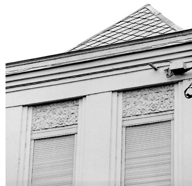
Façade sur la place, aile droite, détail : étage carré avec le décor moulé des pleins-de-travées supérieurs.