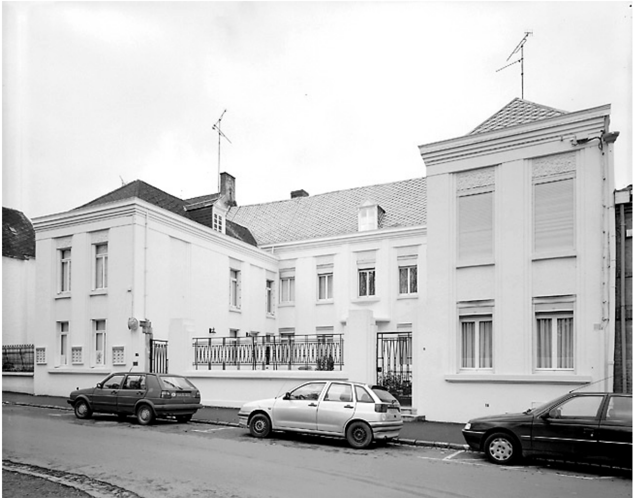
Vue générale (état en 2000).