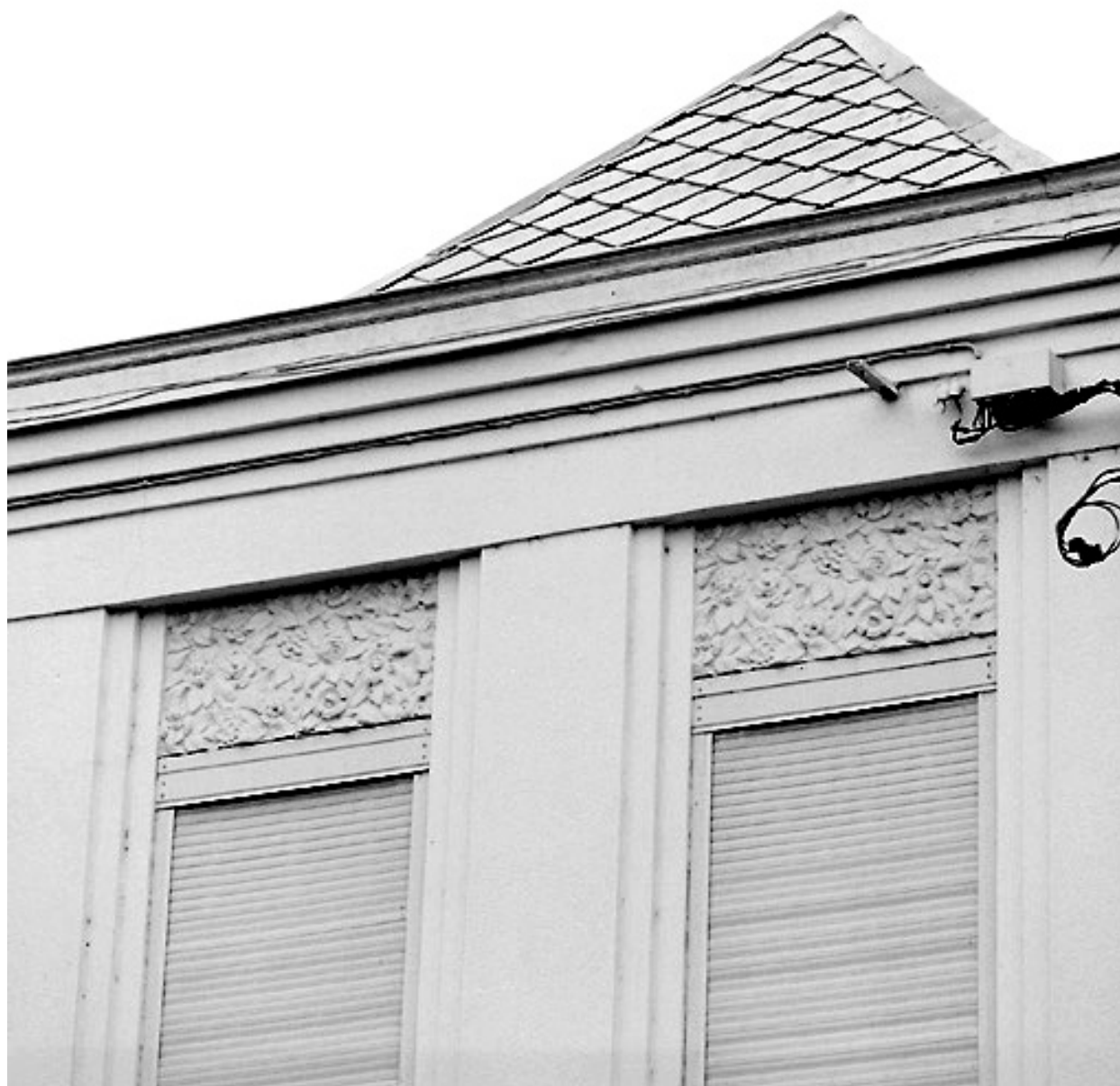
Façade sur la place, aile droite, détail : étage carré avec le décor moulé des pleins-de-travées supérieurs.