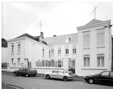
Vue générale (état en 2000). IVR31_20005902409V