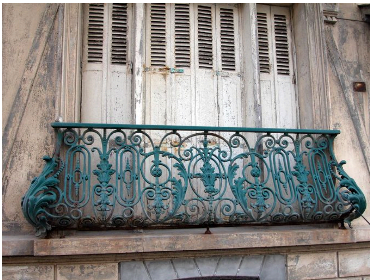
Détail du décor de fonte du garde-corps de balconnet de l'habitation sans appellation (partie droite de la maison).