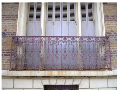
Détail du décor de fonte du garde-corps de balconnet de l'habitation dite Heures Claires (partie gauche de la maison). IVR22_20058002538NUCA