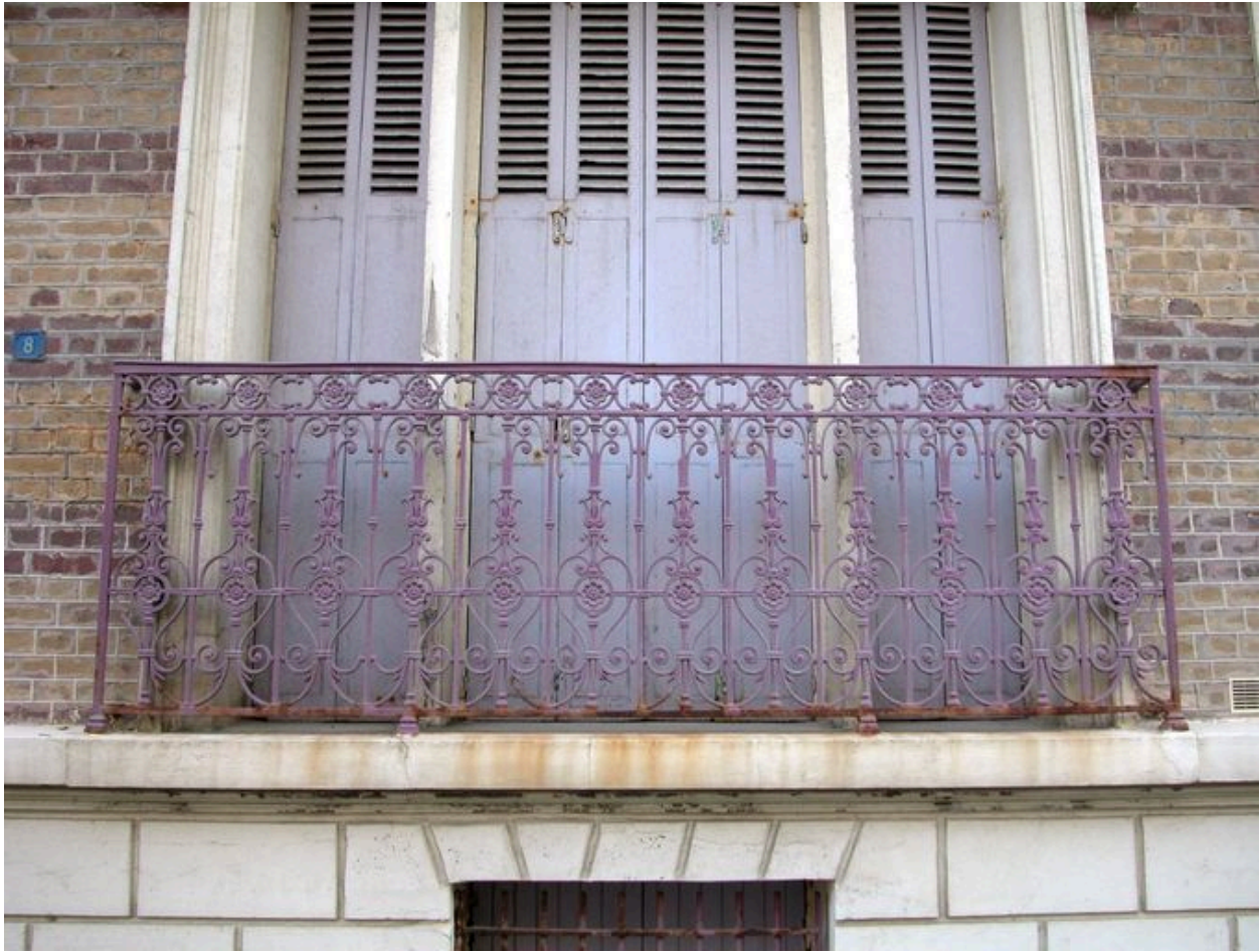
Détail du décor de fonte du garde-corps de balconnet de l'habitation dite Heures Claires (partie gauche de la maison).