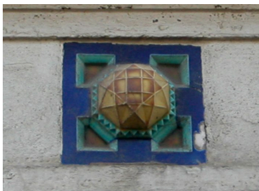
Détail du cabochon de céramique situé sur le linteau de l'entrée, logement dit Heures Claires.