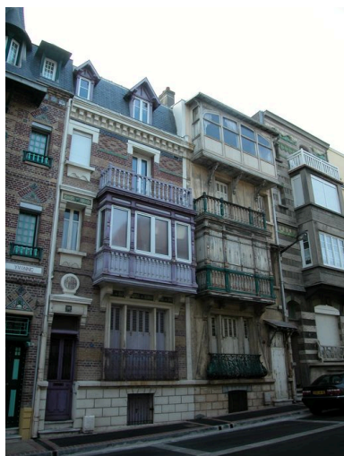
Vue d'ensemble.