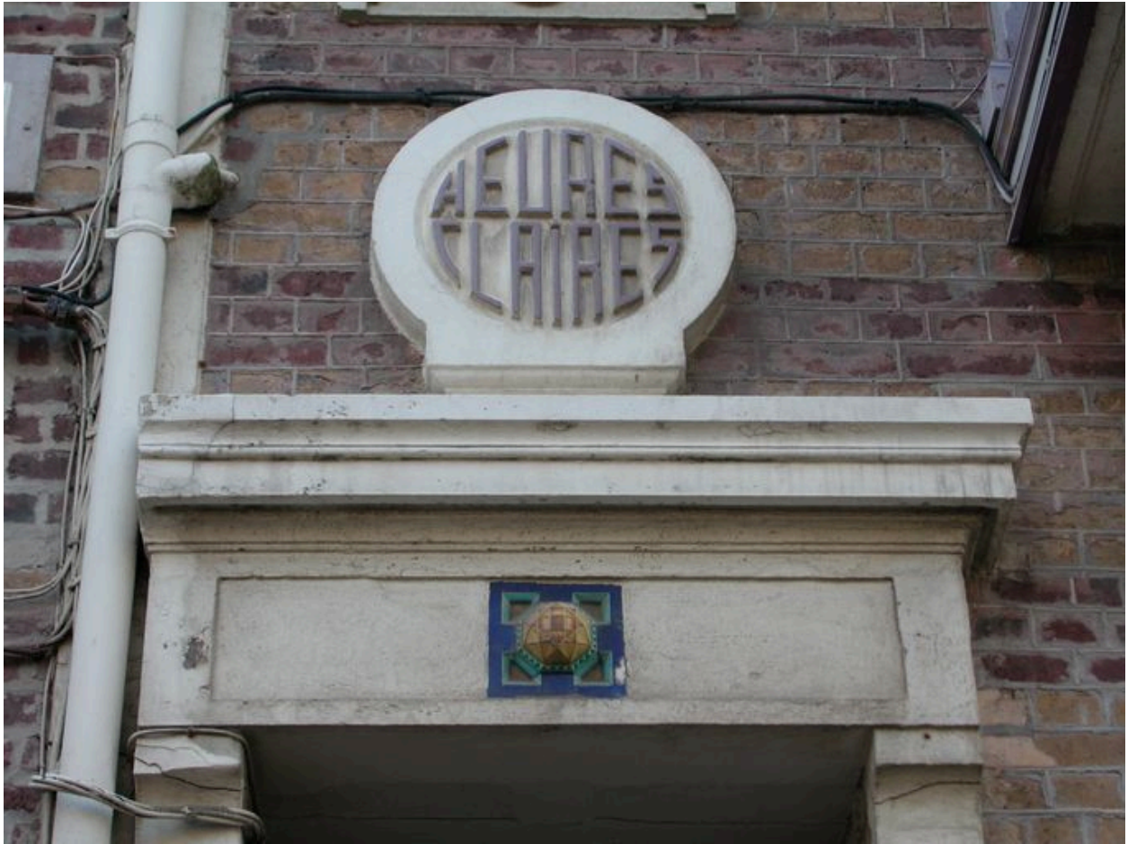
Détail de l'entrée du logement de gauche, Heures Claires.