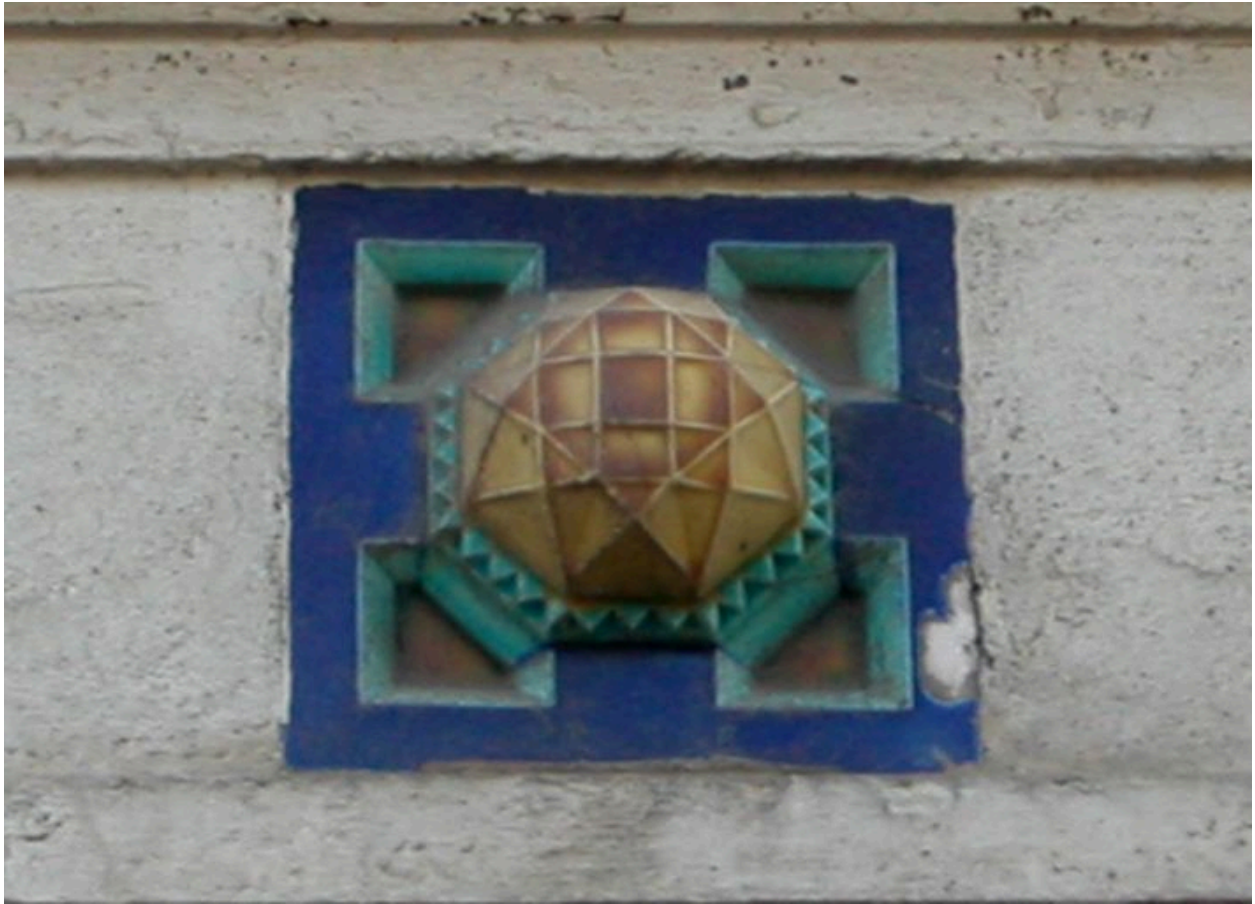
Détail du cabochon de céramique situé sur le linteau de l'entrée, logement dit Heures Claires.