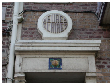
Détail de l'entrée du logement de gauche, Heures Claires.