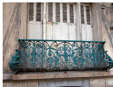
Détail du décor de fonte du garde-corps de balconnet de l'habitation sans appellation (partie droite de la maison).