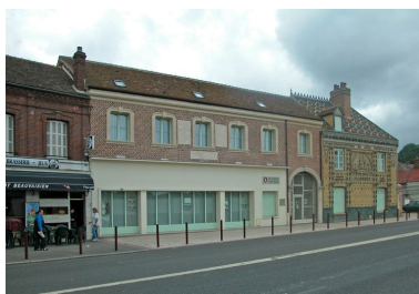
Vue d'ensemble sur rue.

Plan de la manufacture Gréber établi à partir des fouilles effectuées (Service archéologique de Beauvais). Dess. J.-M. Fémolant IVR22_20076000324NUDA