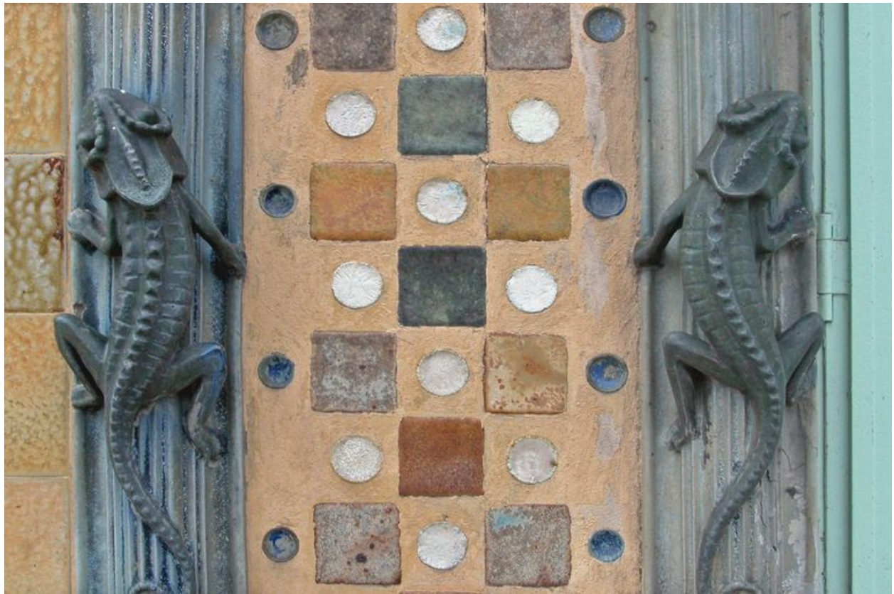
Détail des salamandres ornant la façade sur rue.