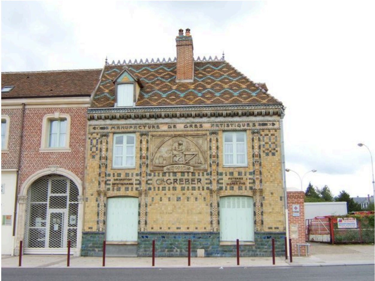
Façade sur rue de la Manufacture Gréber.