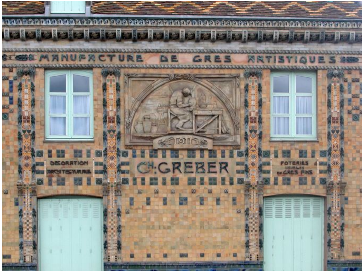
Détail de la partie centrale de la façade sur rue.