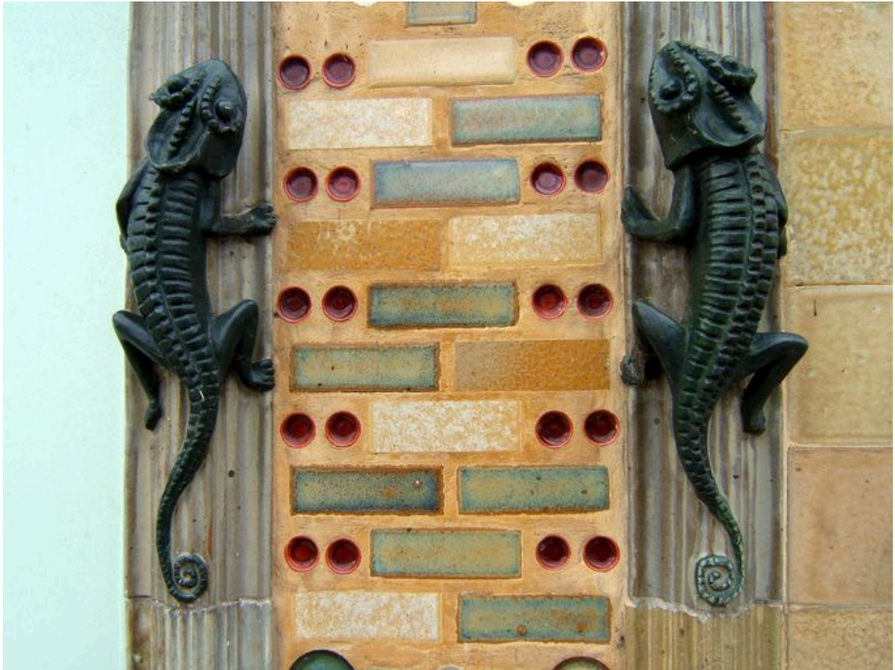
Détails des salamandres ornant la façade sur rue.