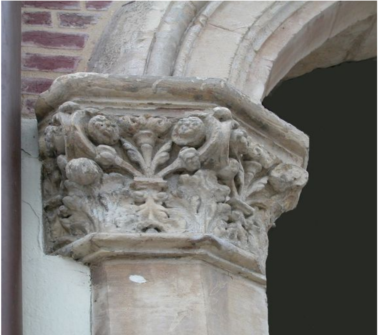
Détail du chapiteau du portail d'entrée sur rue.