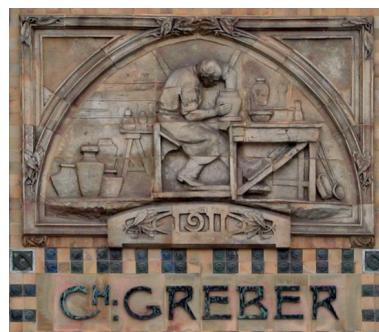
Panneau de grès cérame ornant le centre de la façade sud de la Manufacture Gréber. IVR22_20066090075NUCA

Façade sur rue de la Manufacture Gréber. IVR22_20066090073NUCA