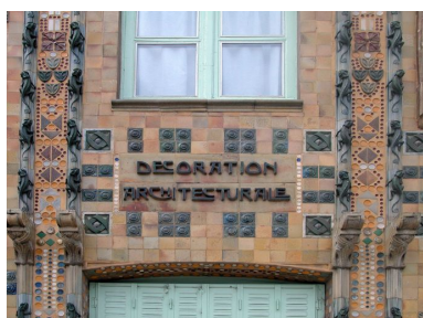
Détail de l'inscription Décoration architecturale. IVR22_20076000176NUCA