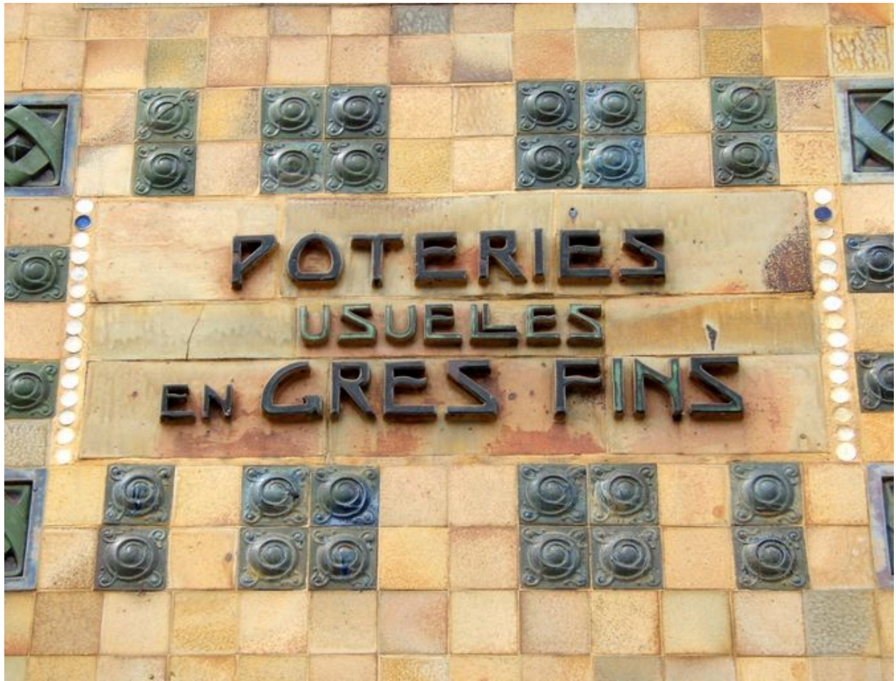
Détails de la façade de la Manufacture Gréber.