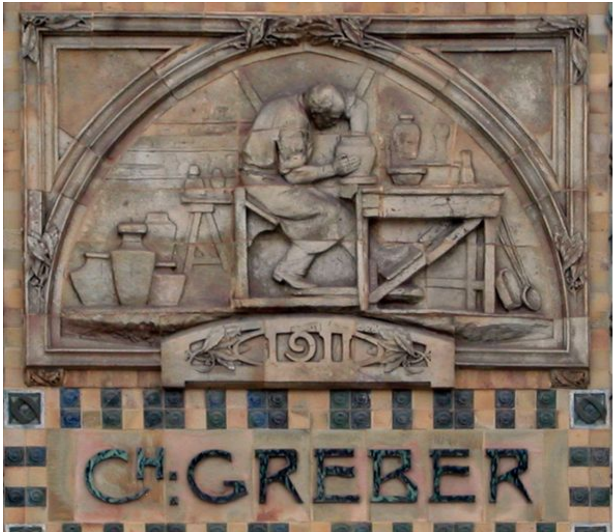
Panneau de grès cérame ornant le centre de la façade sud de la Manufacture Gréber.