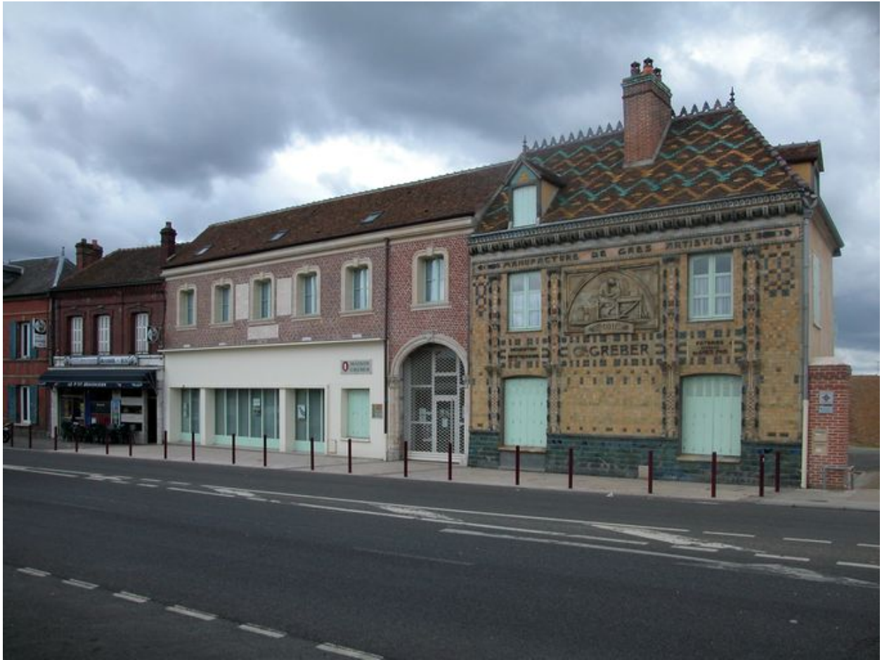
Vue latérale de la Manufacture Gréber.