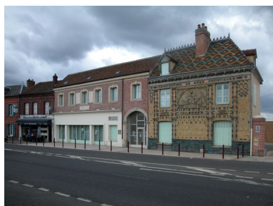
Vue latérale de la Manufacture Gréber. IVR22_20066090074NUCA

IVR22_20076000178NUCA