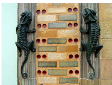
Détails des salamandres ornant la façade sur rue.