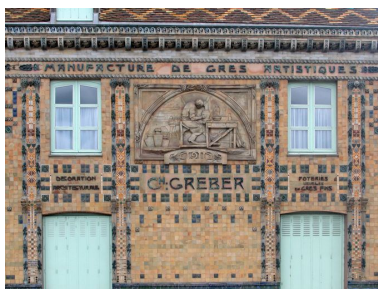
Détail de la partie centrale de la façade sur rue.

Façade sur rue de la Manufacture Gréber.