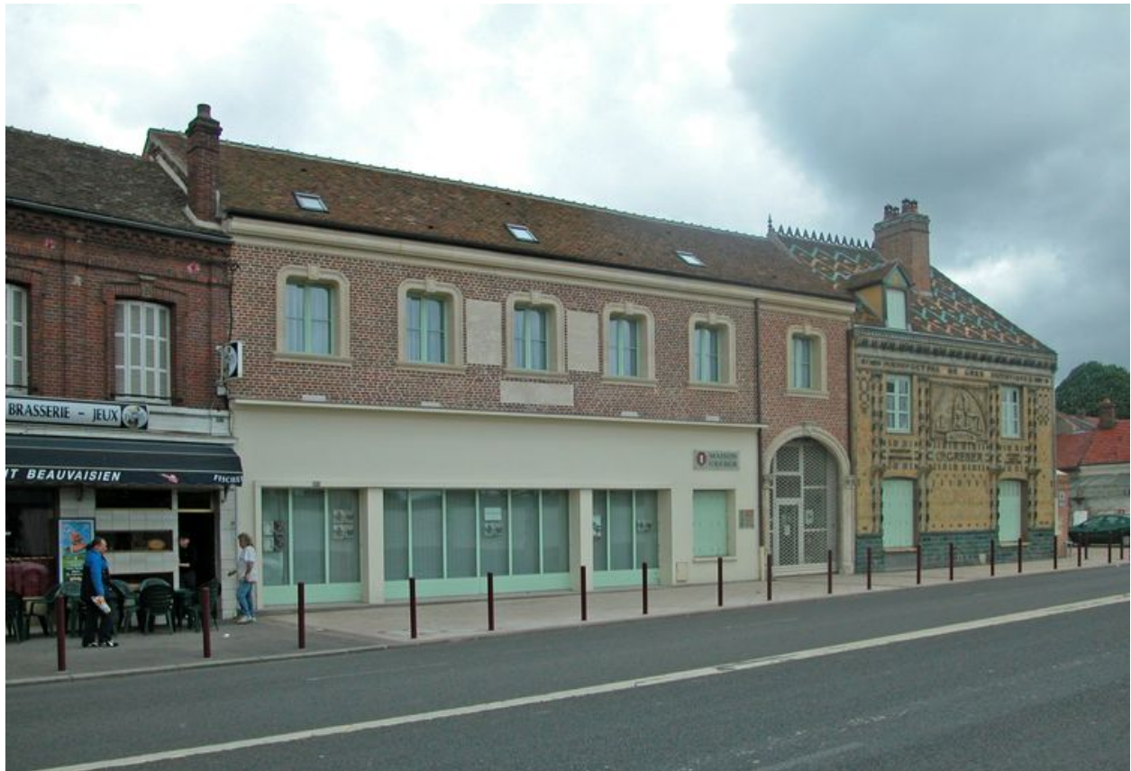
Vue d'ensemble sur rue.