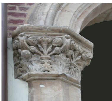
Détail du chapiteau du portail d'entrée sur rue. IVR22_20076000179NUCA