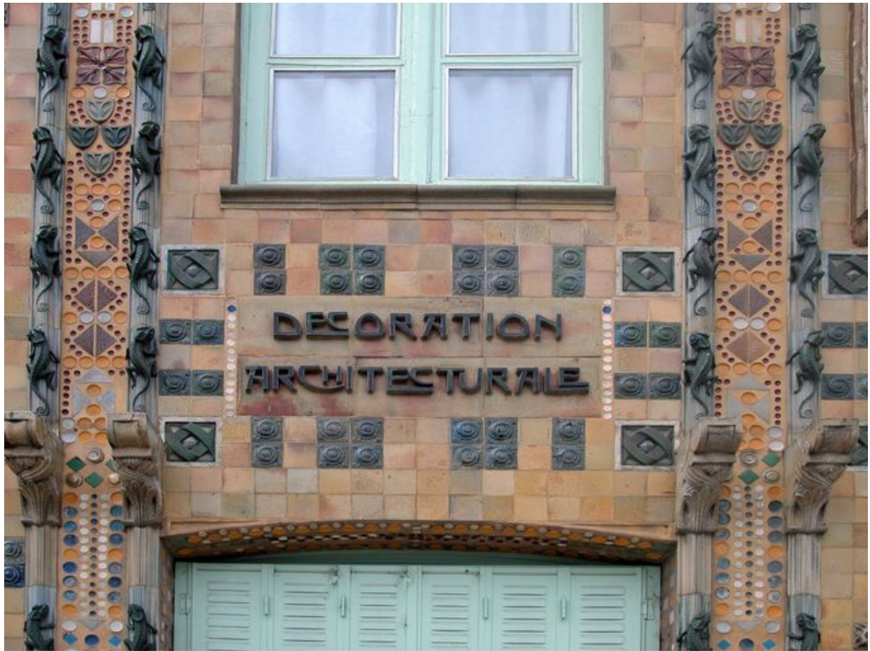
Détail de l'inscription Décoration architecturale.