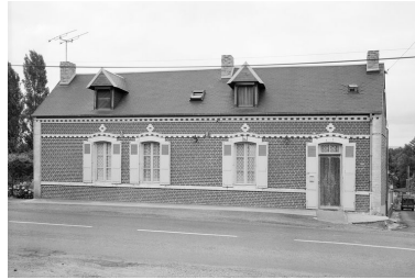
Vue générale. IVR22_19856001002X

Plan de situation. Extrait du plan cadastral de 1982, section AC 106. IVR22_20096000130NUC2A