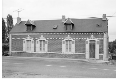
Vue générale. IVR22_19856001002X

Plan de situation. Extrait du plan cadastral de 1982, section AC 106. IVR22_20096000130NUCA