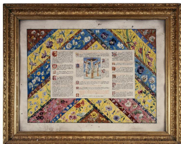
Vue du canon central. IVR22_19966003609XA