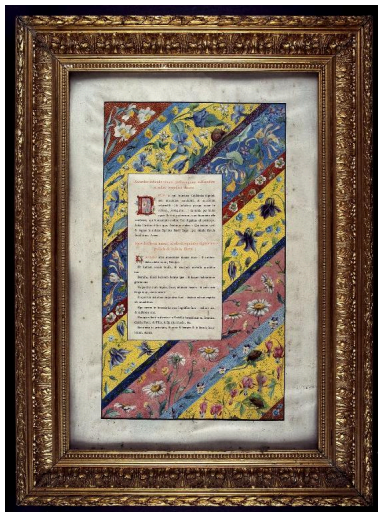
Vue du canon du Lavabo.