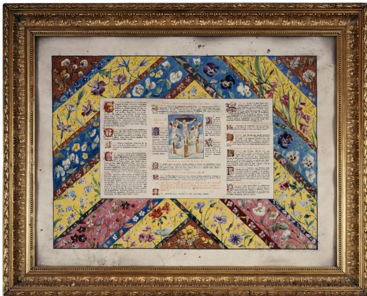
Vue du canon central.