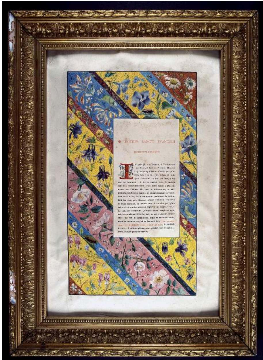
Vue du canon du Dernier Évangile.