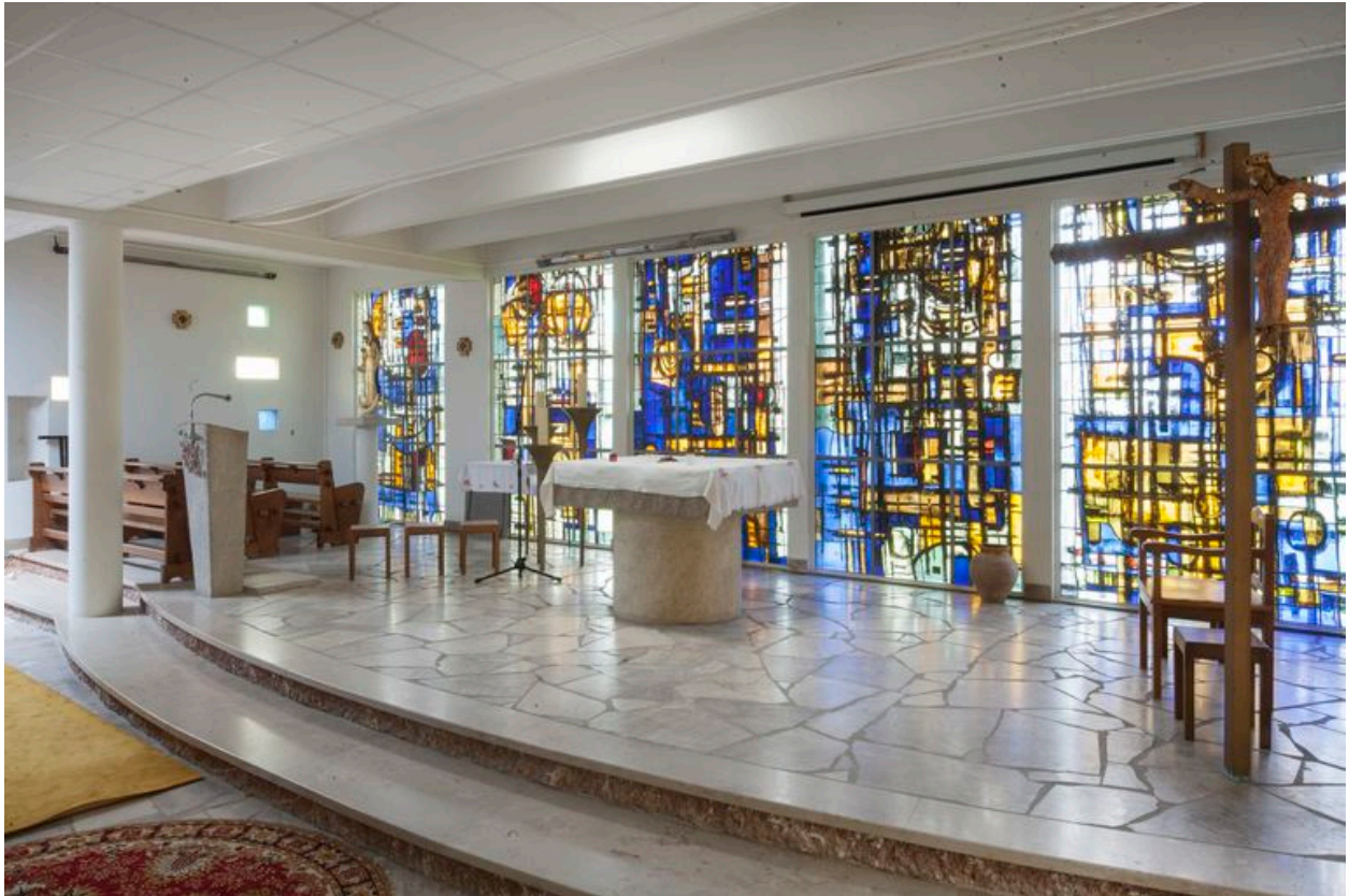
Vue générale intérieure.