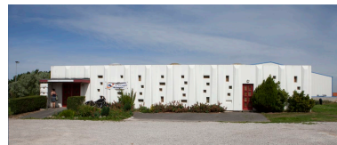
Vue extérieure. IVR31_20156200154NUCA