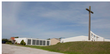
Vue générale extérieure.