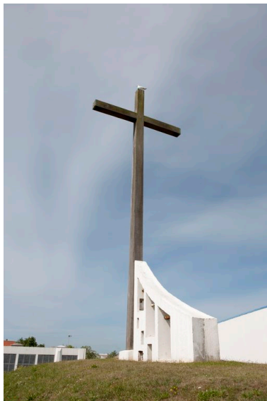
Détail du campanile. IVR31_20156200152NUCA