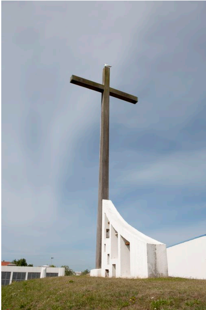
Détail du campanile.