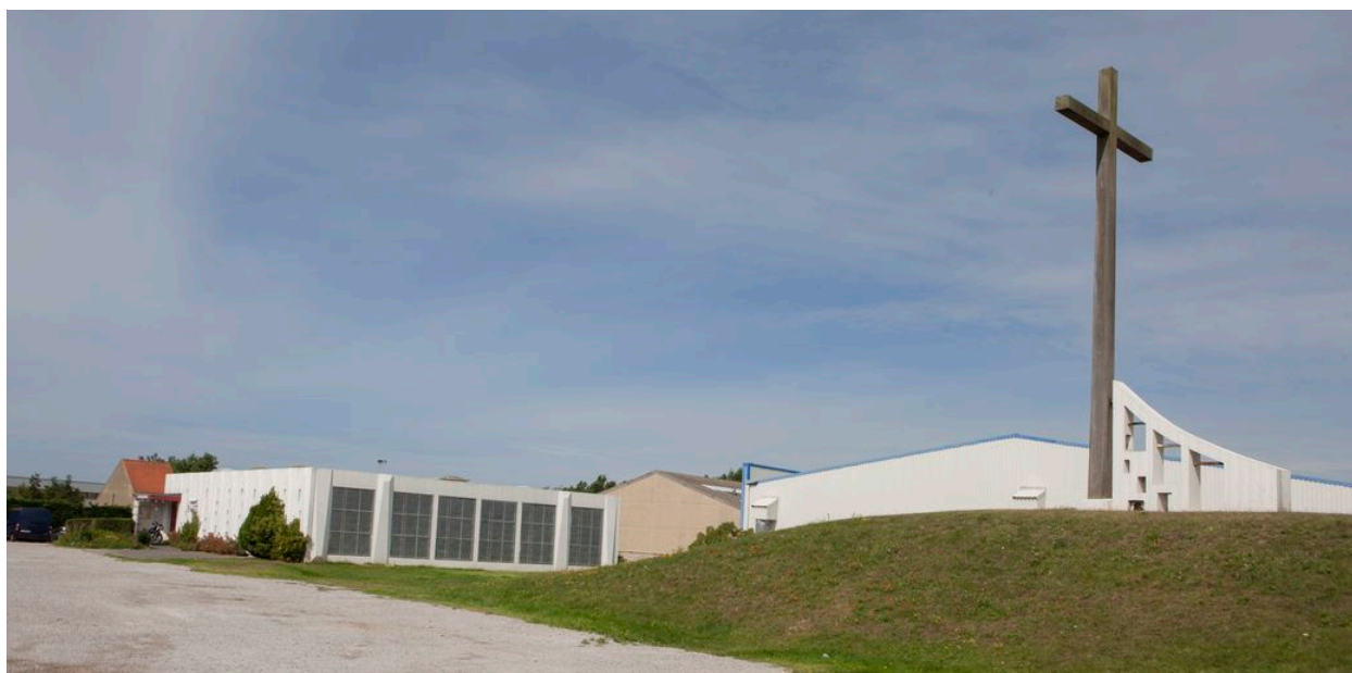
Vue générale extérieure.