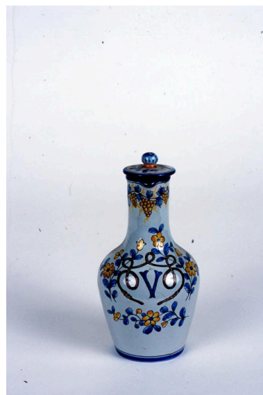
Vue générale d'une des 5 bouteilles de pharmacie, cet exemplaire étant orné du monogramme V.