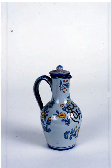
Vue générale d'une des 5 bouteilles de pharmacie, cet exemplaire étant orné du monogramme H.