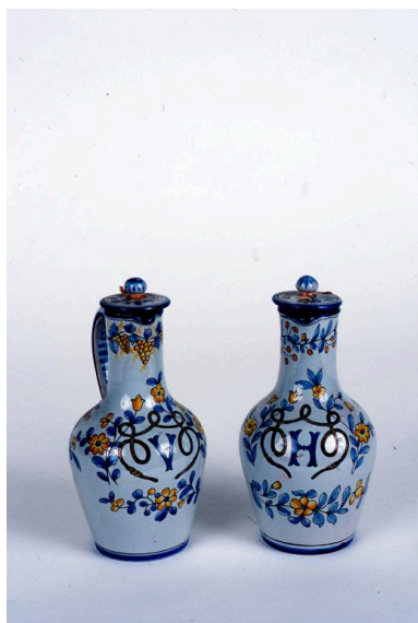
Vue d'ensemble de 2 des 5 bouteilles de pharmacie, ces exemplaires étant respectivement ornés des monogrammes H et V.