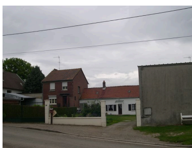
Maisons, 10 rue du Petit-Cagny.