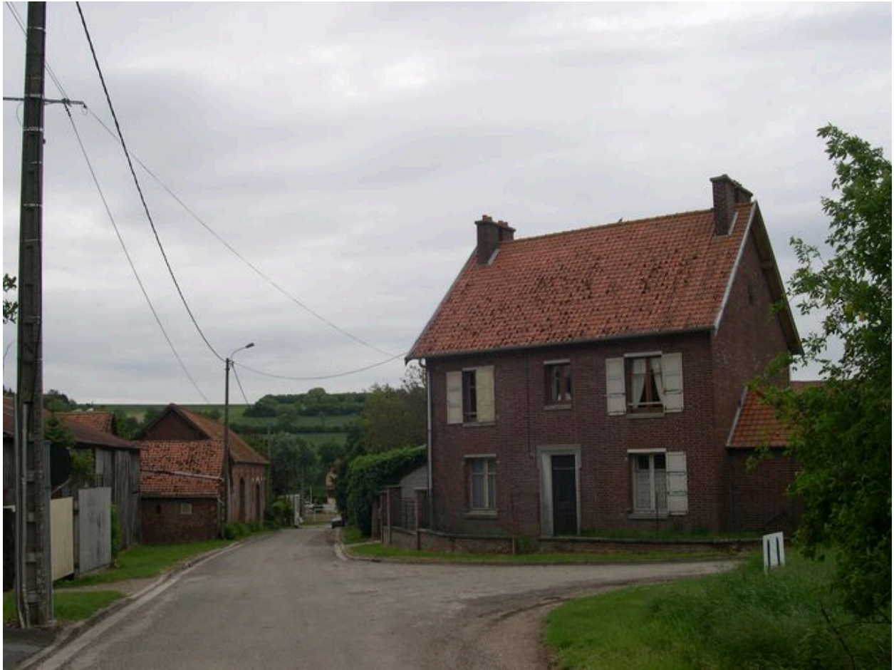
Vue depuis le haut du village.