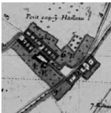
Plan géométrique de Saint-Fuscien, 1805 (AD Somme). IVR22_20048010380NUCA