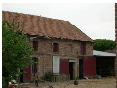
Dépendances agricoles de la ferme, 19 rue du Petit-Cagny. IVR22_20038010402NUCA