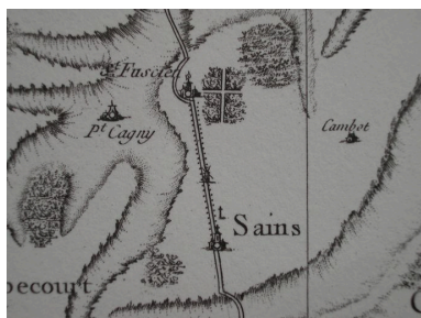
Le Petit-Cagny sur la carte de Cassini (1760-1789). IVR22_20038010303NUCA