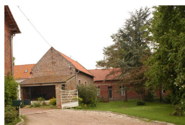
Maison, 14 rue du Petit-Cagny, construite en 1874.