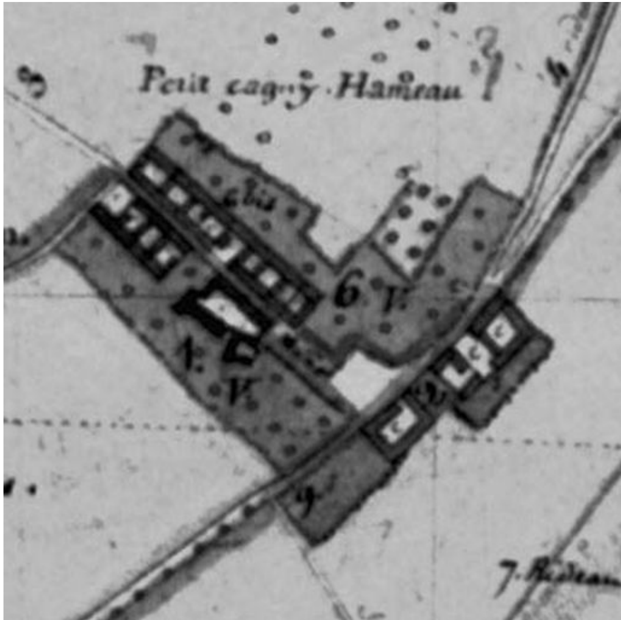
Plan géométrique de Saint-Fuscien, 1805 (AD Somme).