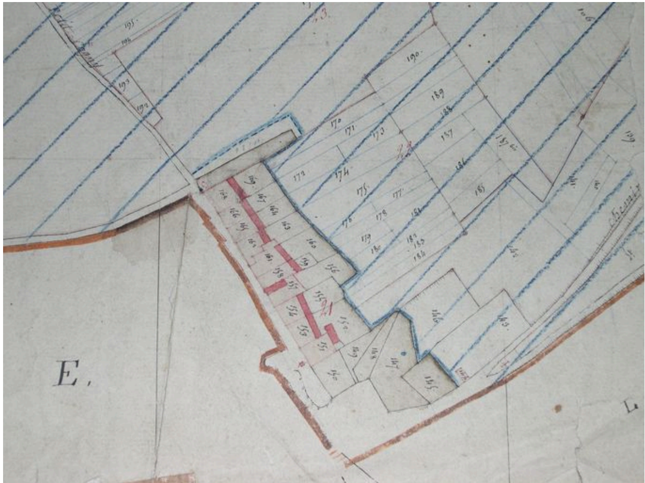
Extrait du cadastre de 1810 (section F).