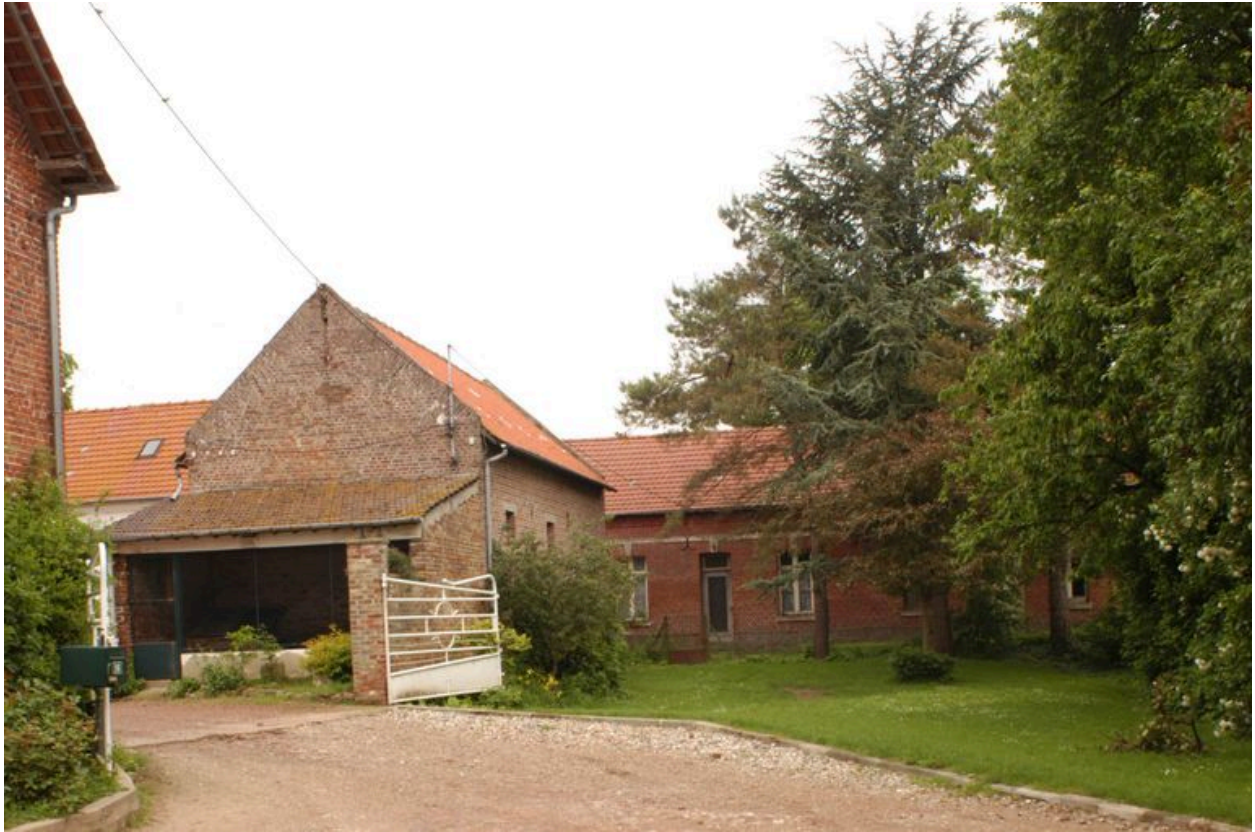
Maison, 14 rue du Petit-Cagny, construite en 1874.