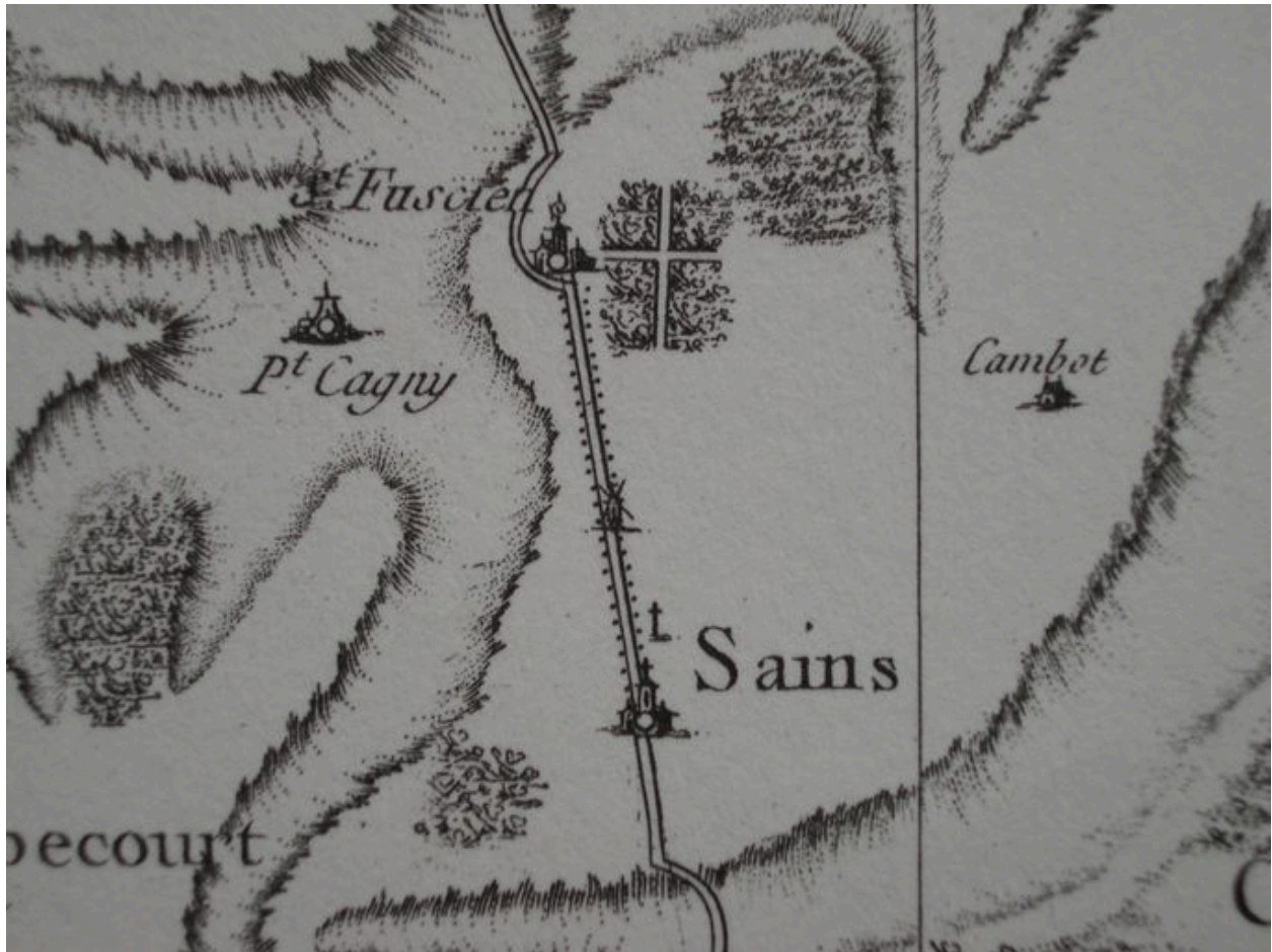
Le Petit-Cagny sur la carte de Cassini (1760-1789).