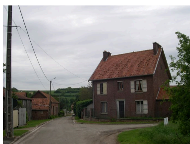
Vue depuis le haut du village. IVR22_20038010401NUCA