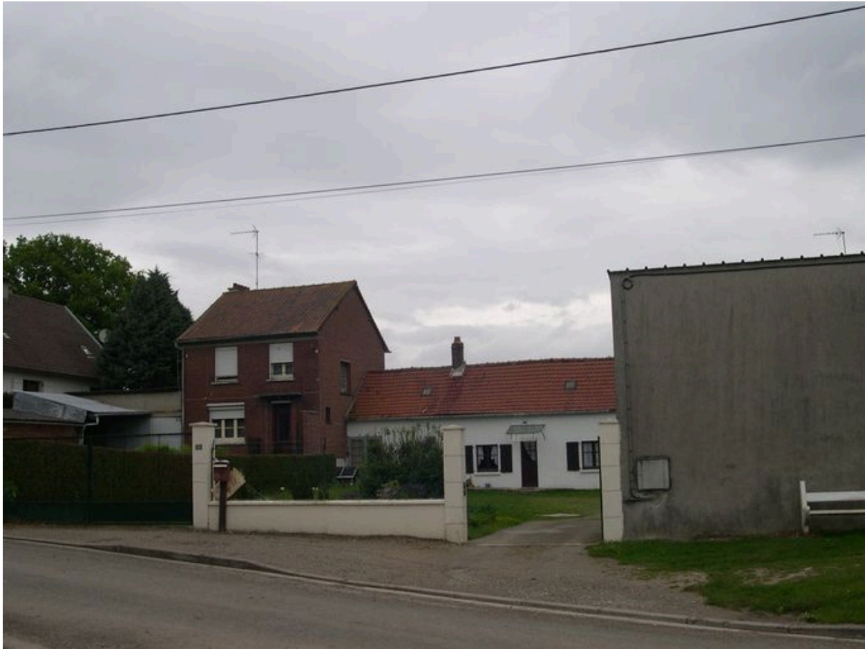
Maisons, 10 rue du Petit-Cagny.