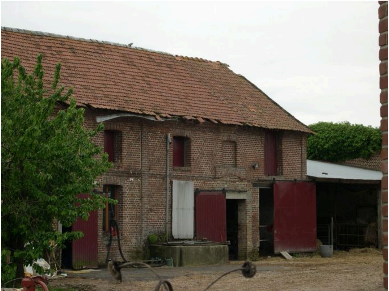
Dépendances agricoles de la ferme, 19 rue du Petit-Cagny.