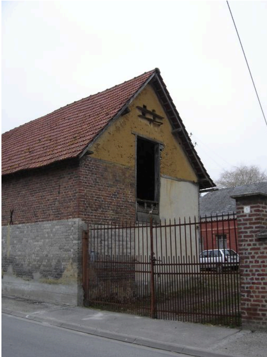
Vue partielle de la grange sur rue.