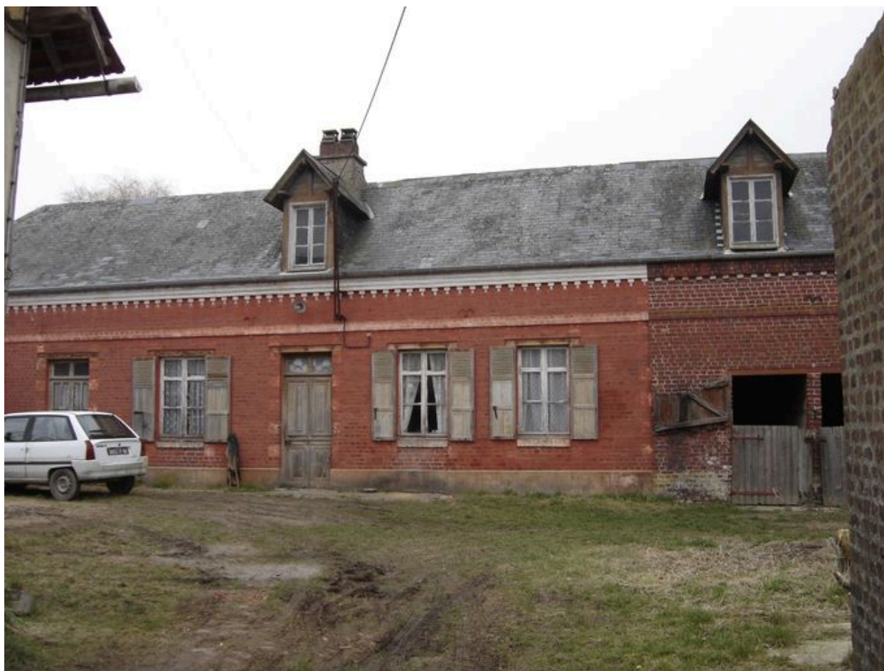
Vue du logis depuis la cour.