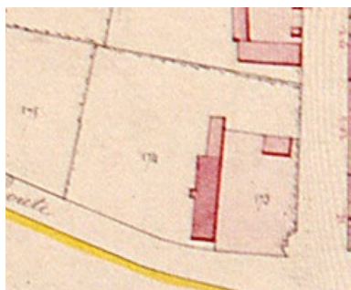
Extrait du cadastre napoléonien présentant le plan de la ferme en 1832.

IVR22_20078005389XAB