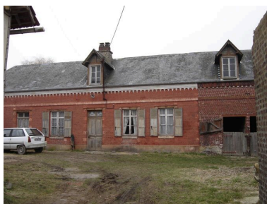
Vue du logis depuis la cour.