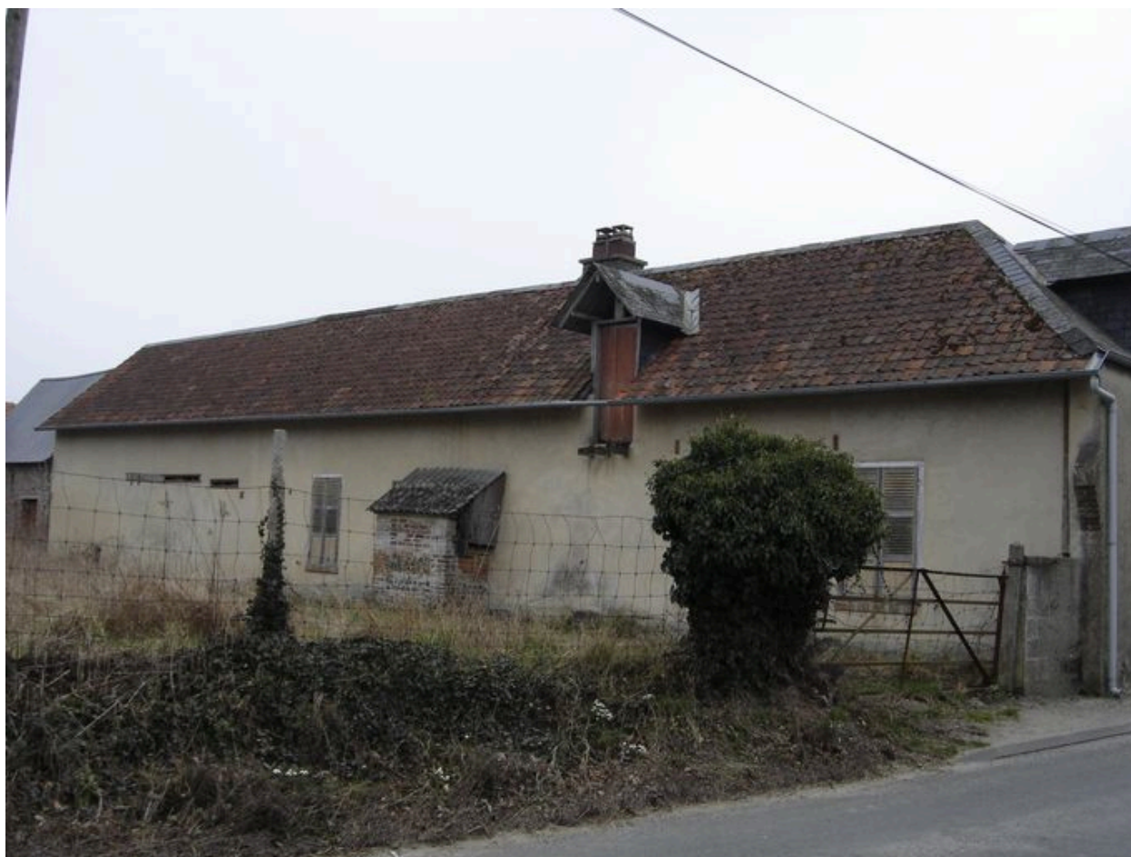
Vue postérieure du logis et du four à pain.