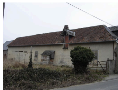
Vue postérieure du logis et du four à pain.