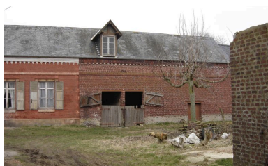
Vue des écuries situées dans le prolongement du logis.