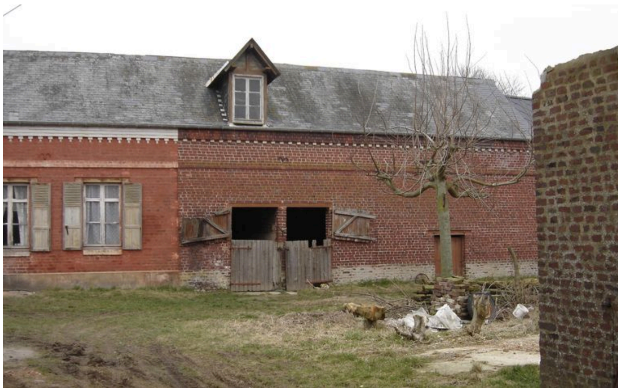
Vue des écuries situées dans le prolongement du logis.