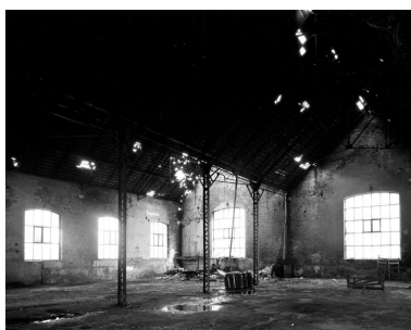
Remise ferroviaire, vue intérieure. IVR31_19955900200V