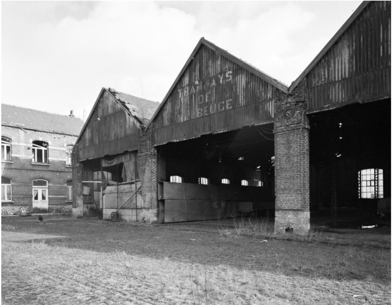
Vue des hangars et de la cour depuis l'entrée.