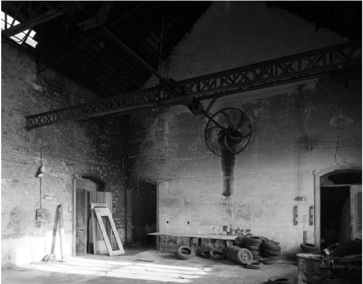
Atelier de réparation, vue intérieure.