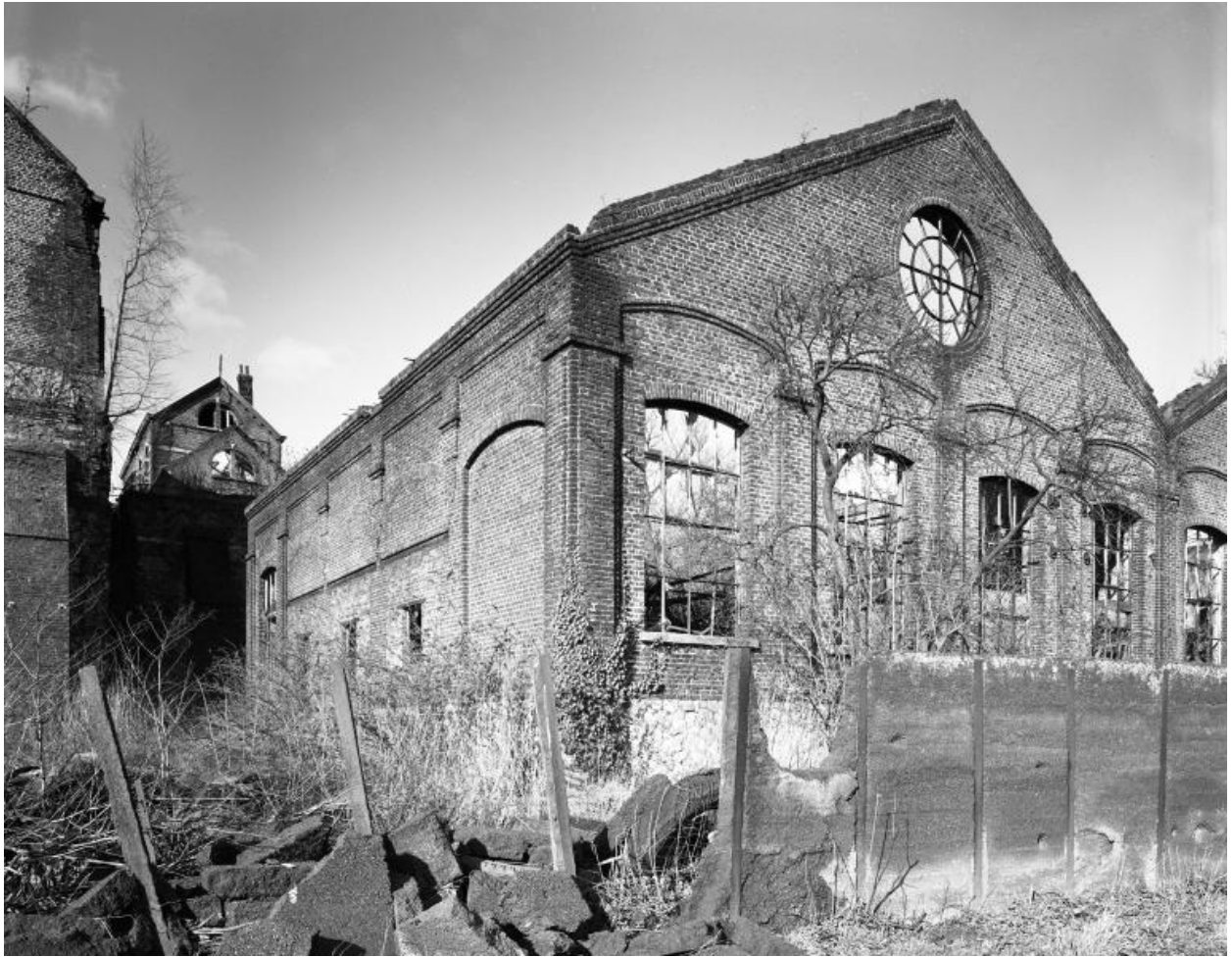
Sous-station électrique. Élévation sur la Sambre. À l'arrière-plan, à gauche, la conciergerie.