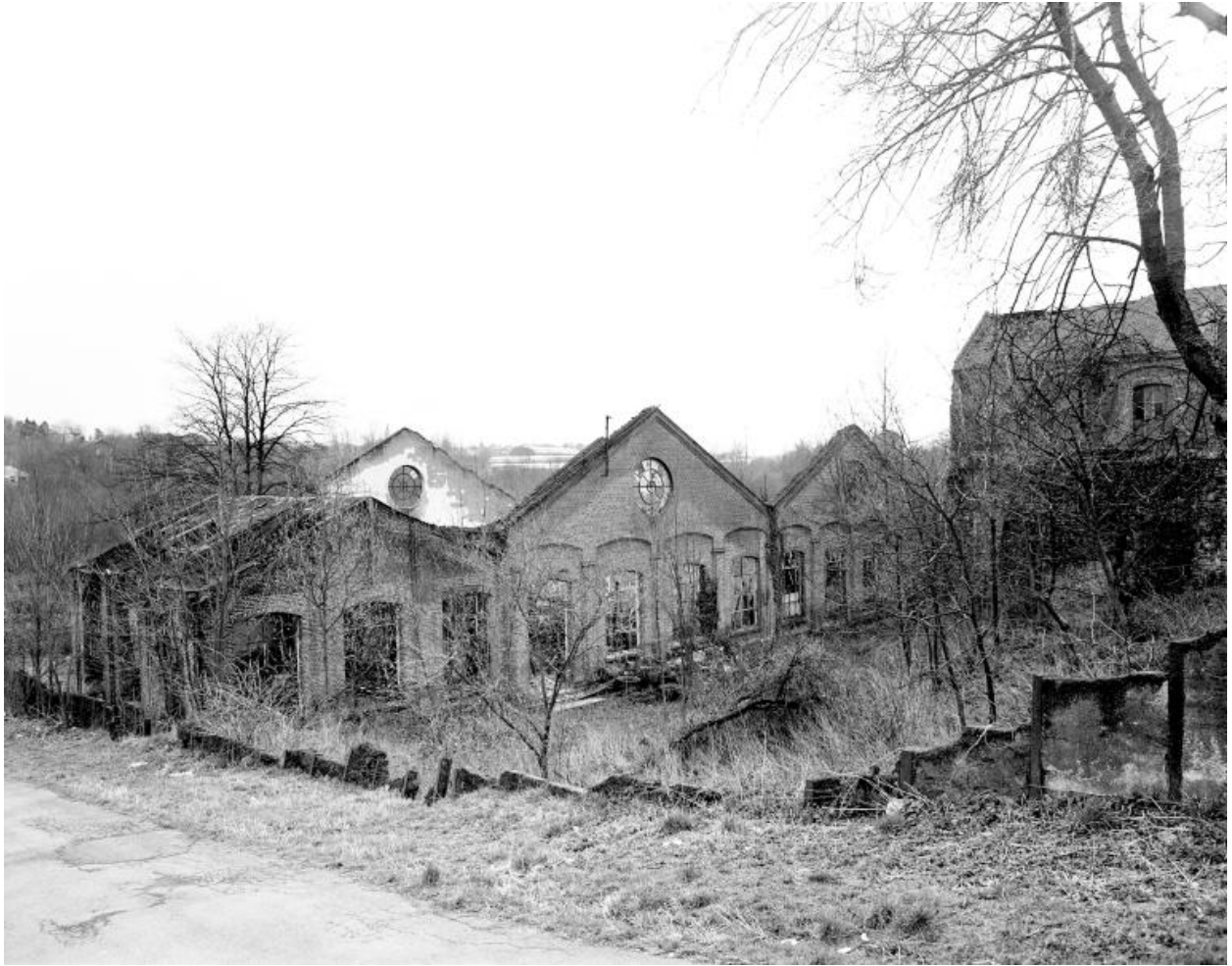
Vestiges de la sous-station électrique. Vue prise vers le sud.