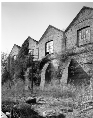
Remise ferroviaire et contreforts. Élévation postérieure, sur la Sambre. IVR31_19955900198V