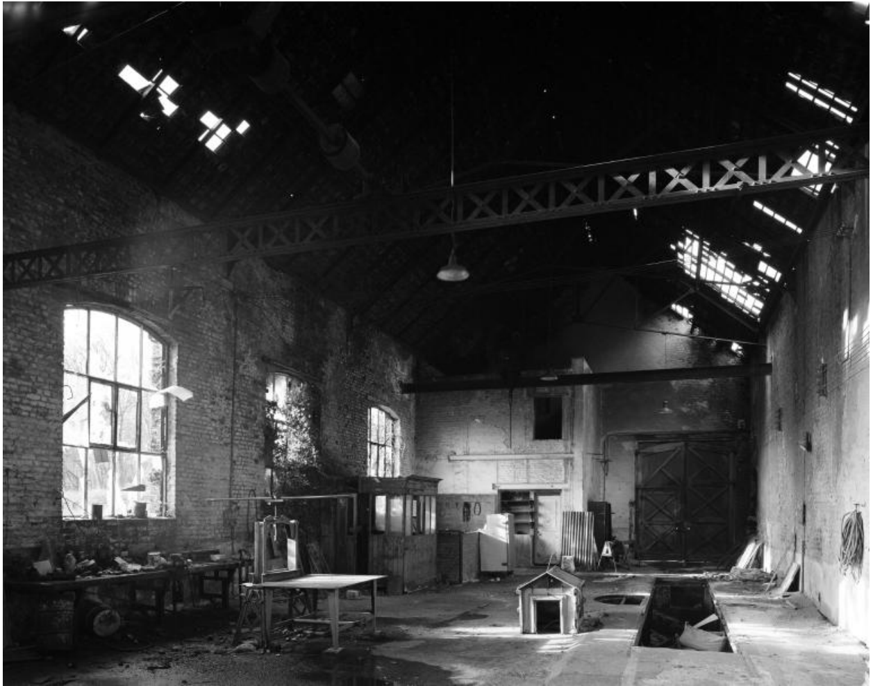
Atelier de réparation, vue intérieure.