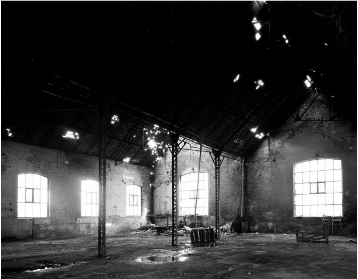
Remise ferroviaire, vue intérieure.