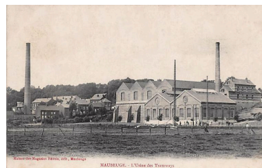
Vue générale depuis la Sambre vers le nord-ouest. Carte postale, photographe inconnu, Maison des Magasins Réunis, [ca 1900] (coll. part.).