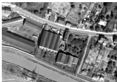
Extrait d'une photographie aérienne de 1952. IVR32_20205902474NUC