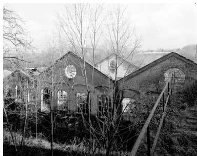
Sous-station électrique. Vue prise depuis la conciergerie. IVR31_19955900197V