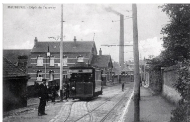
Vue générale vers le sud-ouest depuis la rue d'Hautmont. Carte postale, photographe inconnu, Maison des Magasins Réunis, [ca 1900] (coll. part.). IVR32_20205902472NUCA