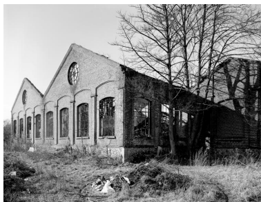
Sous-station électrique. Élévation sur la Sambre. IVR31_19955900196V