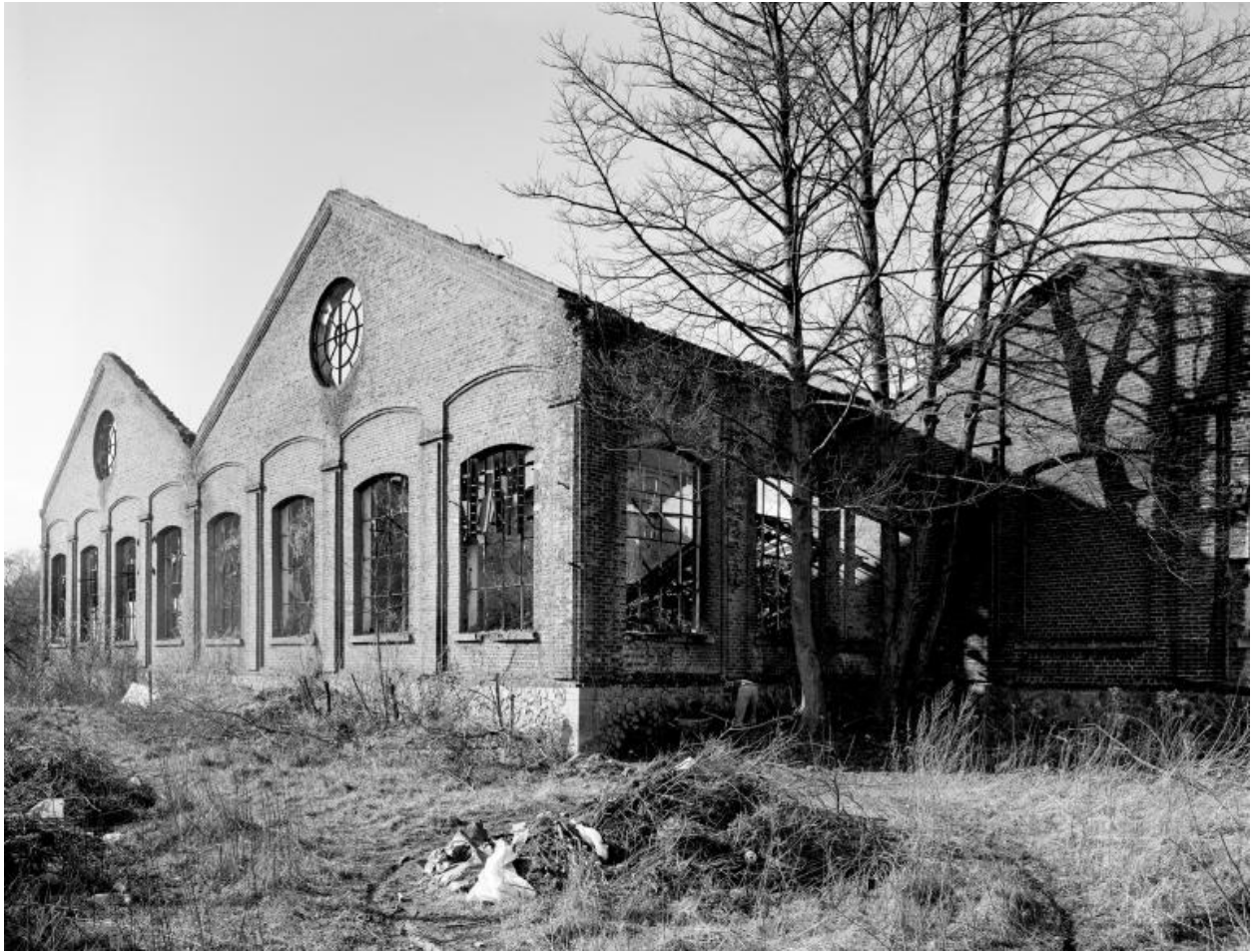
Sous-station électrique. Élévation sur la Sambre.