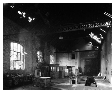
Atelier de réparation, vue intérieure. IVR31_19955900201V