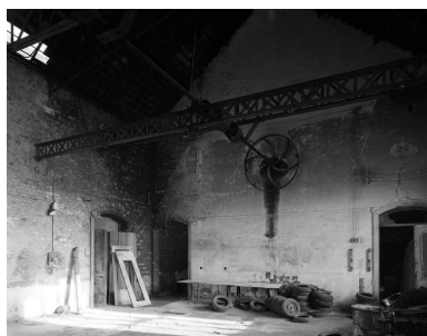
Atelier de réparation, vue intérieure.