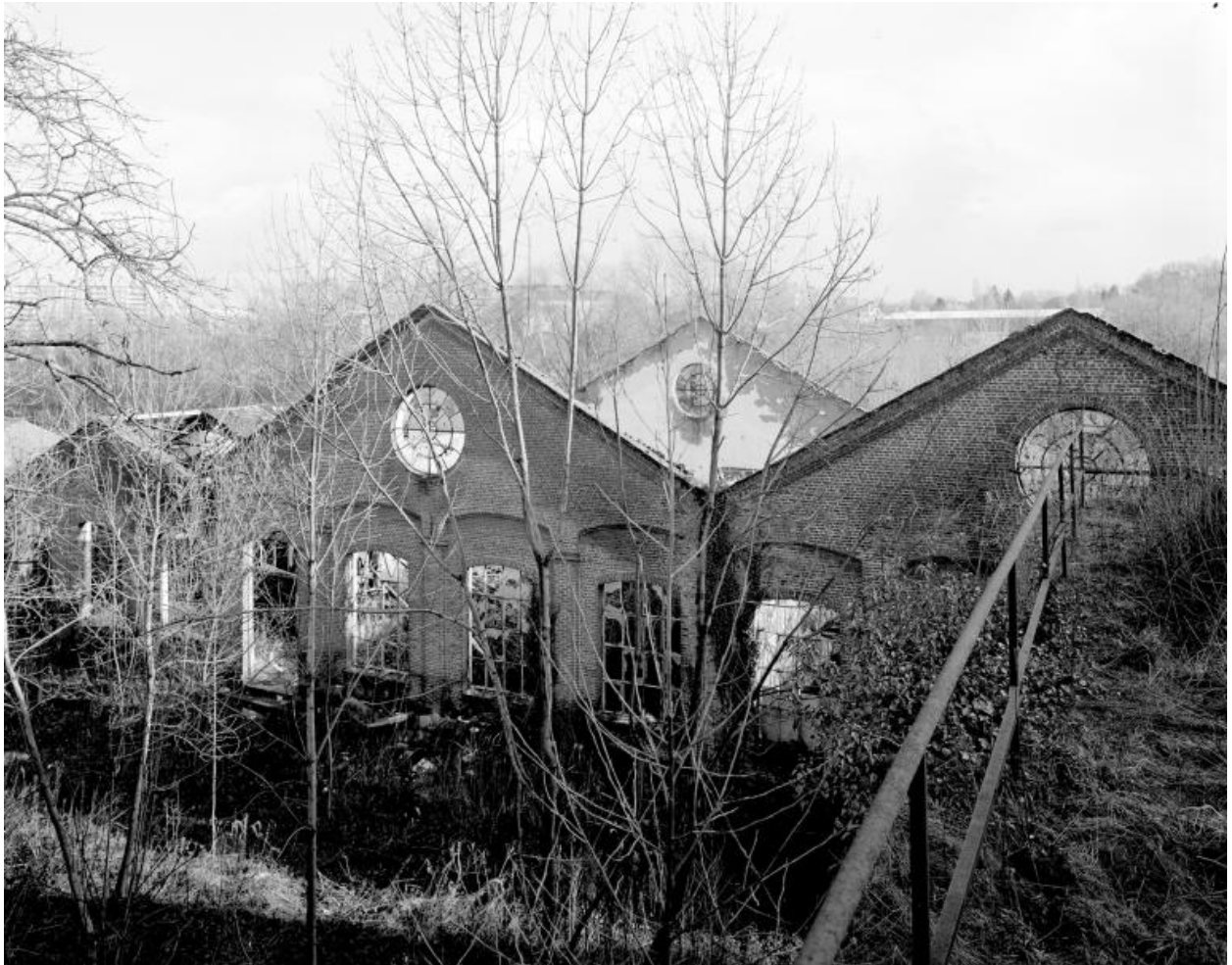
Sous-station électrique. Vue prise depuis la conciergerie.