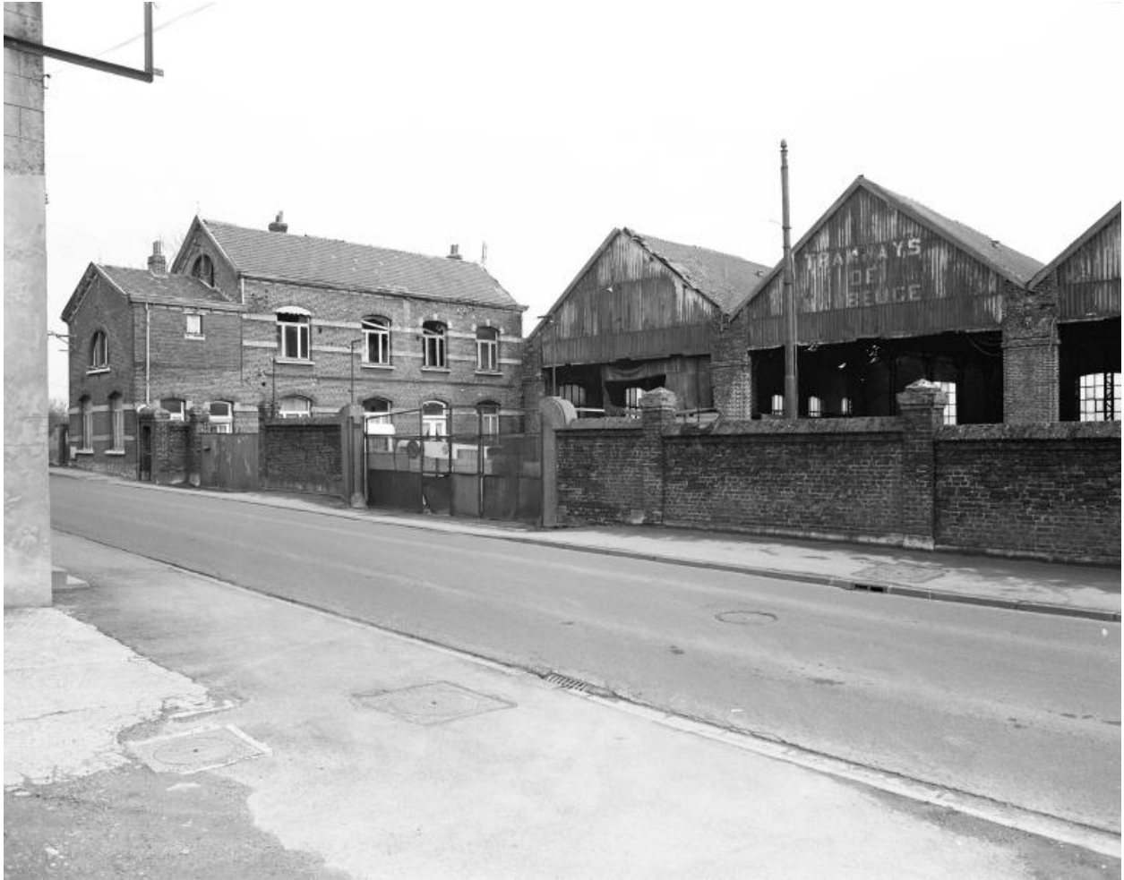
Vue générale depuis la rue, les bureaux et les hangars, prise vers l'est.