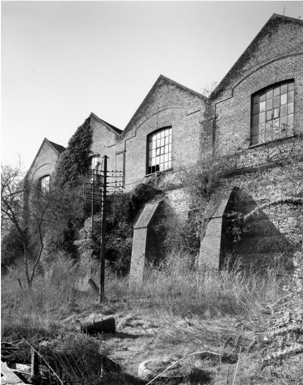
Remise ferroviaire et contreforts. Élévation postérieure, sur la Sambre.