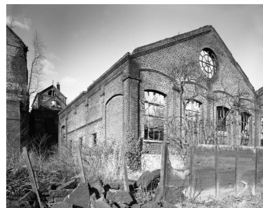
Sous-station électrique. Élévation sur la Sambre. À l'arrière-plan, à gauche, la conciergerie. IVR31_19955900195V