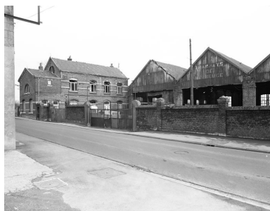
Vue générale depuis la rue, les bureaux et les hangars, prise vers l'est. IVR31_19955900204V