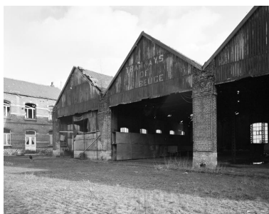
Vue des hangars et de la cour depuis l'entrée.