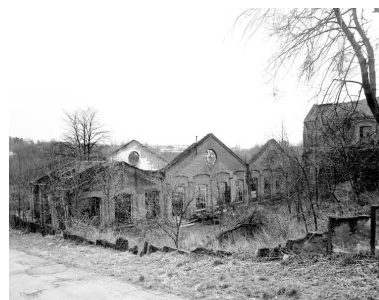
Vestiges de la sous-station électrique. Vue prise vers le sud.