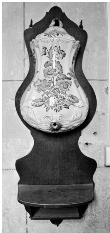
Vue générale. IVR22_20008000435Z