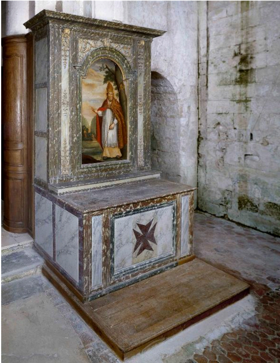
Vue de trois-quarts de l'autel de Saint-Hubert et de son décor.