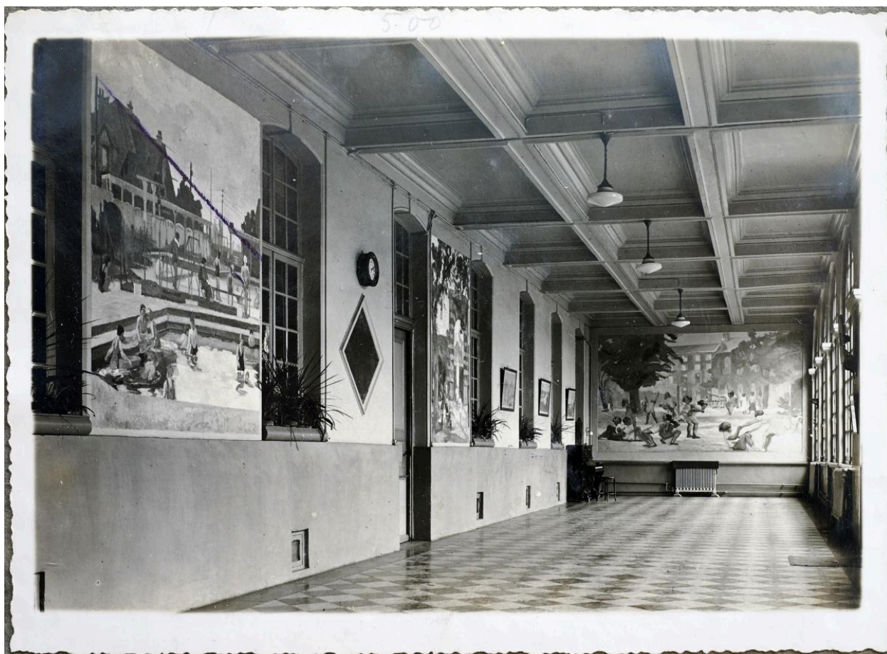
Vue du cloître avec les tableaux de Tellier. Photographie, vers 1938.