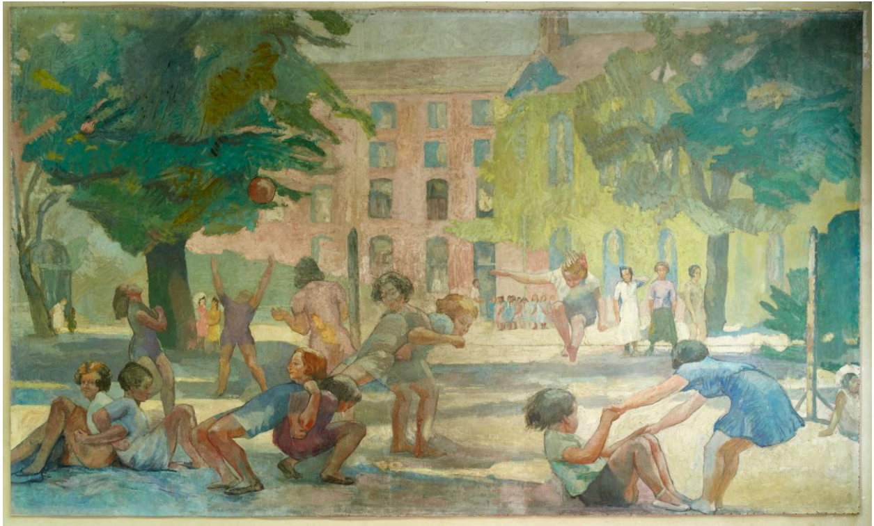
Scène de jeux dans la cour des élèves du collège de jeunes filles, avec la façade de l'aile de l'horloge et la chapelle à l'arrière plan. (tableau 1)