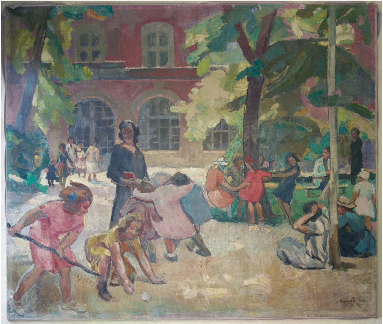
Scène de jeux dans la cour d'honneur du collège de jeunes filles, avec l'aile de l'horloge à l'arrière-plan. Signé et daté Raymond Tellier, 1933. (tableau 2)