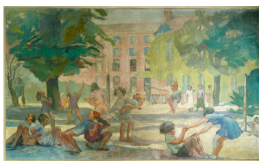
Scène de jeux dans la cour des élèves du collège de jeunes filles, avec la façade de l'aile de l'horloge et la chapelle à l'arrière plan. (tableau 1) IVR32_20225900243NUCA