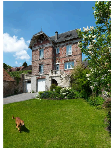
Vue d'ensemble antérieure, sur jardin. IVR22_20138000176NUC2A