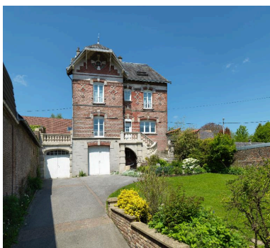
Vue d'ensemble de la façade principale. IVR22_20138000175NUC2A