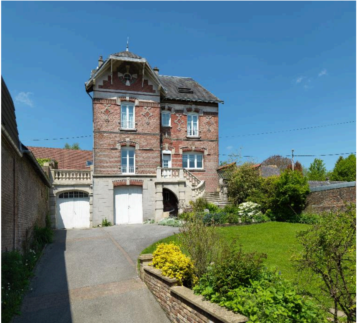
Vue d'ensemble de la façade principale.