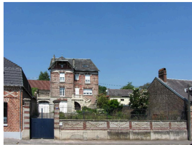
Vue d'ensemble de la propriété depuis la rue.