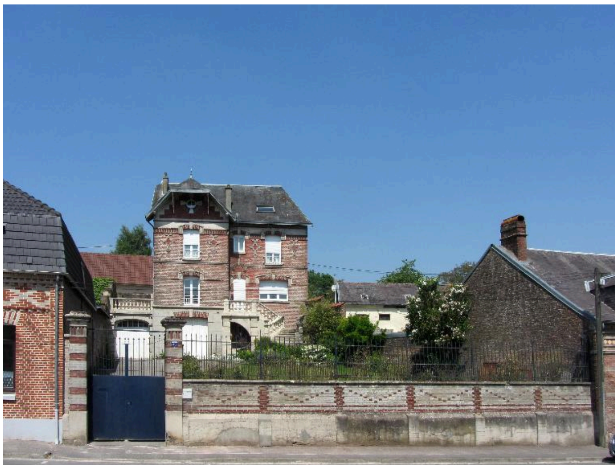
Vue d'ensemble de la propriété depuis la rue.