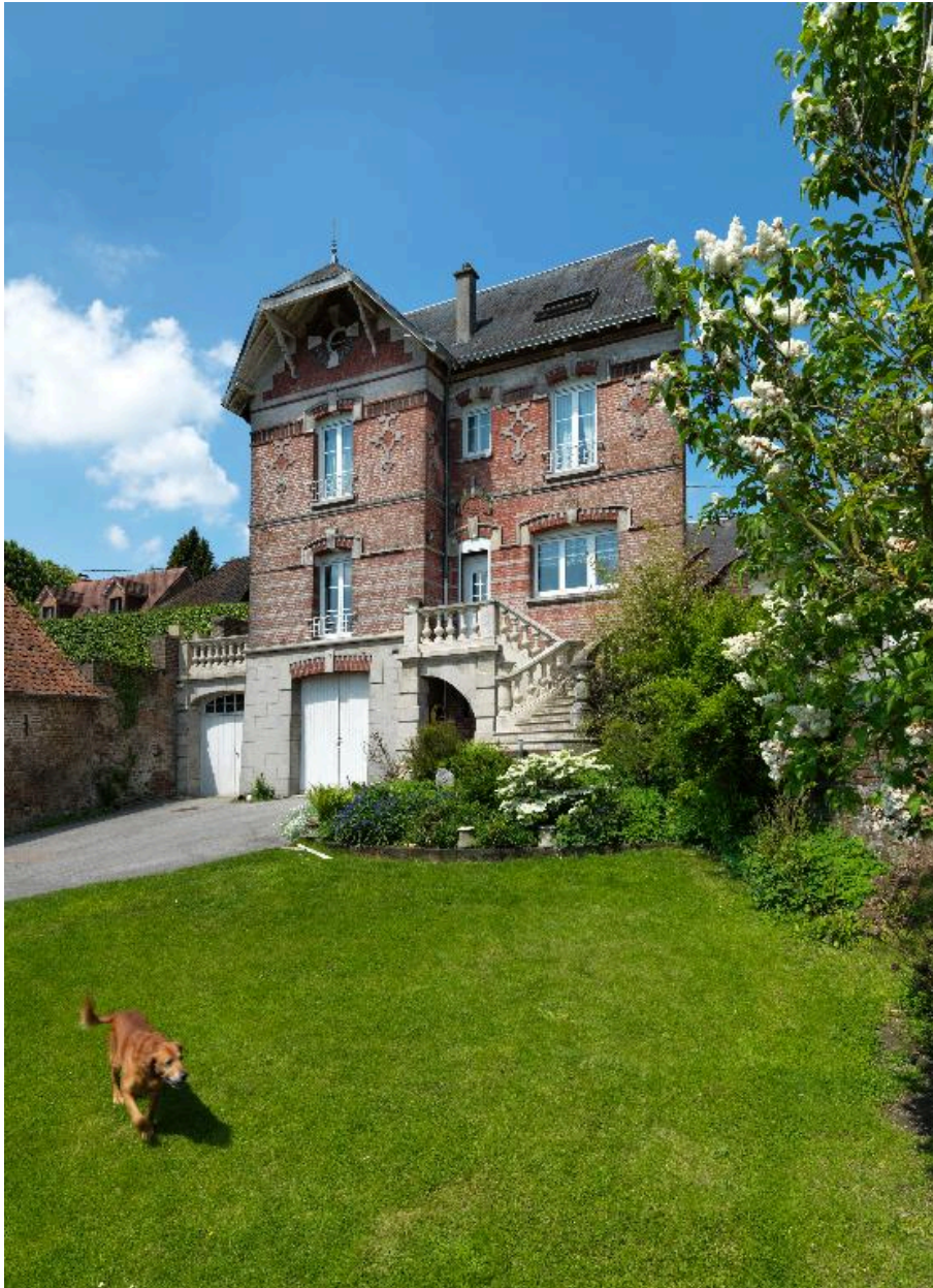
Vue d'ensemble antérieur, sur jardin.