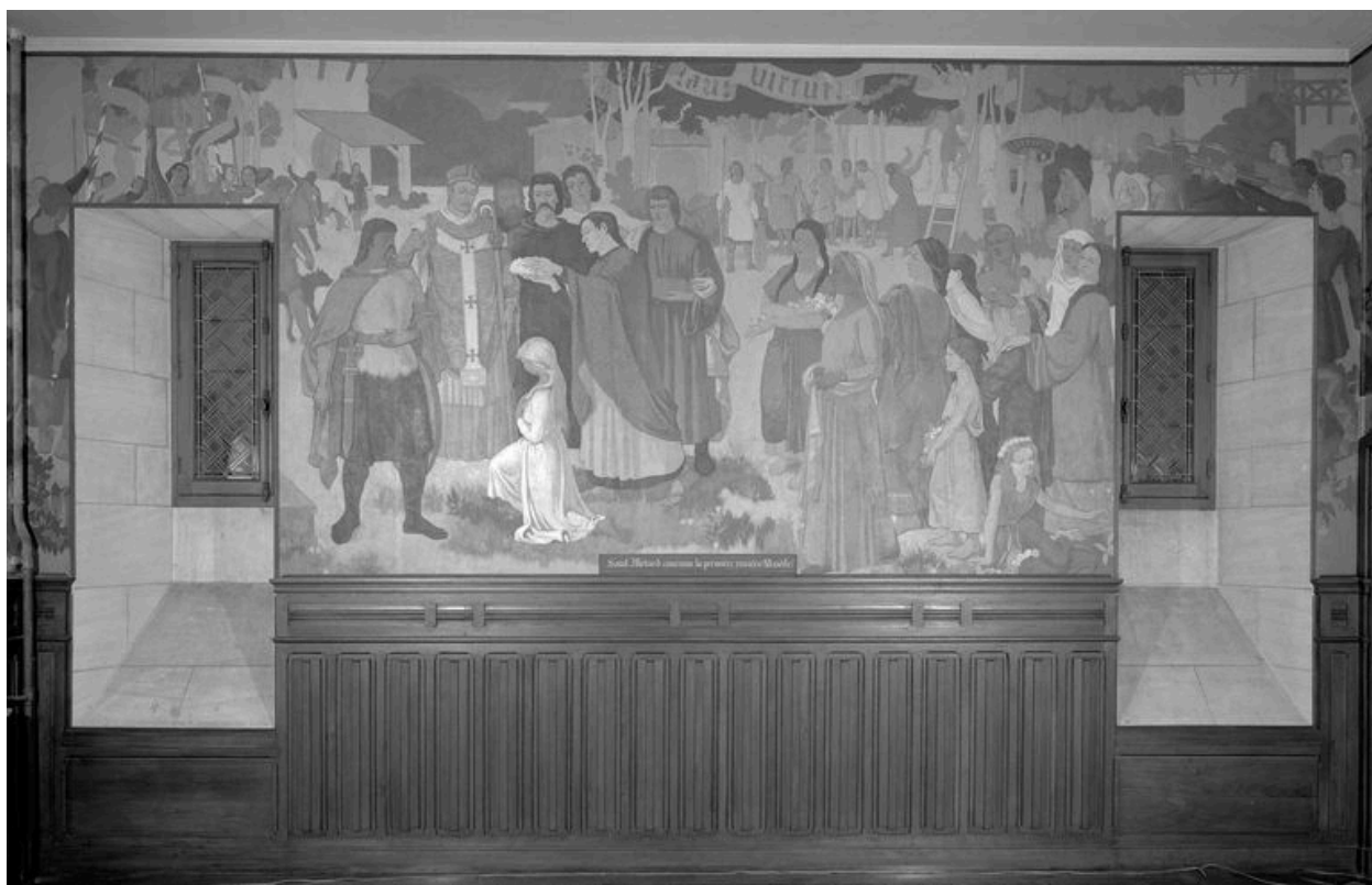
Mur nord : Saint Médard couronne la 1ère Rosière.