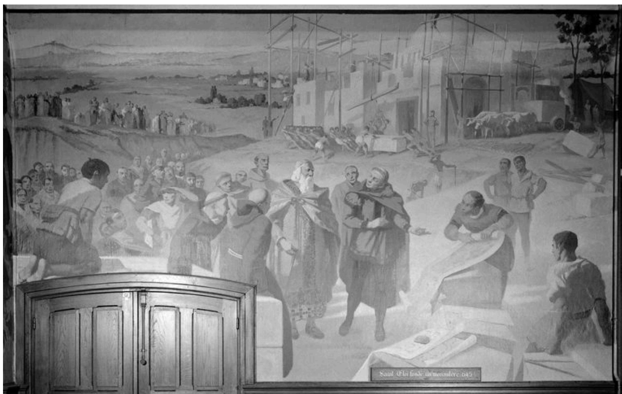
Mur est : Saint Eloi fonde un monastère.