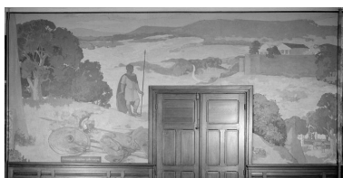
Mur ouest : Noviomagus oppidum gallo-romain.