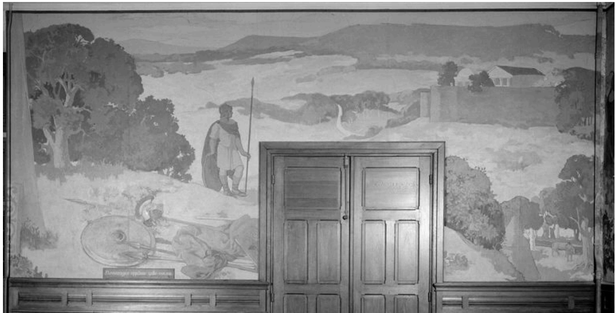
Mur ouest : Noviomagus oppidum gallo-romain.