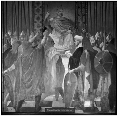
Mur est : Hugues Capet élu roi. IVR22_19856001531X