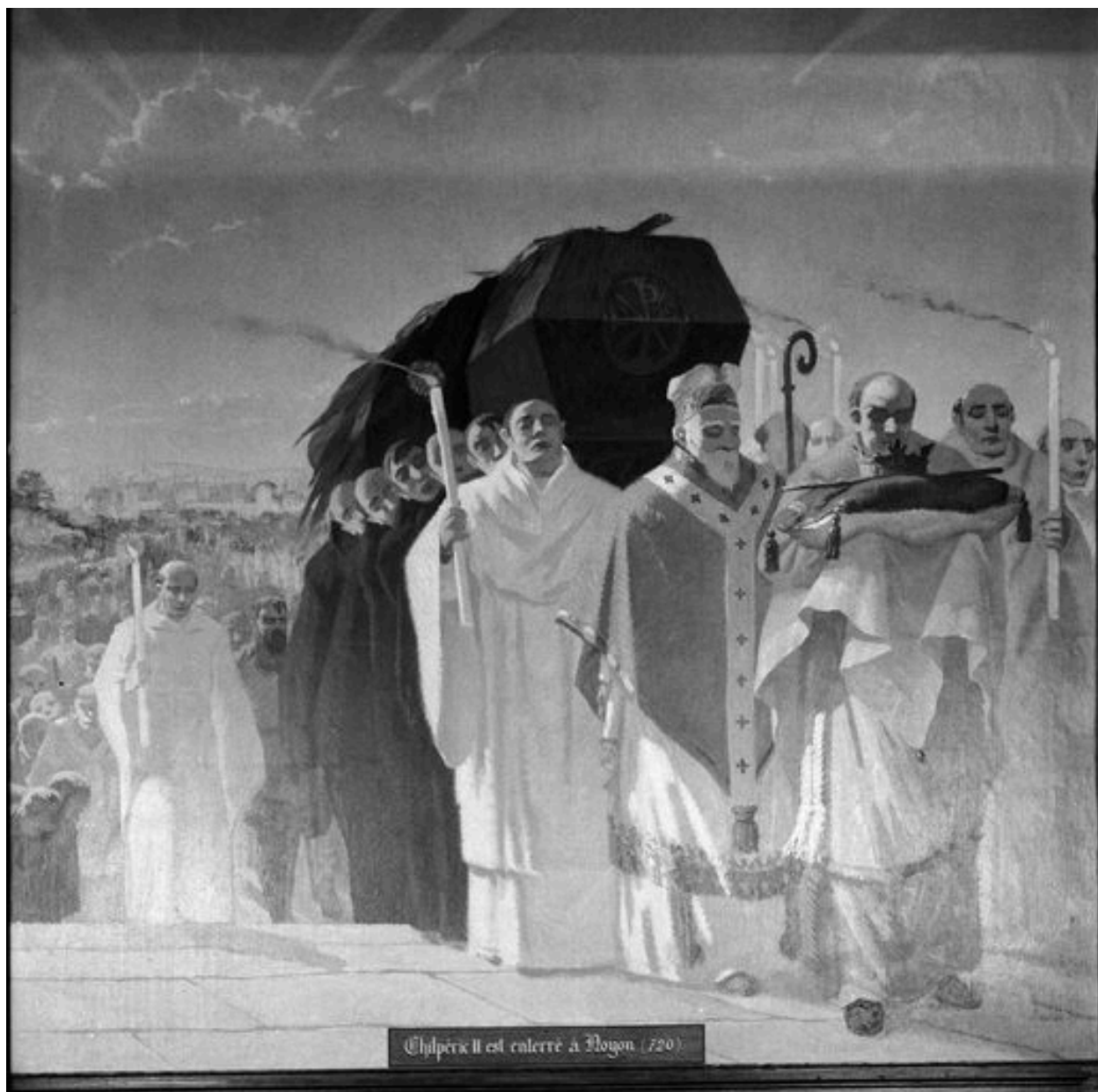
Mur est : Childéric II est enterré à Noyon.