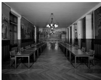
Vue générale de la salle du Conseil.