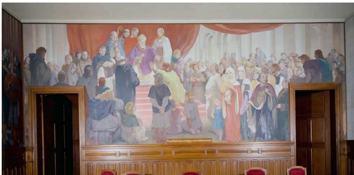
Mur sud : l'Evêque Baudri remet aux habitants une charte de libertés communales.