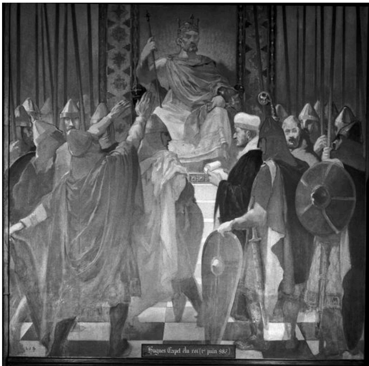
Mur est : Hugues Capet élu roi.