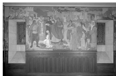
Mur nord : Saint Médard couronne la 1ère Rosière.