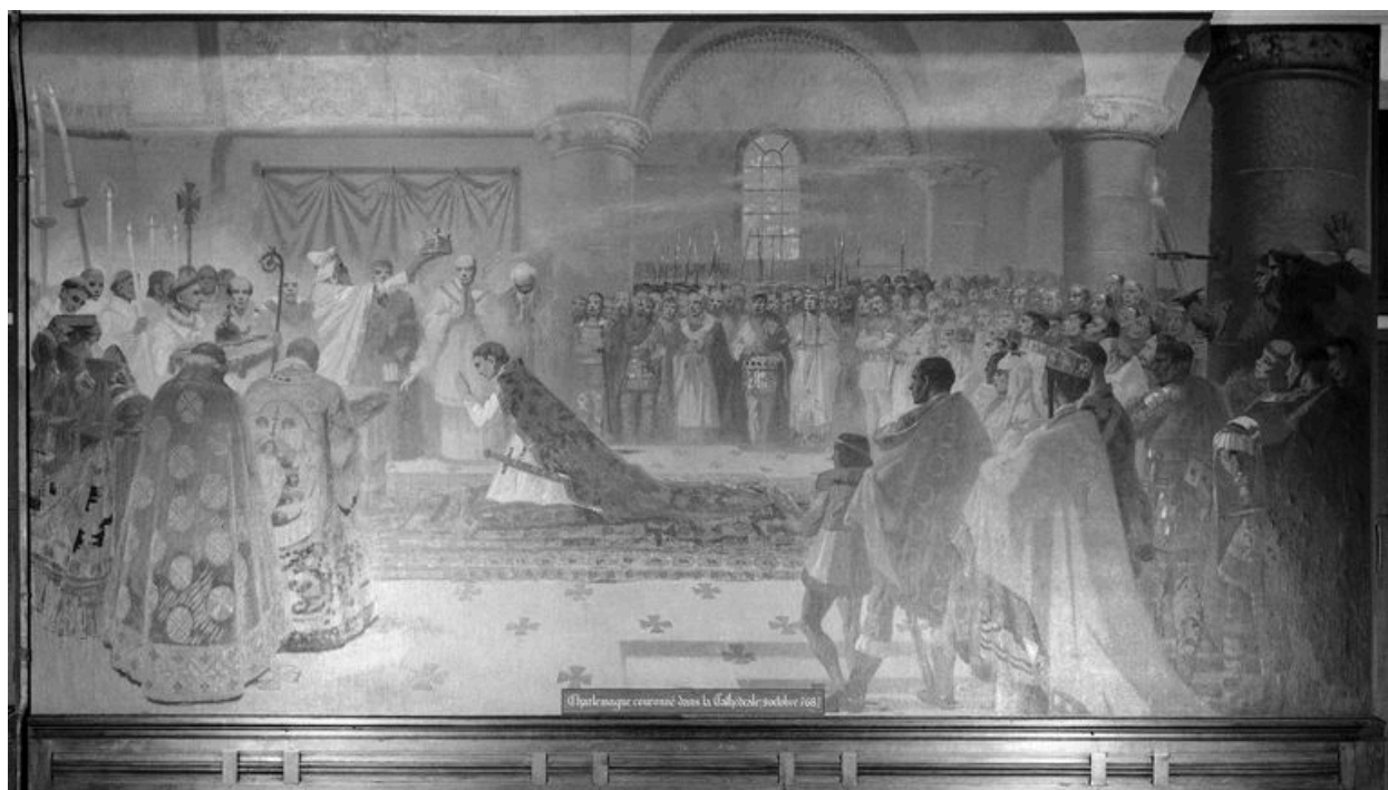
Mur est : Charlemagne couronné dans la cathédrale.