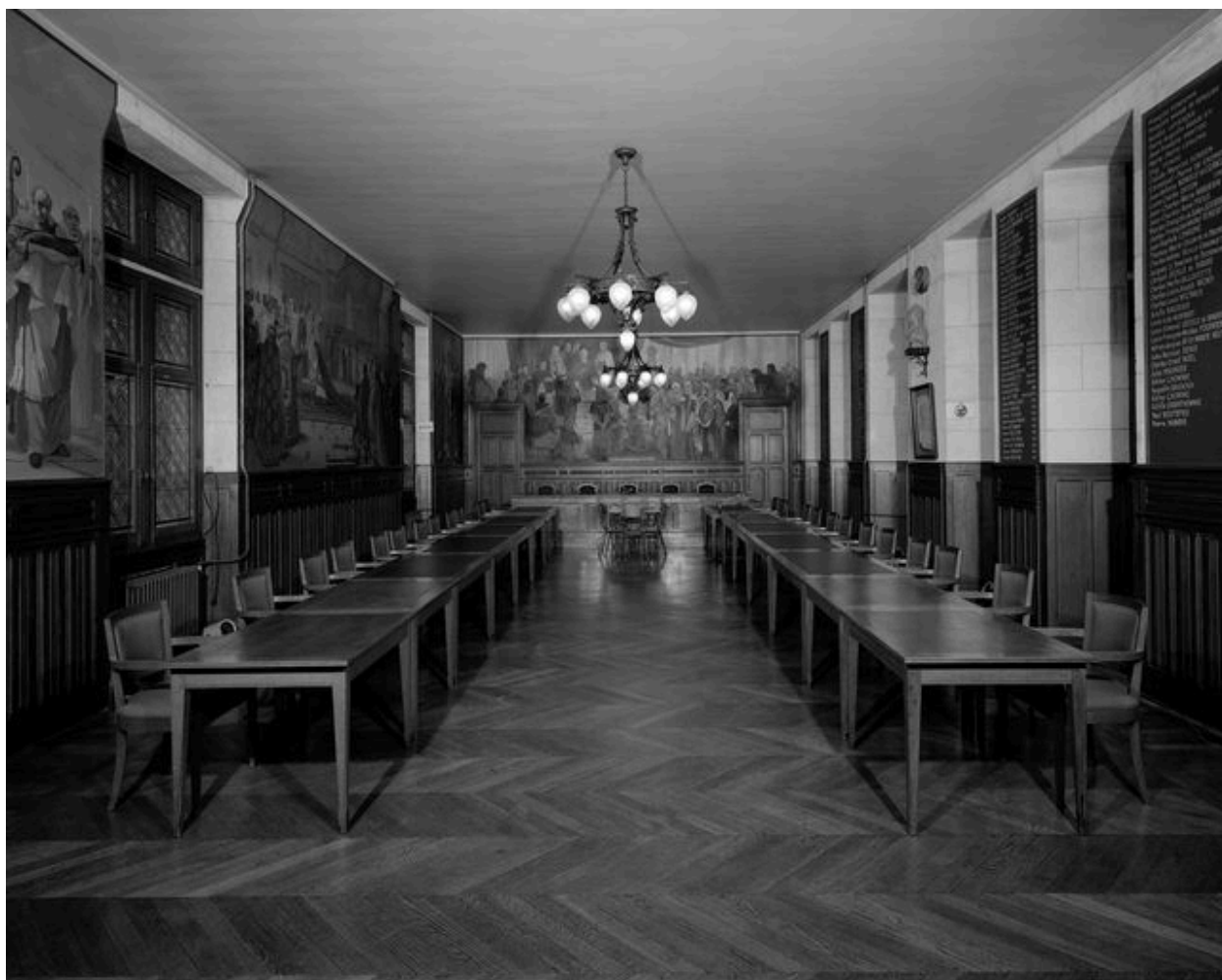
Vue générale de la salle du Conseil.