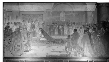
Mur est : Charlemagne couronné dans la cathédrale.