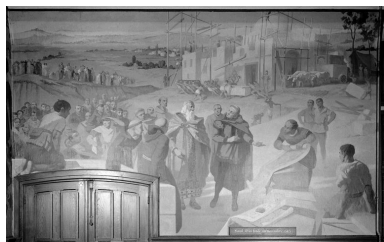
Mur est : Saint Eloi fonde un monastère. IVR22_19856001532X