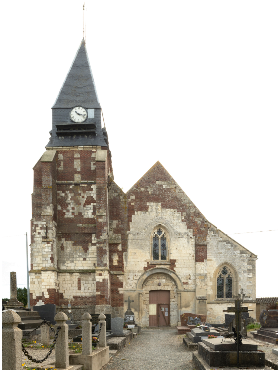
Vue générale de l'élévation occidentale.