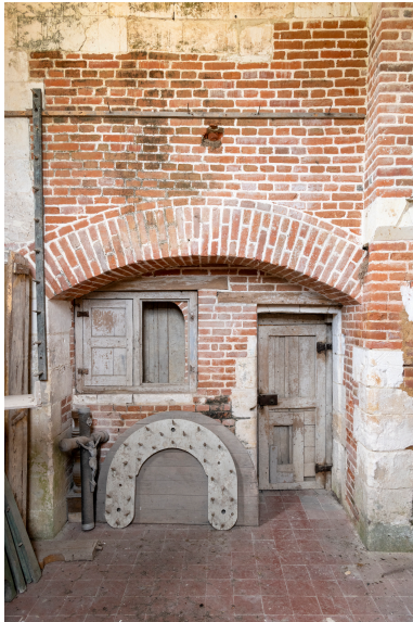
Intérieur de l'ancienne chapelle seigneuriale avec baies ouvrantes entre le sanctuaire et la chapelle.

Phot. Marc Kérignard IVR32_20266000124NUCA