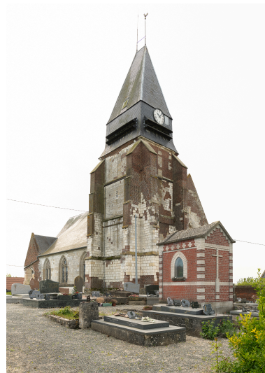
Vue générale depuis le nord-ouest.

IVR32_20266000094NUCA