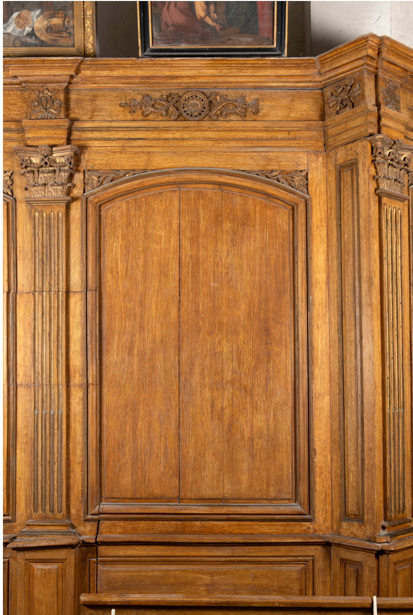
Panneau de lambris du chœur, premier quart du XIXe siècle, inscrit MH.