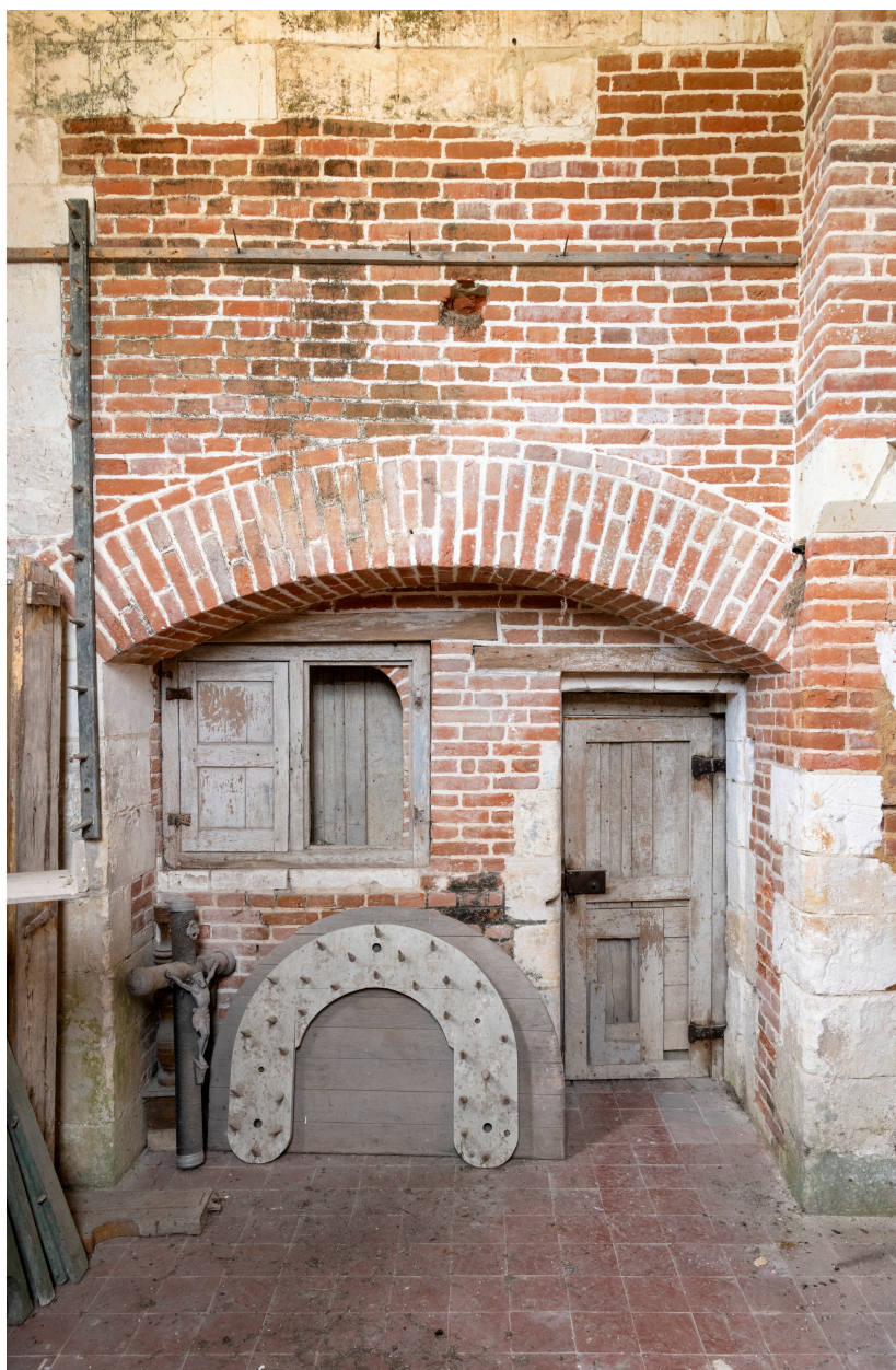
Intérieur de l'ancienne chapelle seigneuriale avec baies ouvrantes entre le sanctuaire et la chapelle.