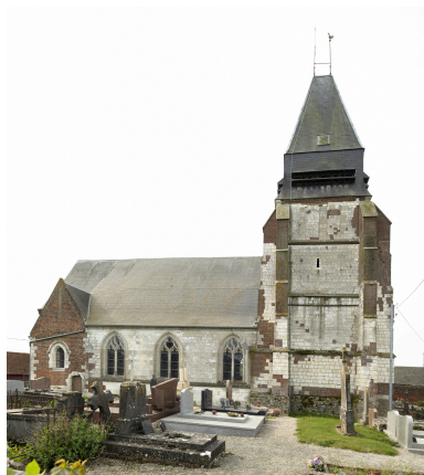
Vue générale de l'élévation nord.

IVR32_20266000095NUCA