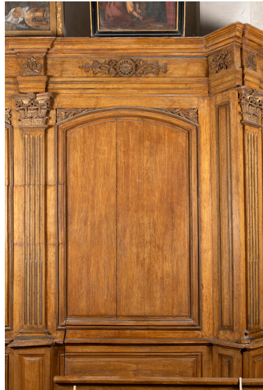
Panneau de lambris du chœur, premier quart du XIXe siècle, inscrit MH.

IVR32_20266000124NUCA