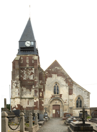
Vue générale de l'élévation occidentale.

IVR32_20256000561NUCA