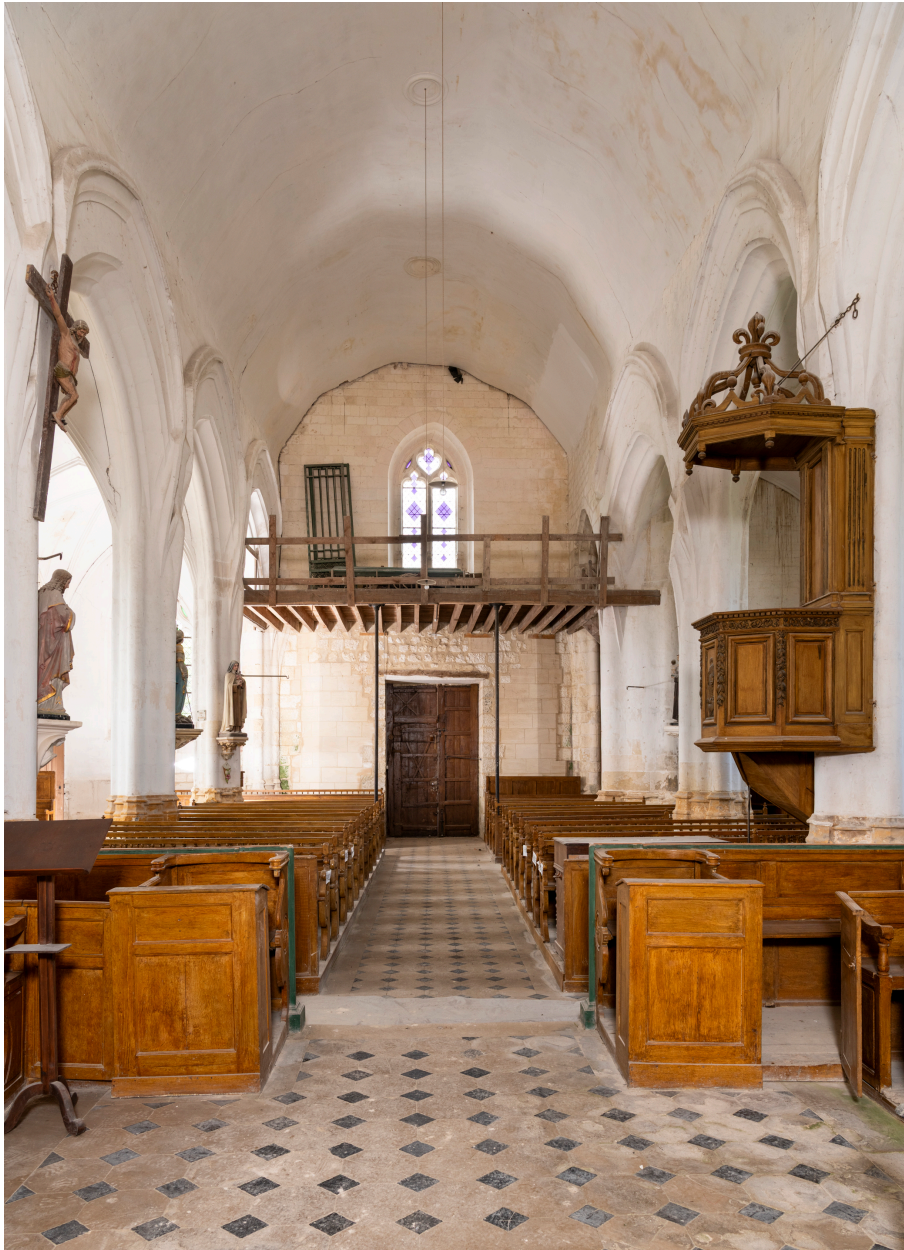
Vue intérieure vers la nef.