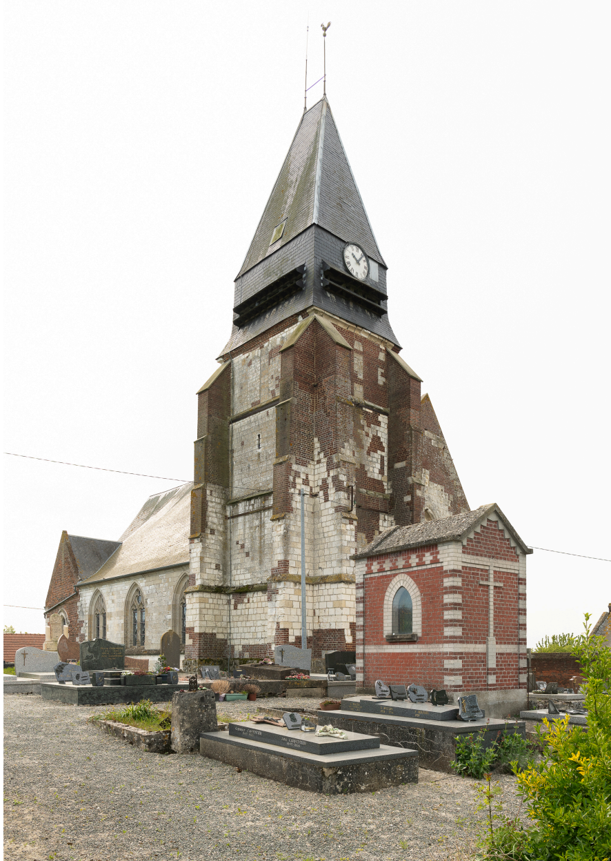
Vue générale depuis le nord-ouest.