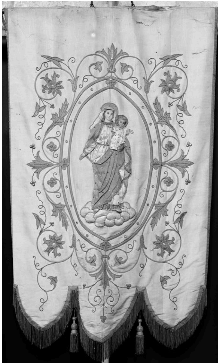
Bannière, 1922 : Vierge à l'Enfant.