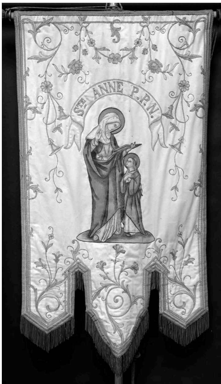
Bannière, 20e siècle : Education de la Vierge.