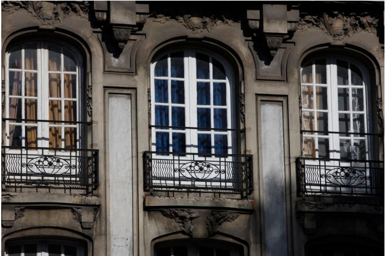
Détail d'un garde-corps au motif de panier stylisé.