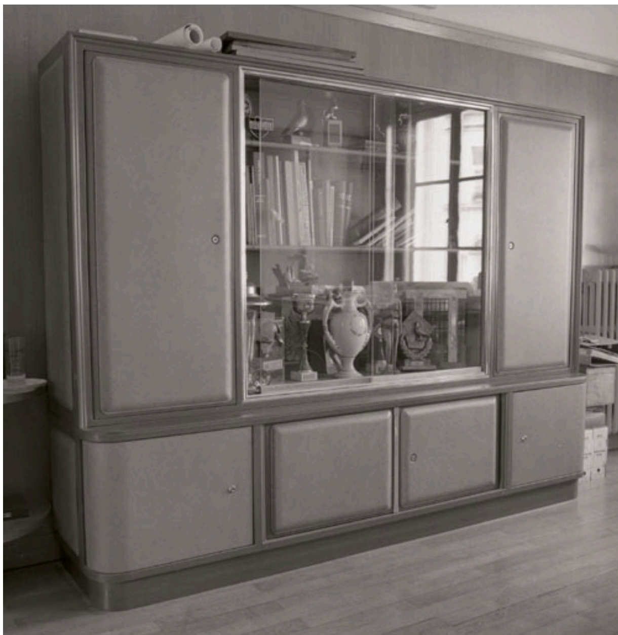
Armoire-bibliothèque : vue générale.