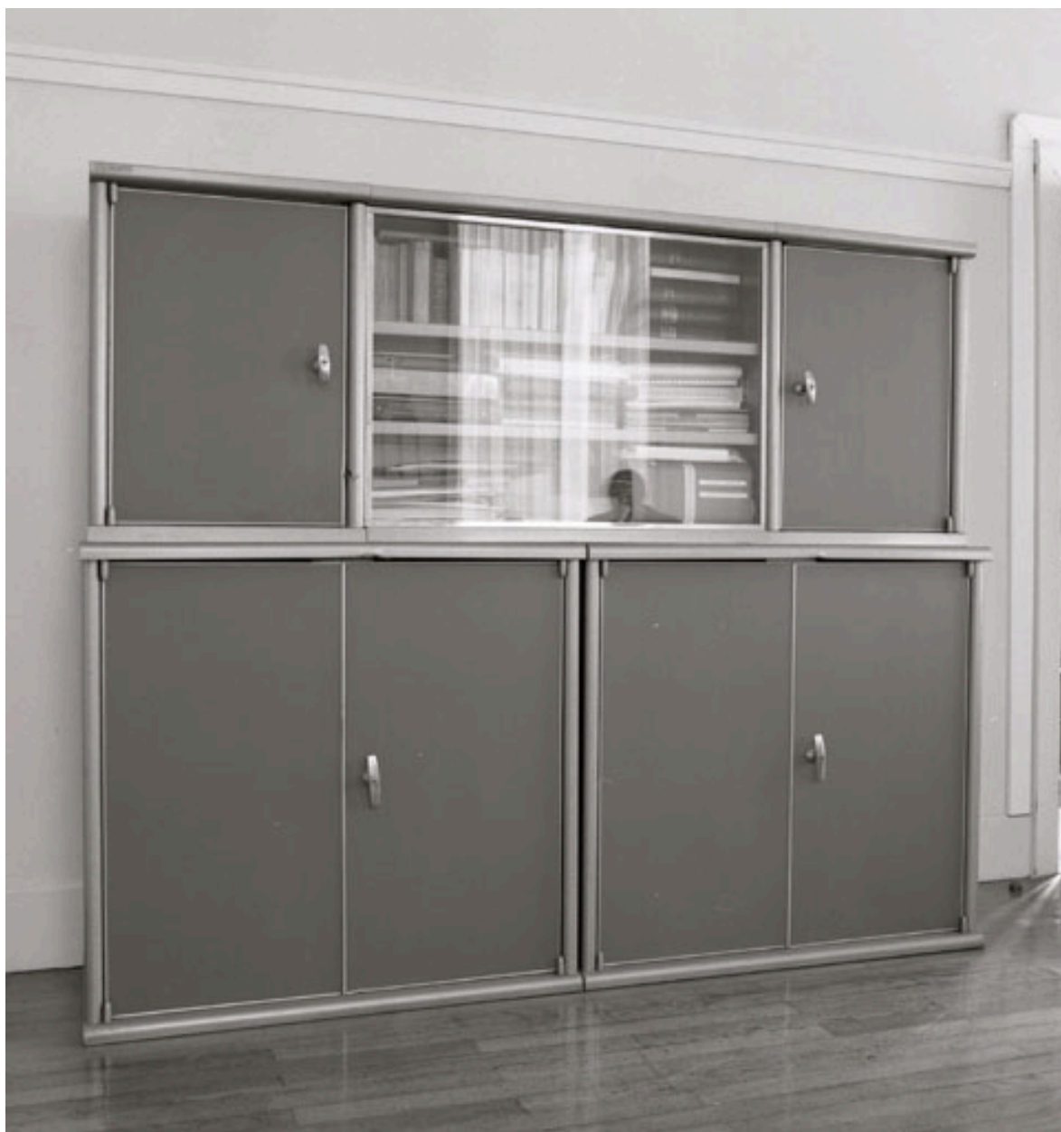
Meuble modulable faisant office d'armoire : vue générale.