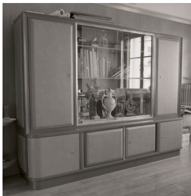
Armoire-bibliothèque : vue générale. IVR31_20065900004X