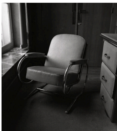
Fauteuil de visiteur : vue générale de trois quarts.