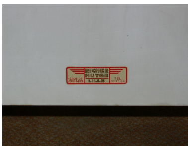
Bureau du directeur général des services : détail, marque de fabricant.

Phot. Anita Oger-Leurent IVR31_20065906085NUCA