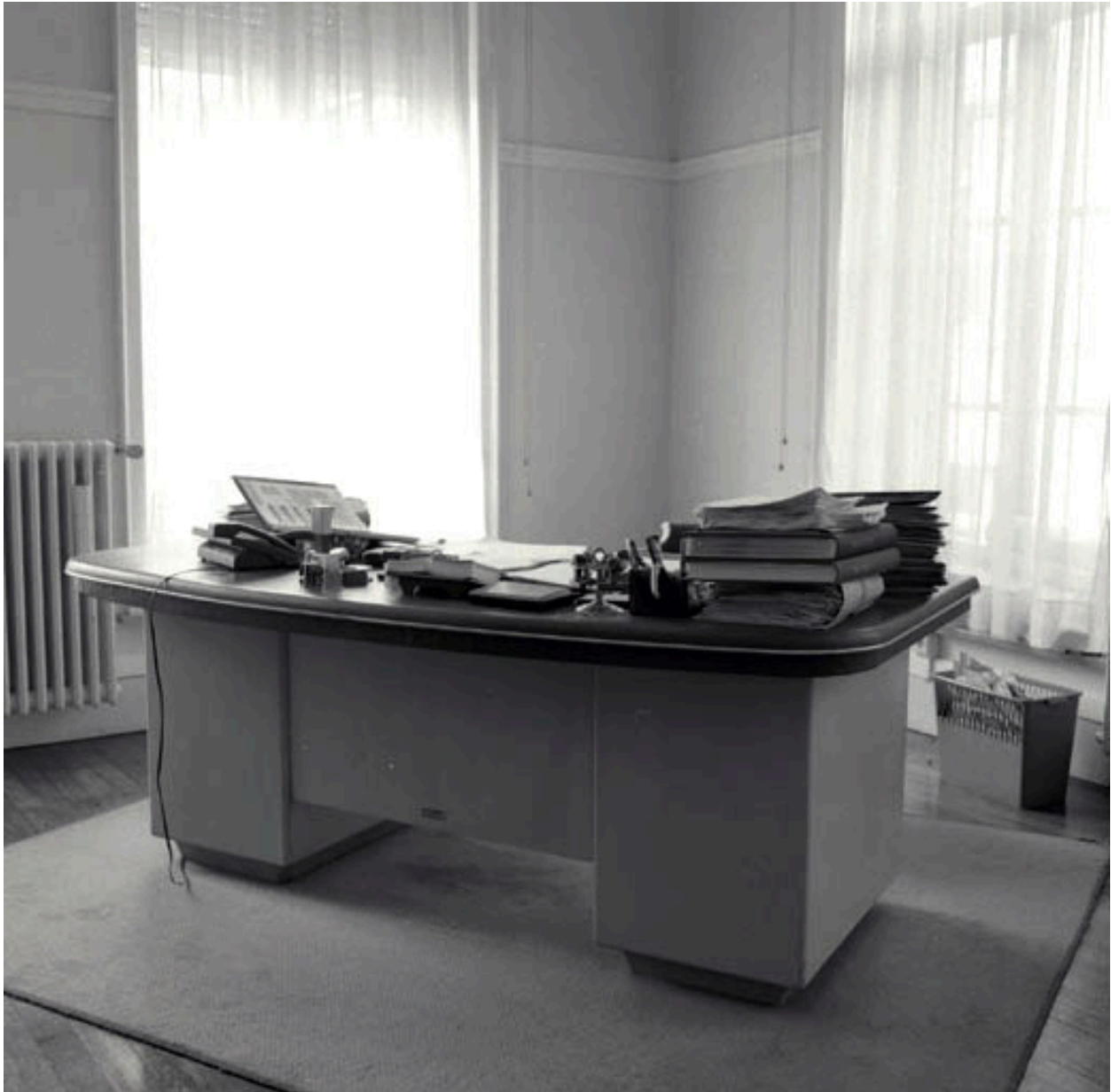
Bureau du directeur général des services : vue générale de trois quarts face.