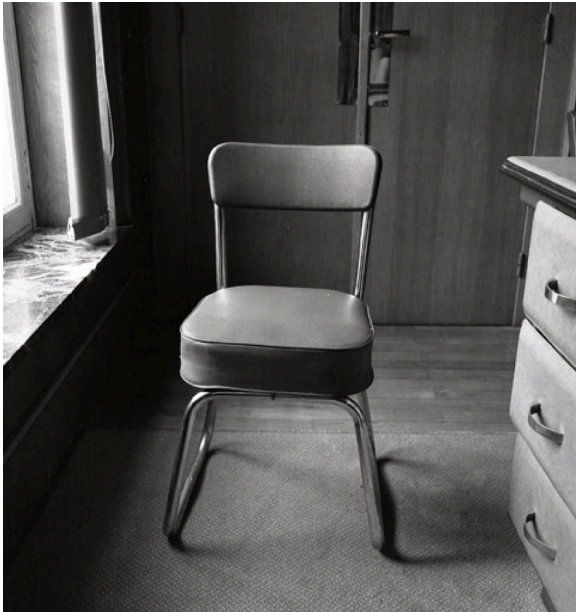
Chaise : vue générale de face.