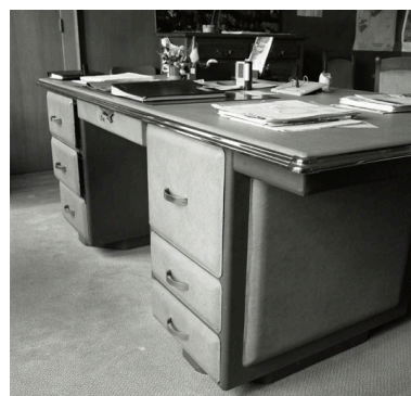
Bureau du maire : vue générale de trois quarts arrière.

Phot. Anita Oger-Leurent IVR31_20065906085NUCA