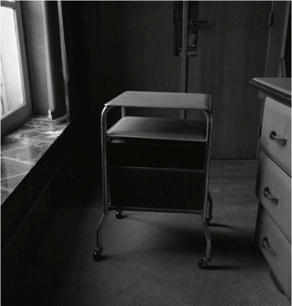
Table de téléphone : vue générale de face.