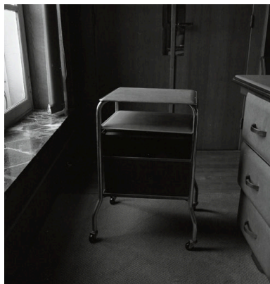
Table de téléphone : vue générale de face. IVR31_20065900006X