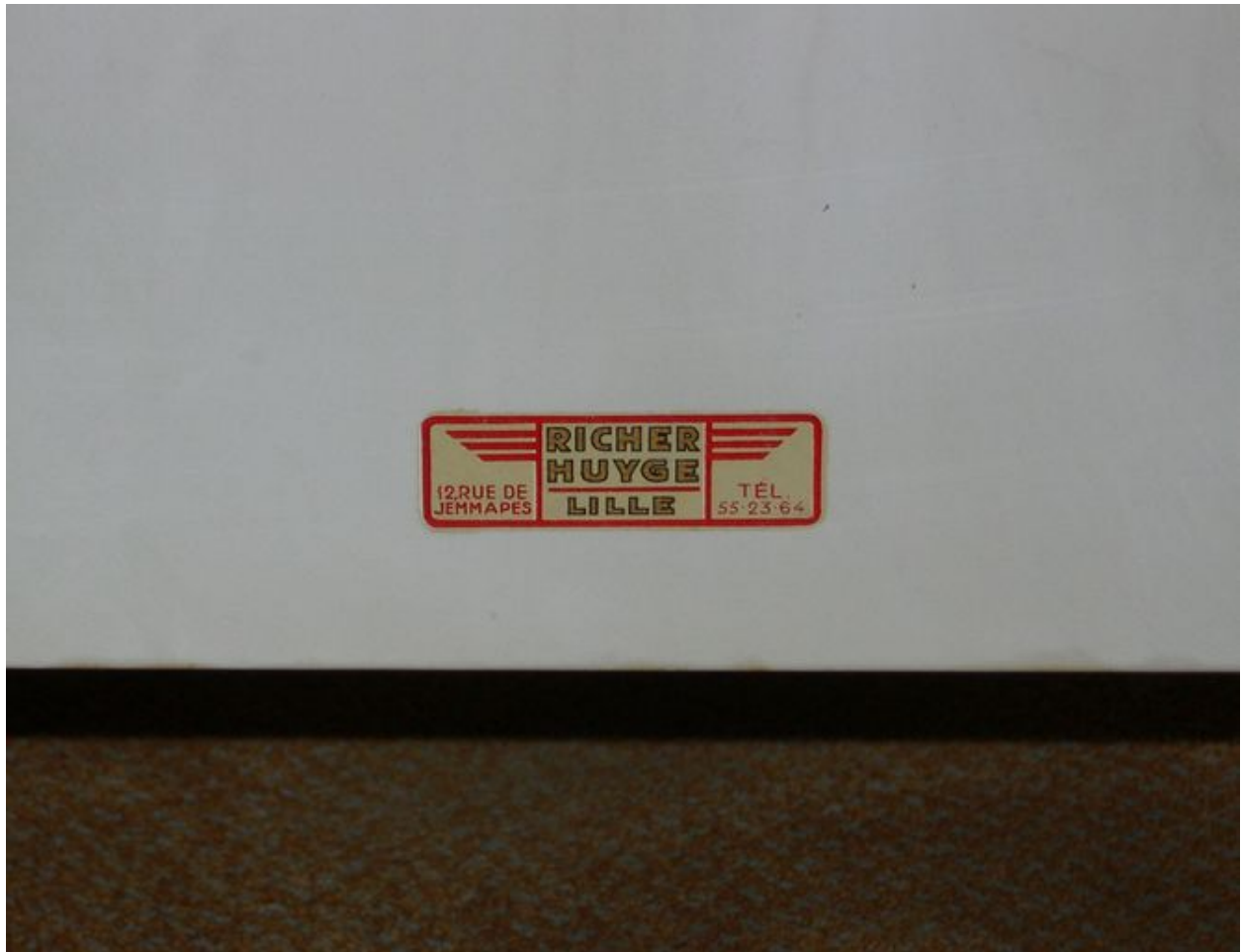
Bureau du directeur général des services : détail, marque de fabricant.