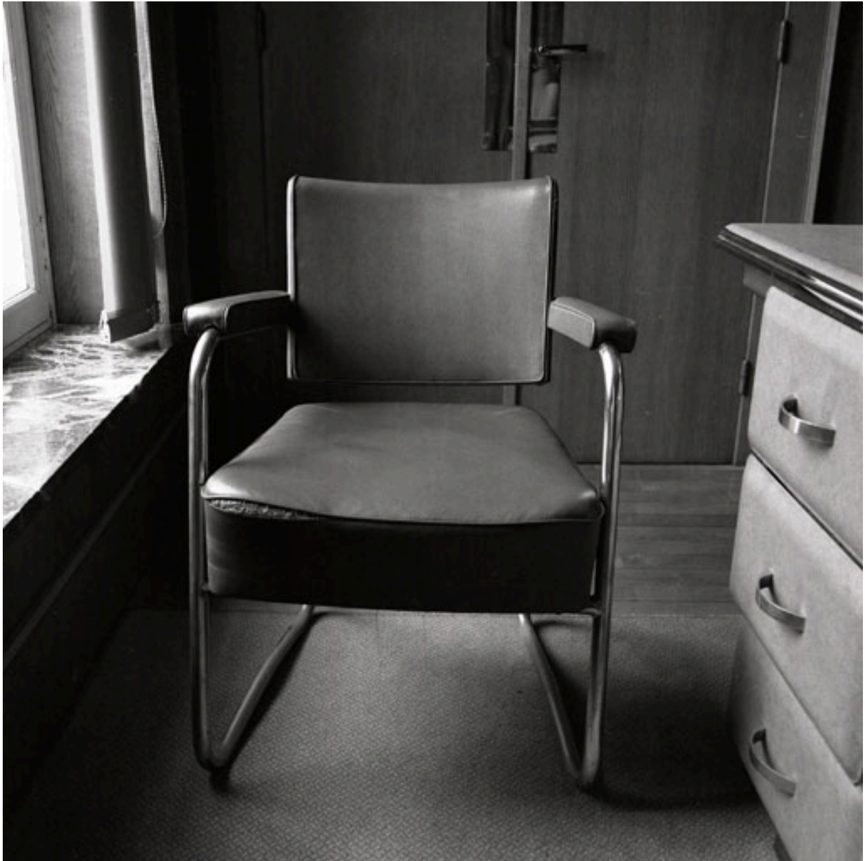
Fauteuil : vue générale de face.