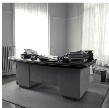
Bureau du directeur général des services : vue générale de trois quarts face.