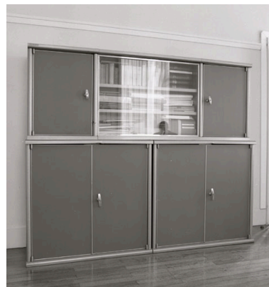
Meuble modulable faisant office d'armoire : vue générale. IVR31_20065900012X