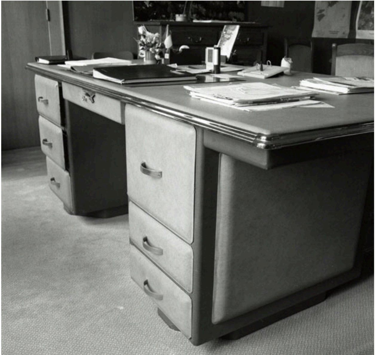
Bureau du maire : vue générale de trois quarts arrière.