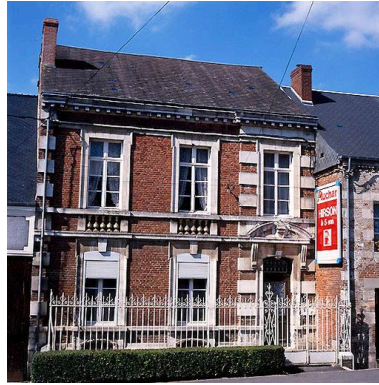
Vue générale. IVR22_19990205465XA