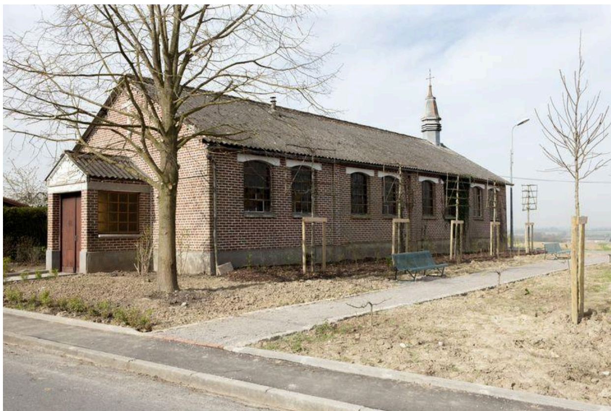
Élévation antérieure et flanc droit.