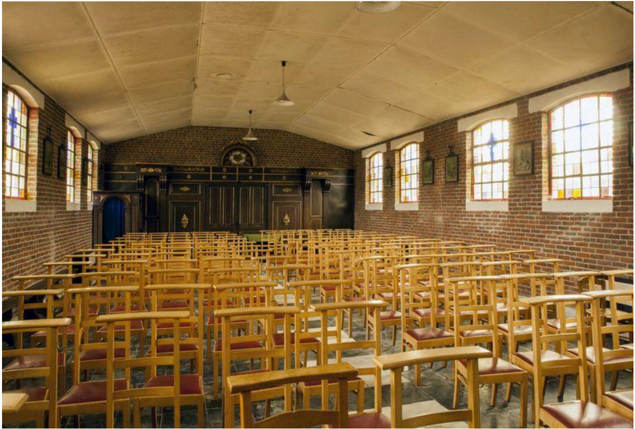
Vue générale depuis l'autel.