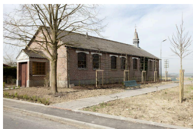
Élévation antérieure et flanc droit.