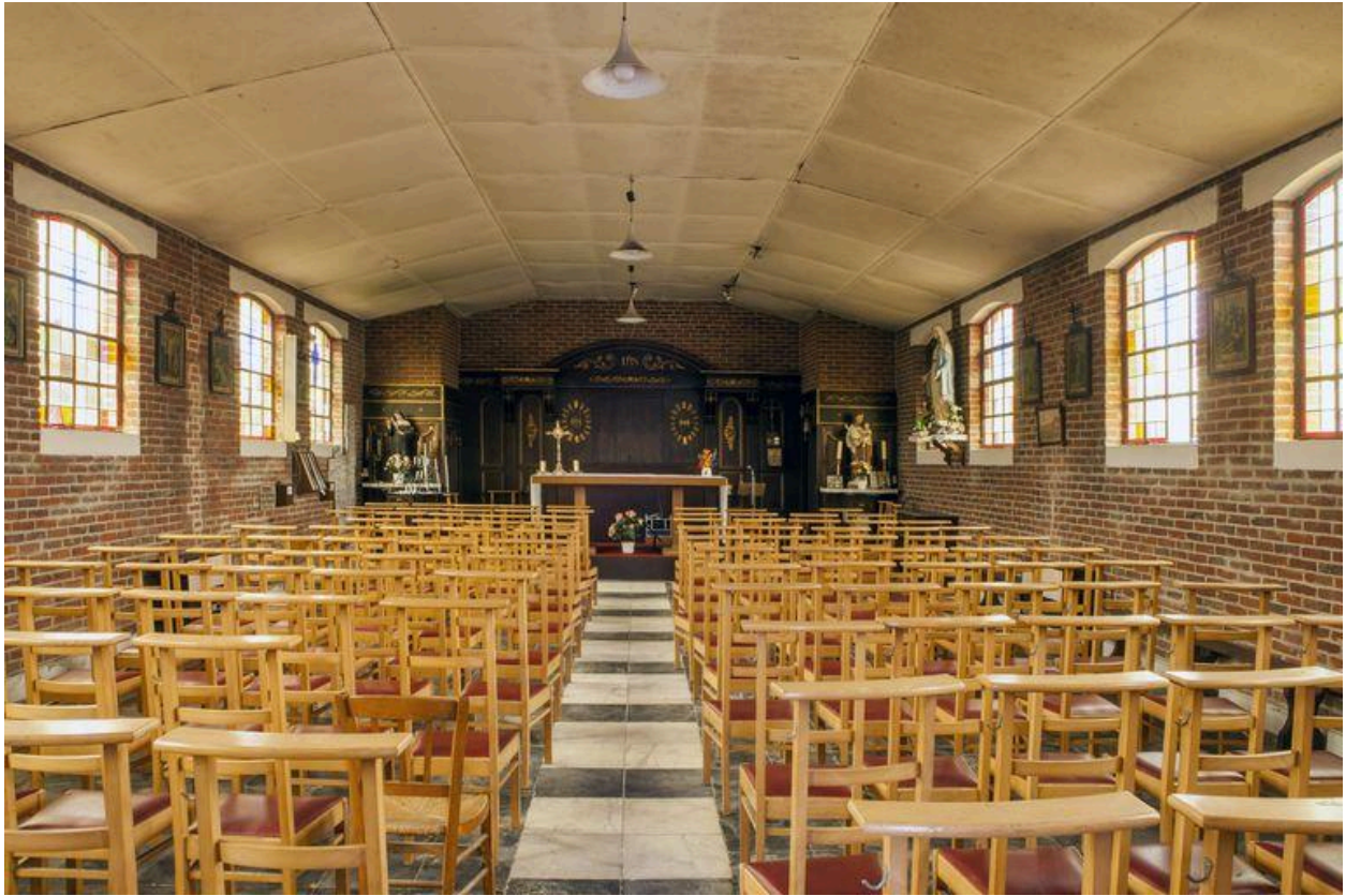
Vue générale vers l'autel.