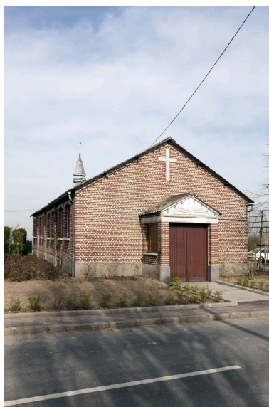
Élévation antérieure et flanc gauche.