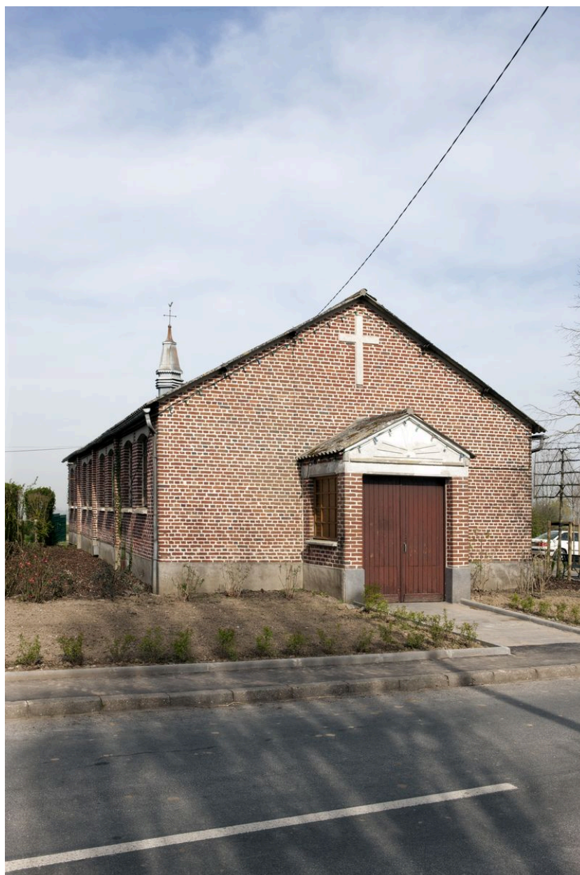
Élévation antérieure et flanc gauche.