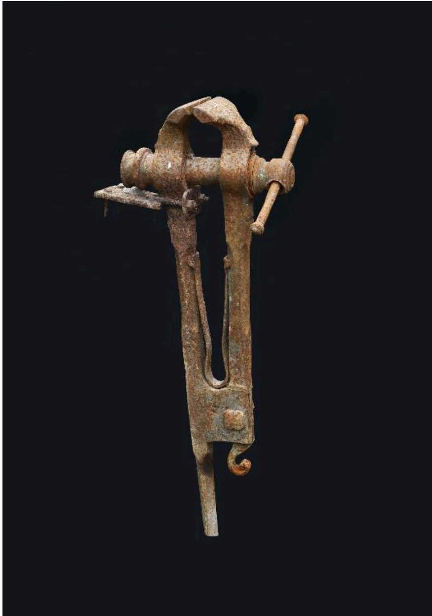
Etau de serrurier.