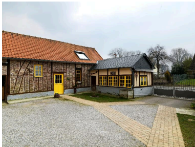
Vue générale depuis la cour. IVR22_20138000056NUC2A