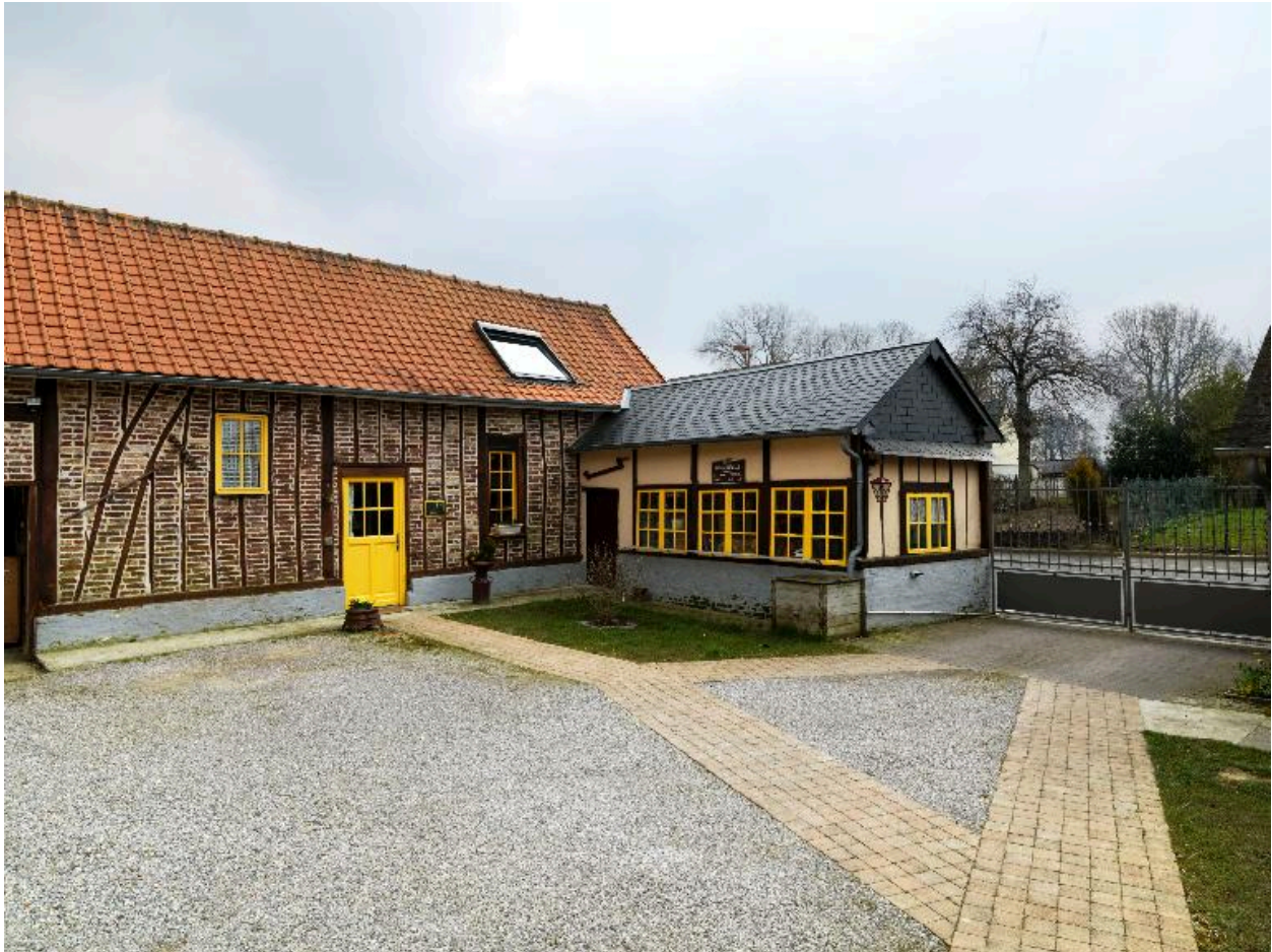
Vue générale depuis la cour.