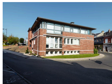
Vue des extensions de la mairie d'Escarbotin.