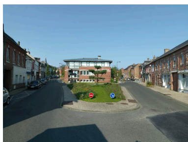
Vue générale des extensions de la mairie d'Escarbotin. IVR22_20148000485NUC2A