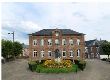
Vue générale depuis la place Jean-Jaurès.