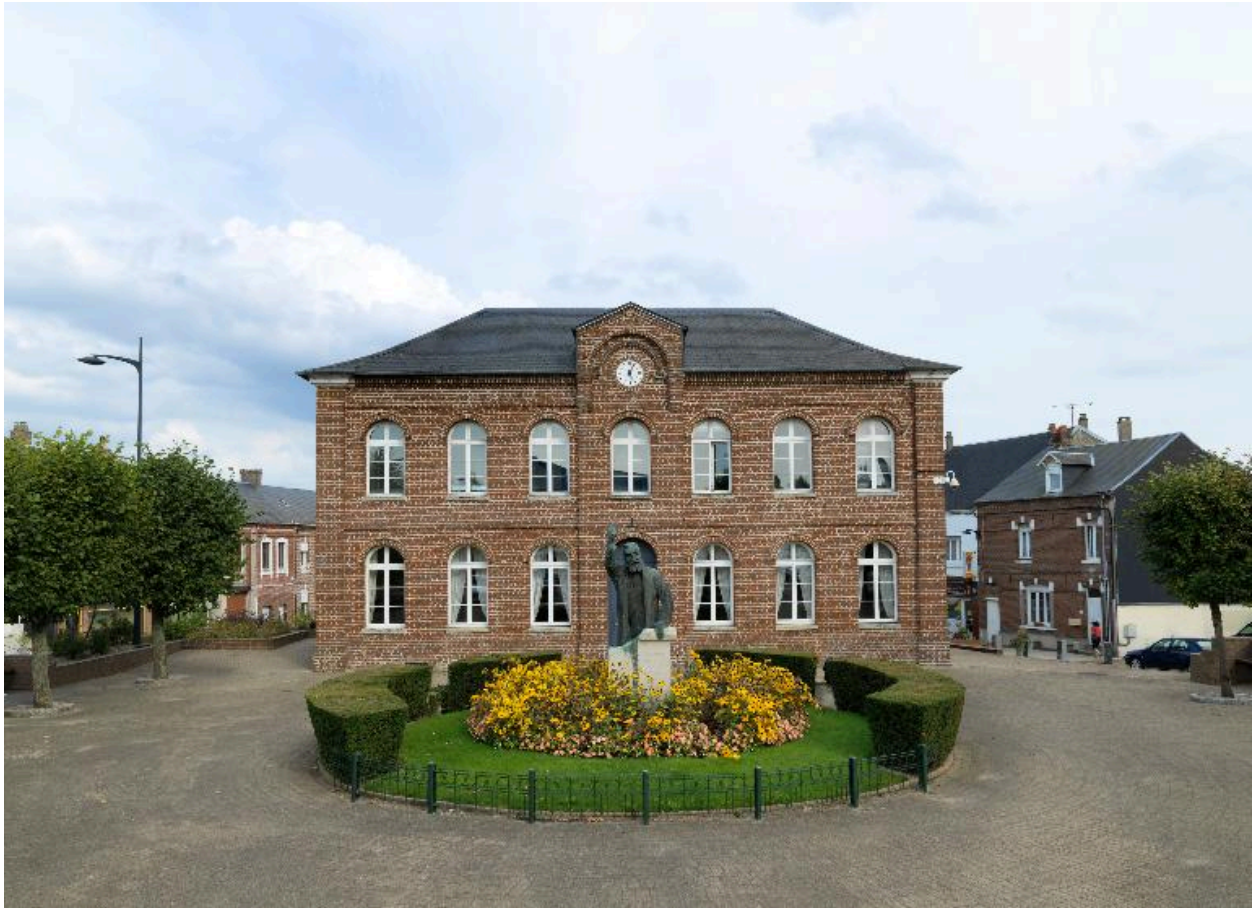
Vue générale depuis la place Jean-Jaurès.