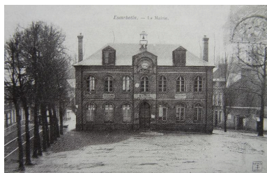
Escarbotin. La mairie, vers 1910. IVR22_20148005178NUC2A