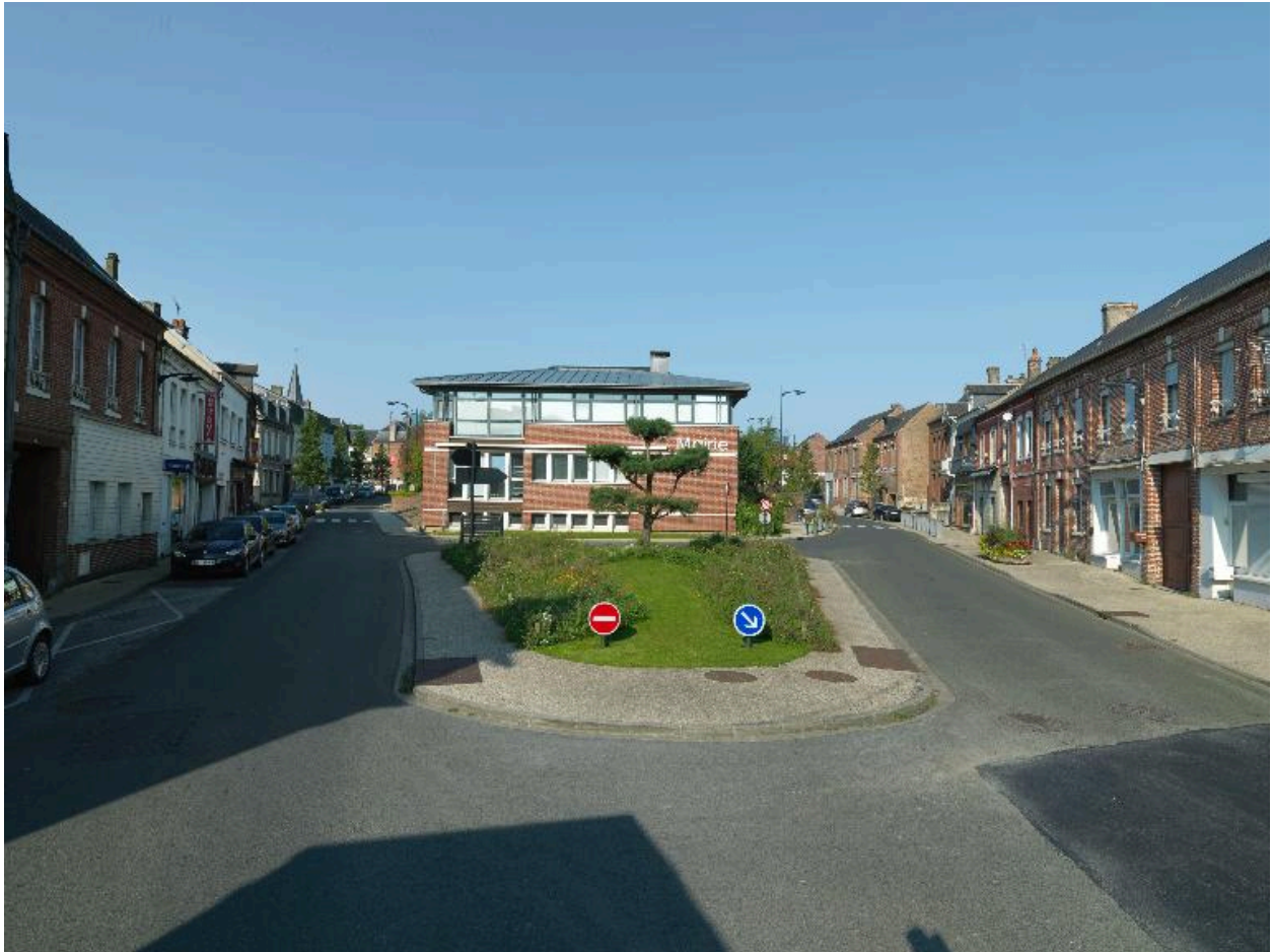
Vue générale des extensions de la mairie d'Escarbotin.