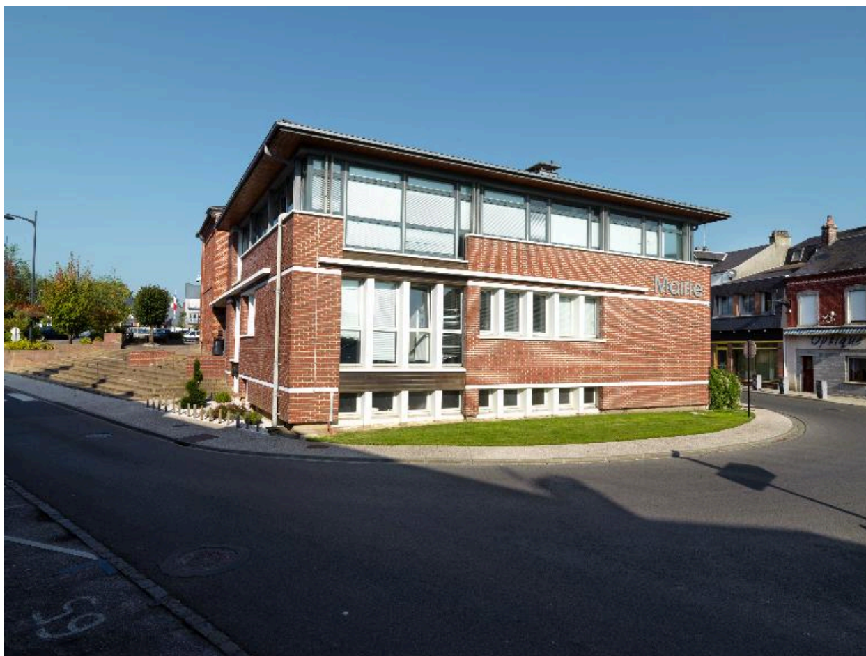
Vue des extensions de la mairie d'Escarbotin.