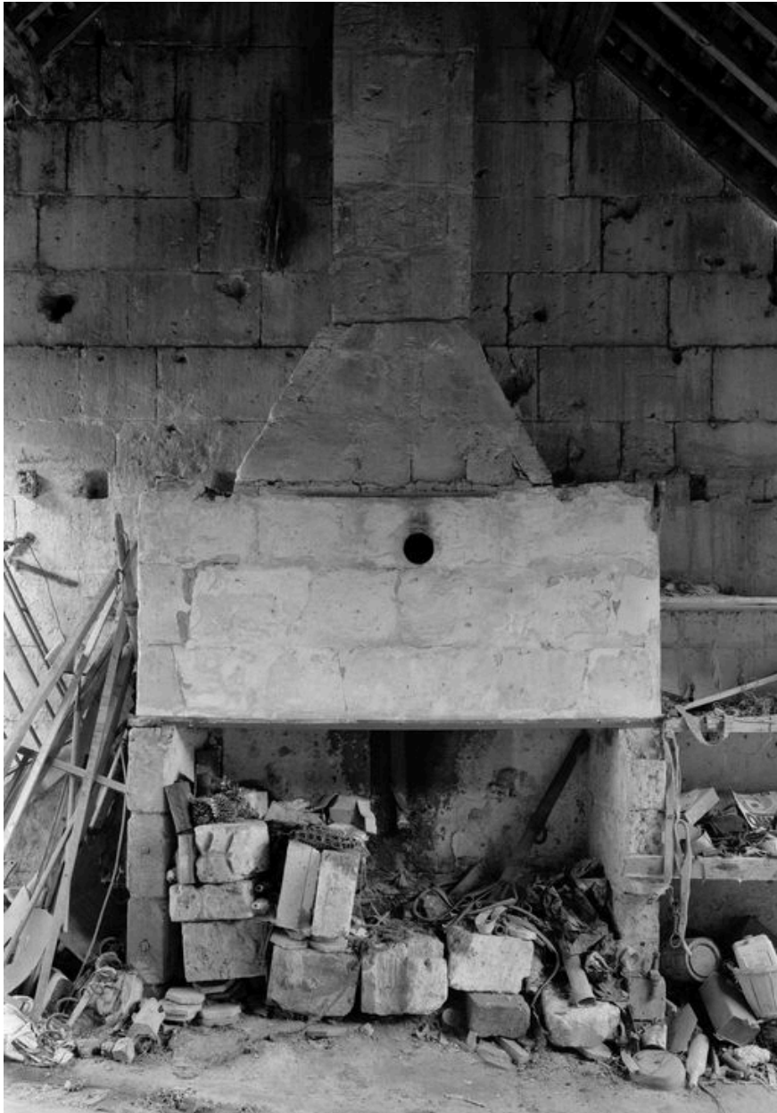
Cheminée du logis.