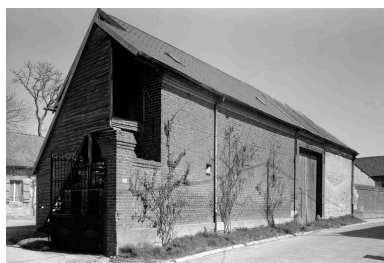
Porche et écurie, sur rue.