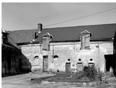
Porcherie et buanderie, sur cour. IVR22_19856000563V