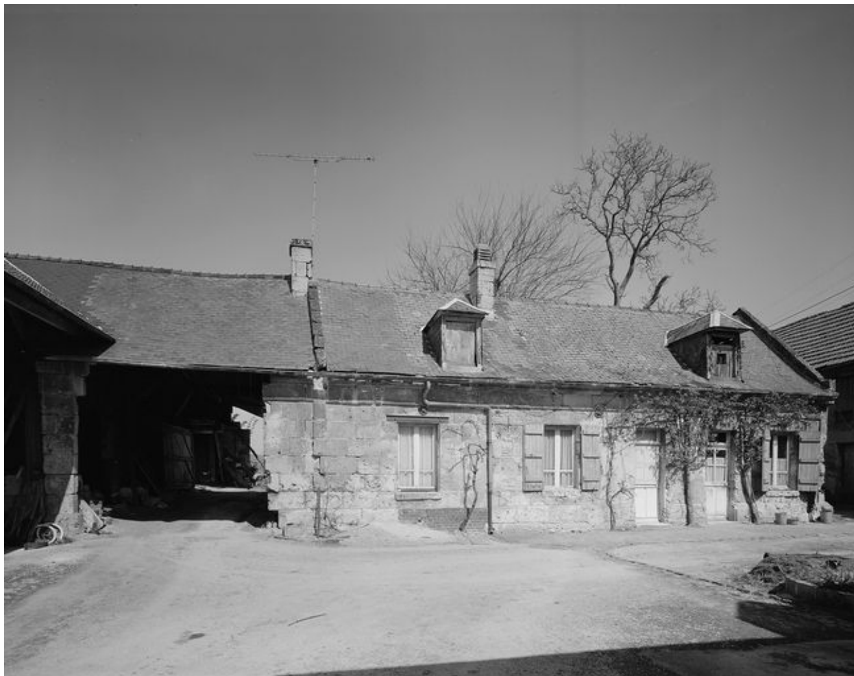
Logis. Elévation sur cour.