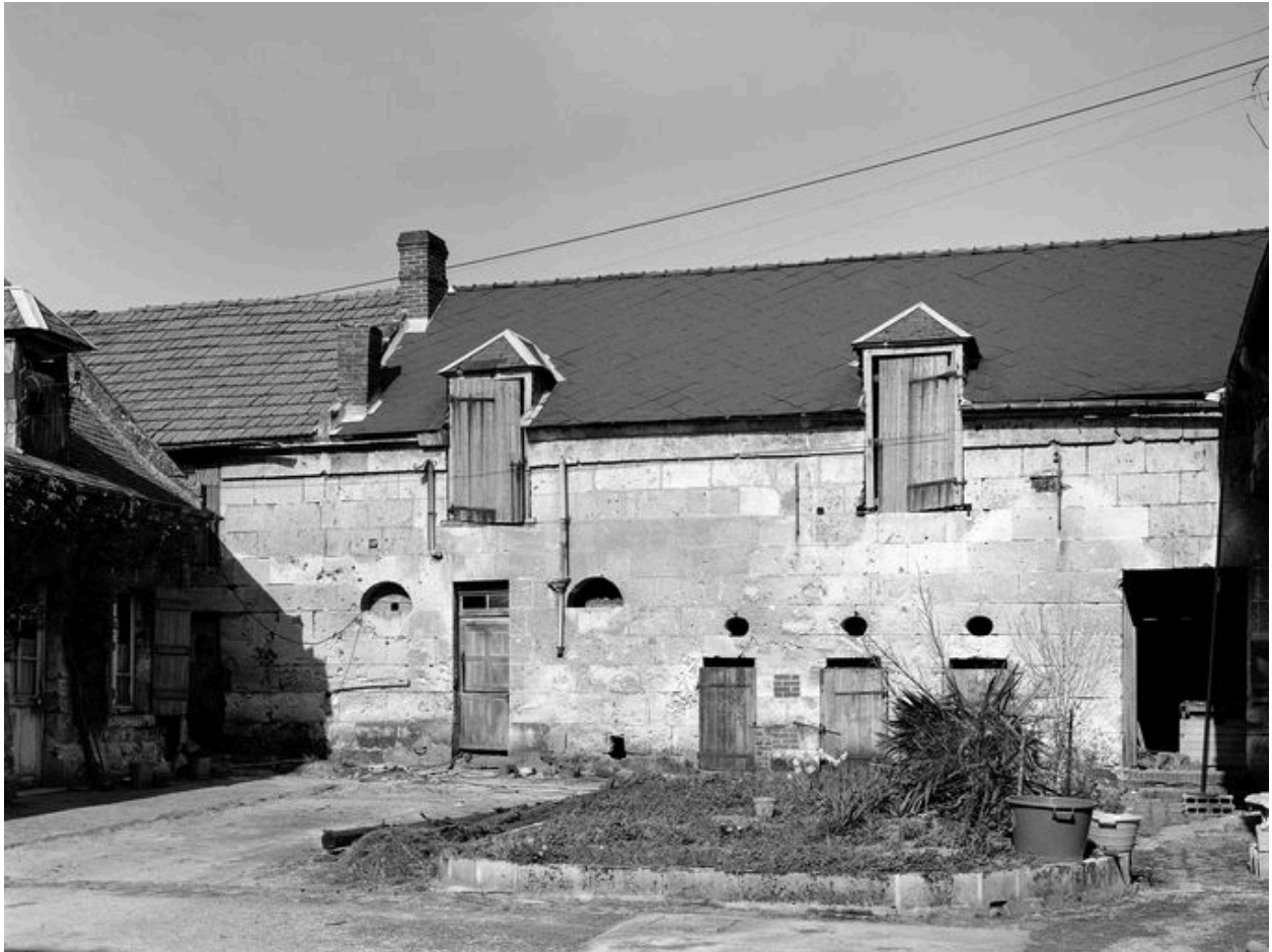
Porcherie et buanderie, sur cour.