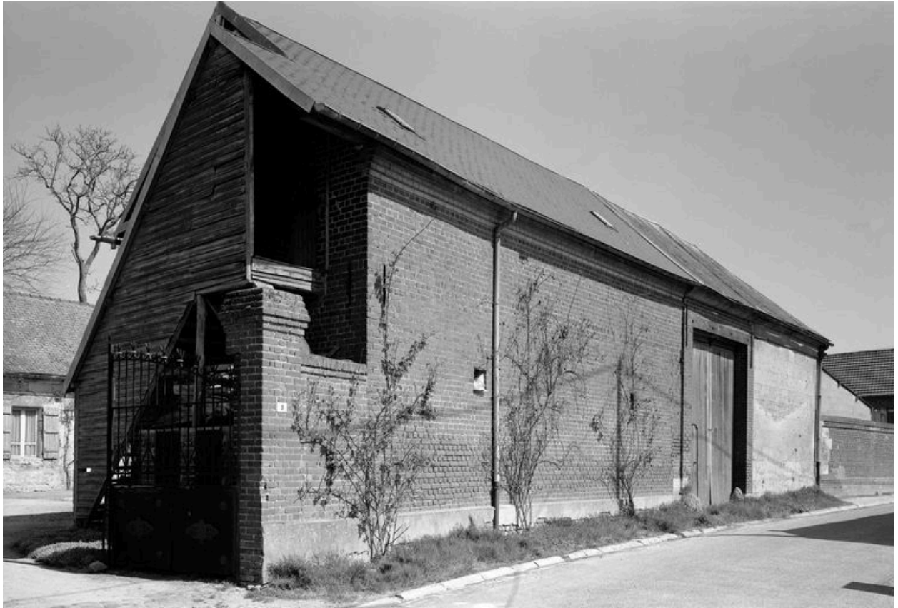
Porche et écurie, sur rue.