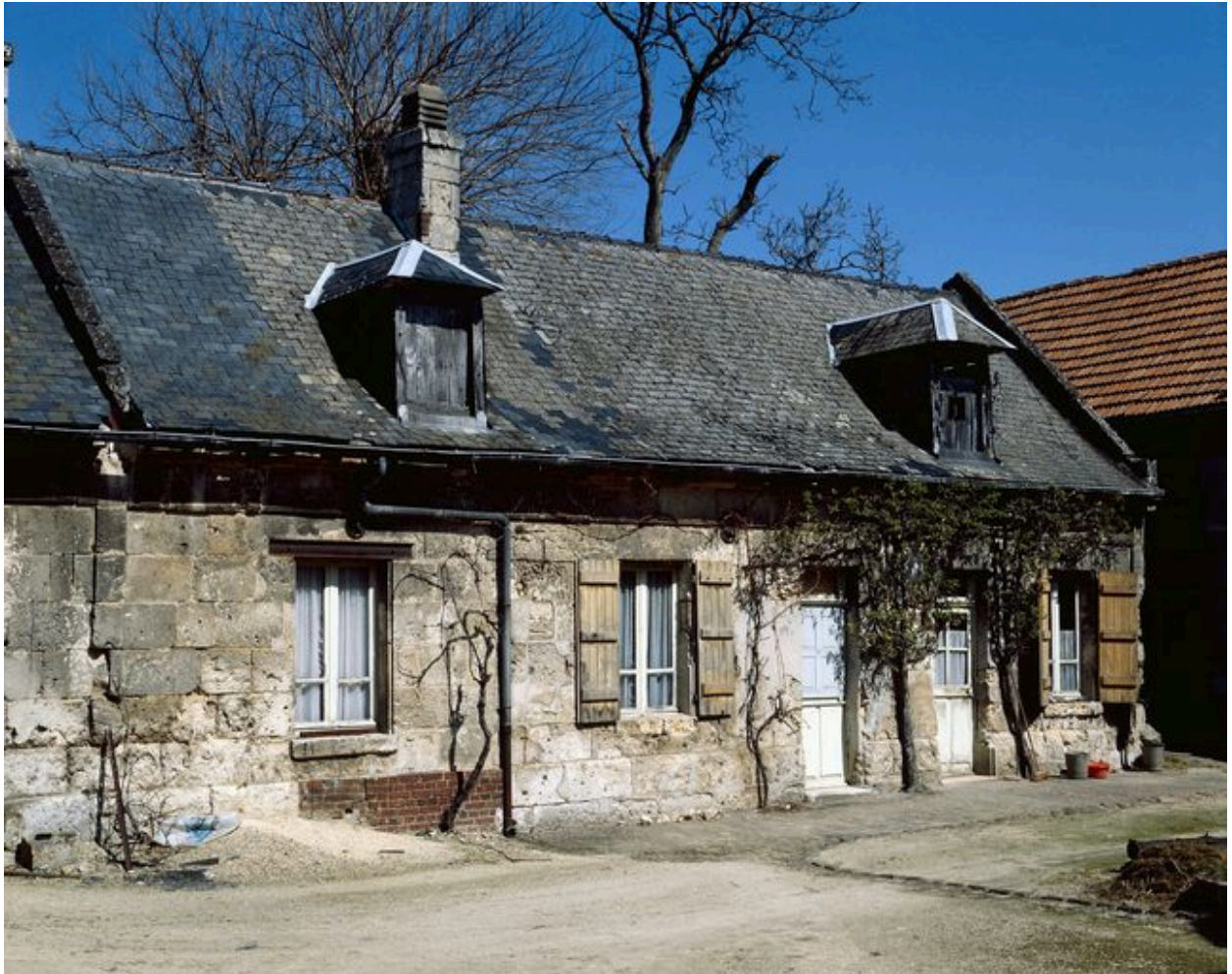
Logis. Elévation sur rue.