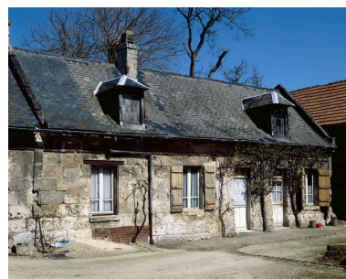
Logis. Elévation sur rue. IVR22_19856000643XA