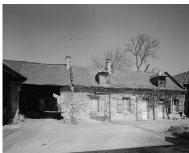
Logis. Elévation sur cour. IVR22_19856000562V