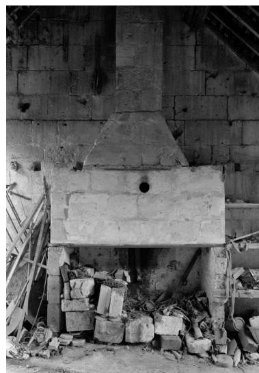
Cheminée du logis. IVR22_19856000564X