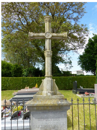
Vue de la croix funéraire.