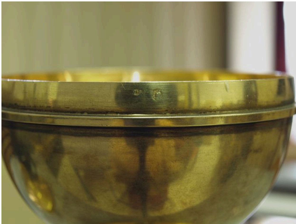
Vue de détail : poinçons sur le bord extérieur de la coupe