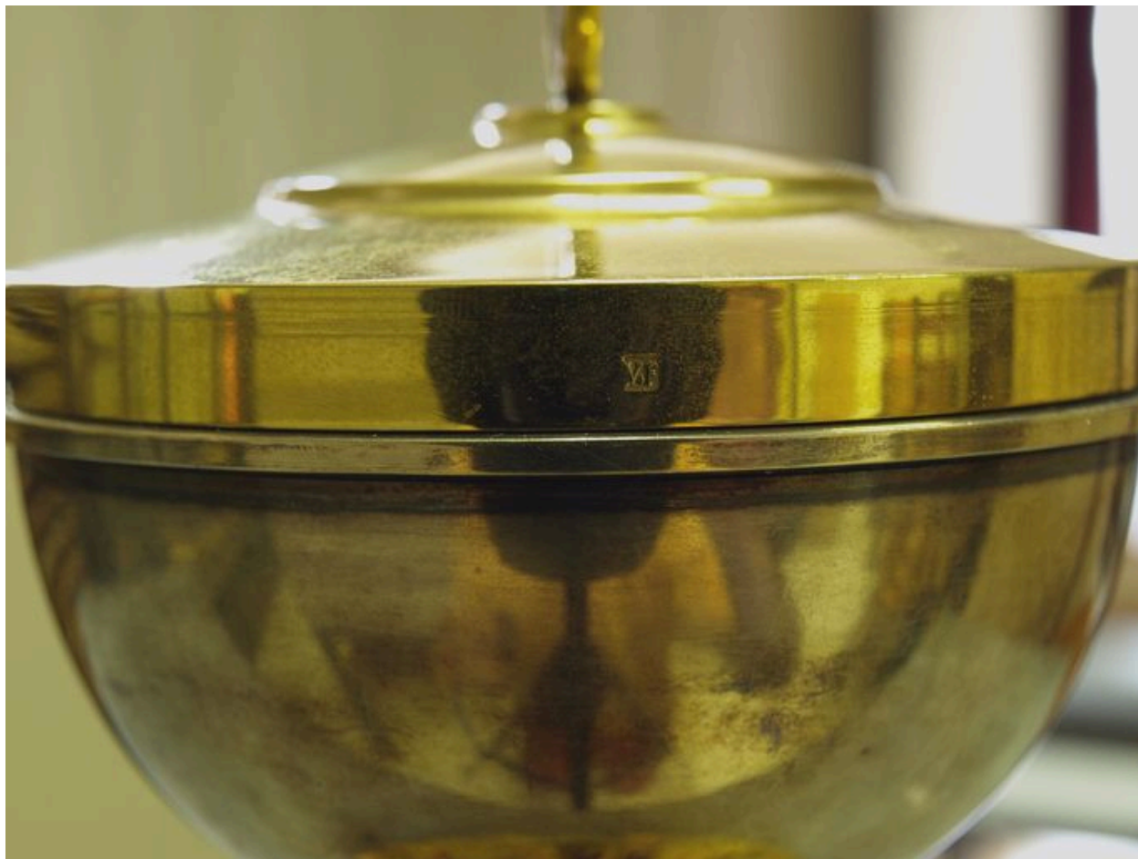
Vue de détail : poinçon sur le couvercle