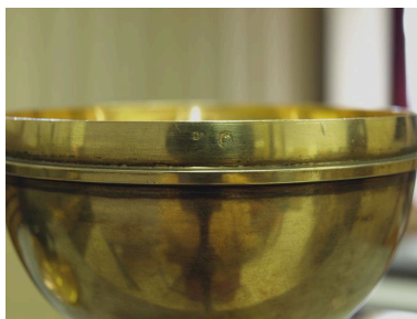
Vue de détail : poinçons sur le bord extérieur de la coupe IVR31_20106204030NUCA