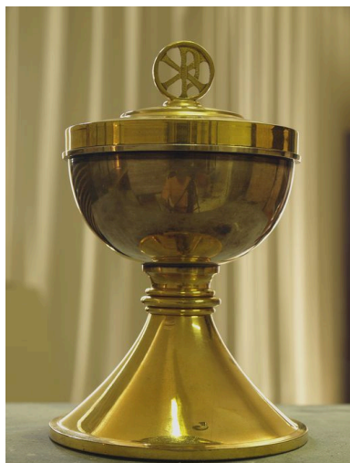
Vue générale IVR31_20106204028NUCA