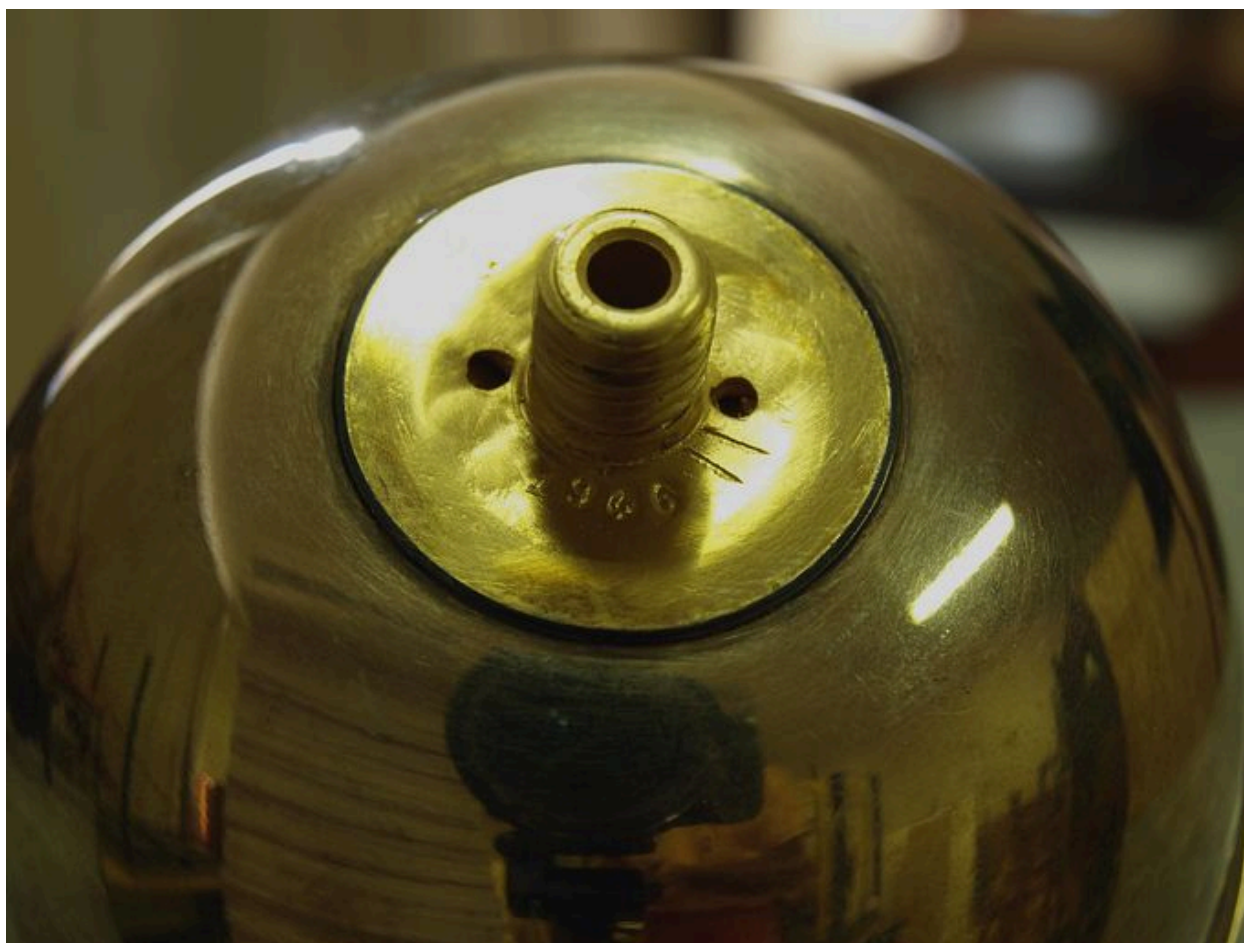
Vue de détail : 1946 sous la coupe