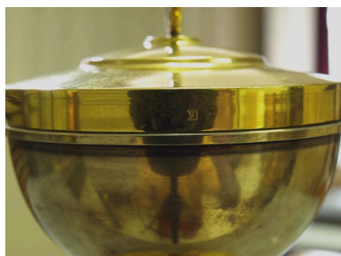
Vue de détail : poinçon sur le couvercle IVR31_20106204029NUCA