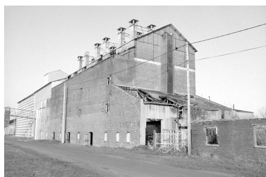
Atelier de fabrication, élévation antérieure. IVR22_19908001496Z