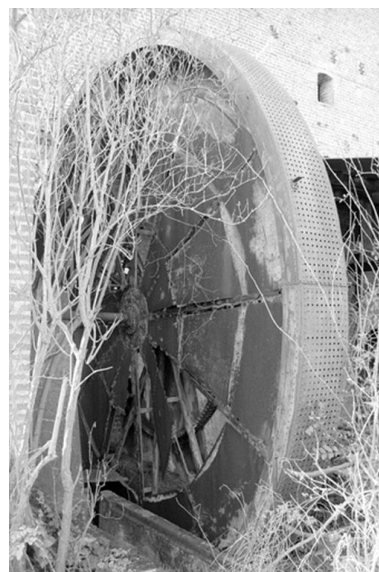
Roue de lavage. IVR22_19908001494Z