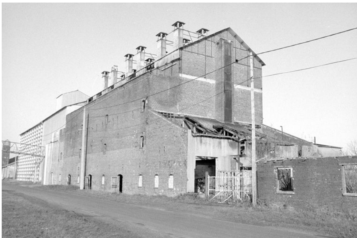
Atelier de fabrication, élévation antérieure.