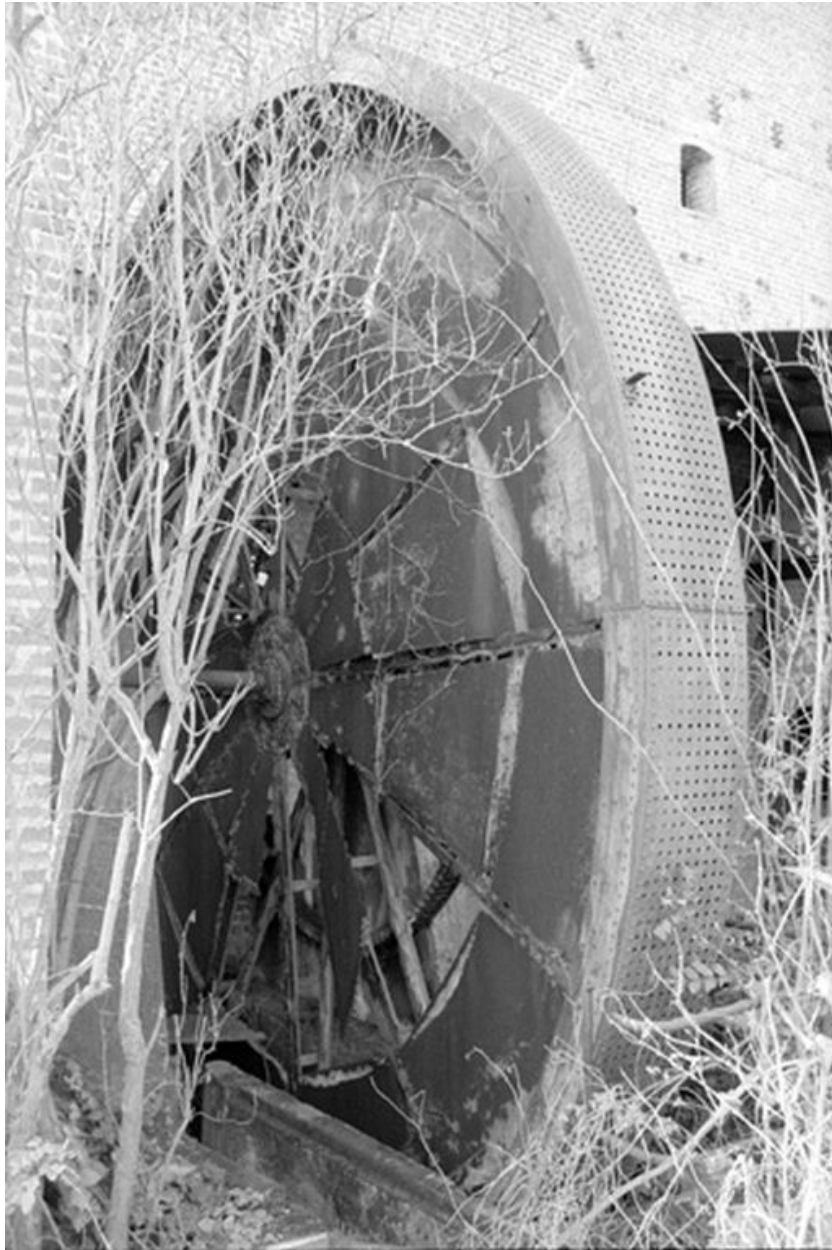
Roue de lavage.