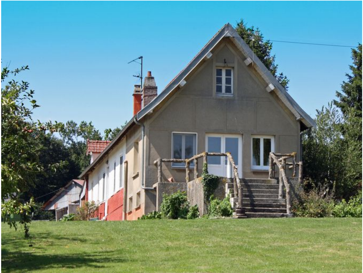
Le logement, vue de l'entrée sur le pignon.