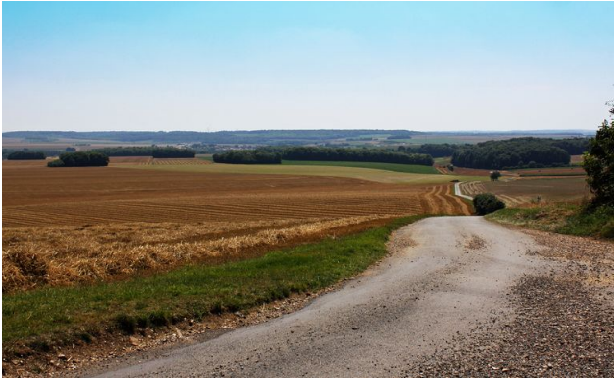
Vue du plateau de Ville-le-Marcelet, depuis la ferme de Réderie.